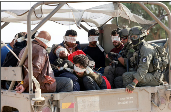
21/11: soldados israelíes se llevan detenidos a presos palestinos en Gaza

¡Ese es el camino! ¡Viva la lucha internacionalista!