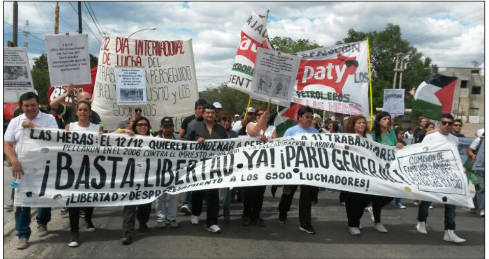
Argentina - 12/12/2013: movilización a los tribunales de Caleta Olivia, Santa Cruz, que condenaron a cadena perpetua y cárcel a los petroleros de Las Heras