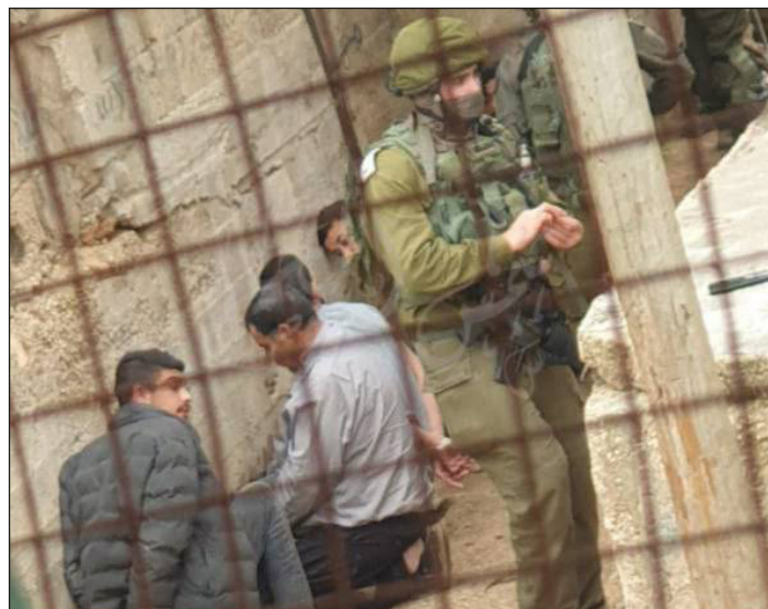
El ejército fascista de Israel detiene a presos palestinos en Cisjordania

Ayunaron todos juntos un día en defensa de los presos políticos palestinos, siguiendo el camino de 20 presos políticos vascos que hicieron la misma acción el 27 de octubre. Han sido las voces de los más de 10.000 hombres, mujeres y niños cautivos en condiciones inhumanas del Estado sionista genocida. Nuestros revolucionarios saben que la solidaridad internacional es el arma de los pueblos del mundo. Saben que los pueblos del mundo tienen los mismos enemigos; el imperialismo, el fascismo y el sionismo. Después del 7 de octubre se está produciendo un genocidio en Palestina. El sionismo israelí y el imperialismo de la UE-EE.UU. están atacando Gaza, que está bajo asedio total. Pero la heroica resistencia del pueblo palestino y de las organizaciones palestinas continúa contra las masacres de las fuerzas de ocupación. Nuestros prisioneros saben que la victoria de la heroica resistencia palestina será un golpe fatal para los gobiernos que los encarcelaron por ser revolucionarios.