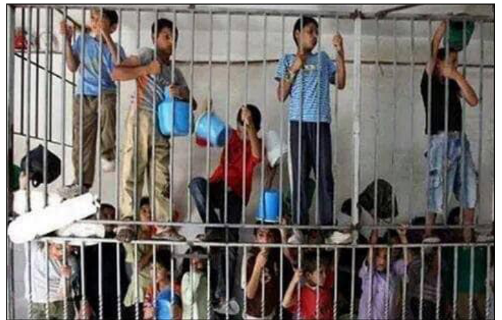
Niños palestinos presos en las cárceles del sionismo

El 24 de noviembre, 36 presos políticos en las cárceles europeas realizaron una huelga de hambre por la libertad de todos los presos en las mazmorras del ocupante sionista armado y comandado por el imperialismo yanqui. Esta enorme acción internacionalista, también la llevaron adelante los Presos Políticos de Grecia que fueron parte de esa jornada, así como previamente también la realizaron los presos Vascos el 27 de octubre.