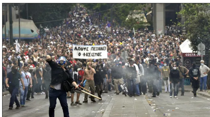
Combates de la juventud griega contra la policía de la Troika

La iniciativa revolucionaria palestina del 7 de octubre de 2023 es una nueva culminación histórica de la lucha por la liberación social. La ruptura de la fortaleza colonialista sionista marca la deconstrucción del antiguo régimen de poder imperialista en todo el mundo. Por eso la OTAN, a través de su gendarme israelí y con