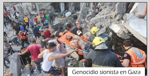
Genocidio sionista en Gaza