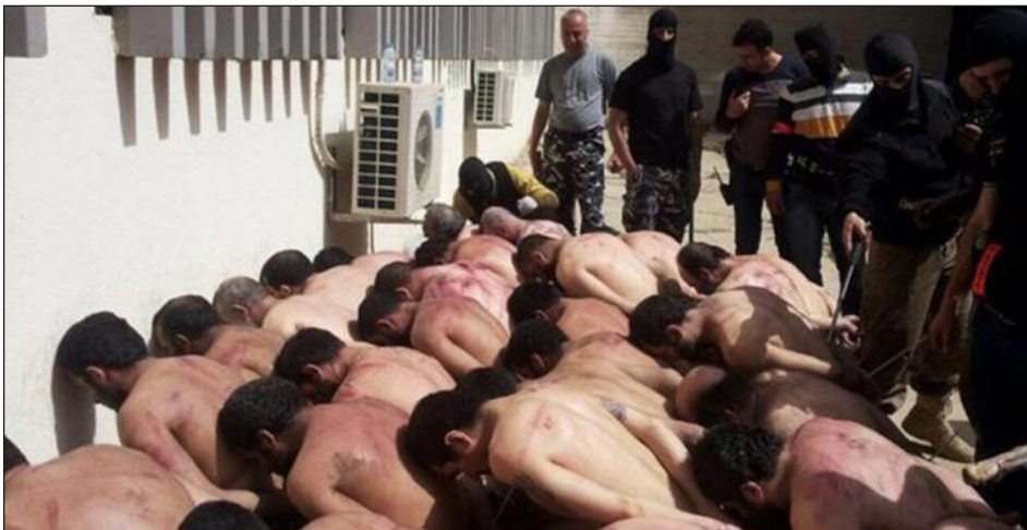
Presos sirios en las cárceles del fascista Al Assad

Así como el imperialismo hoy comanda la masacre en Palestina, este ha demostrado de lo que son capaces de hacer luego de mostrarle al mundo el brutal genocidio en Siria impuesto por el fascista Al Assad y Putin, bajo el mando de EEUU.