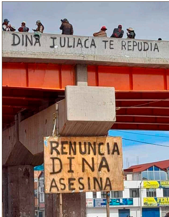
¡La sangre derramada jamás será olvidada ni entregada!

Contra los jueces y fiscales de la justicia fujimorista que garantizan la impunidad de los represores y verdugos del pueblo, ¡por tribunales obreros y populares, encabezados por los familiares de nuestros hermanos masacrados, para juzgar y castigar a todos los asesinos de nuestros mártires! ¡La sangre derramada jamás será olvidada! ¡Libertad a todos los presos políticos por luchar y desprocesamiento de todos los luchadores!