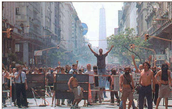
Argentina: combate revolucionario del 2001

Ayer, en el primer lustro del siglo XXI, con la estafa de la "revolución bolivariana", las burguesías nativas expropiaron la ofensiva antiimperialista de las masas del continente. Unir a los pueblos de América Latina con la clase obrera norteamericana es una tarea que solo los revolucionarios internacionalistas podemos llevar adelante. Para ello hay que romper todo sometimiento, pactos y acuerdos con los verdugos "democráticos" de los trabajadores y el pueblo.