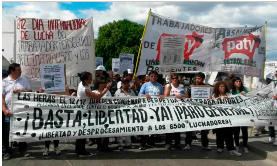
2013: movilización por la libertad de los petroleros de Las Heras

El FIT-U silenció que los obreros petroleros de Las Heras (Santa Cruz) fueron