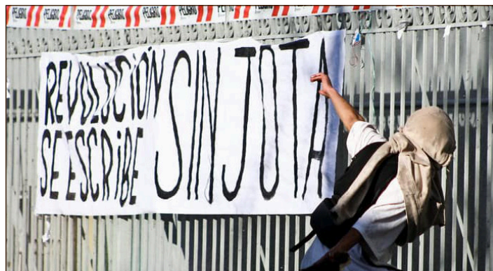
"Revolución se escribe sin Jota", el alusión a la juventud del PC

Por eso hacemos responsables al PC si algún militante del POI-CI o de la FLTI en Chile sufre algún ataque físico. También lo hacemos responsables si algún luchador que se levante en contra del stalinismo que está en el gobierno es agredido, perseguido o amedrentado.