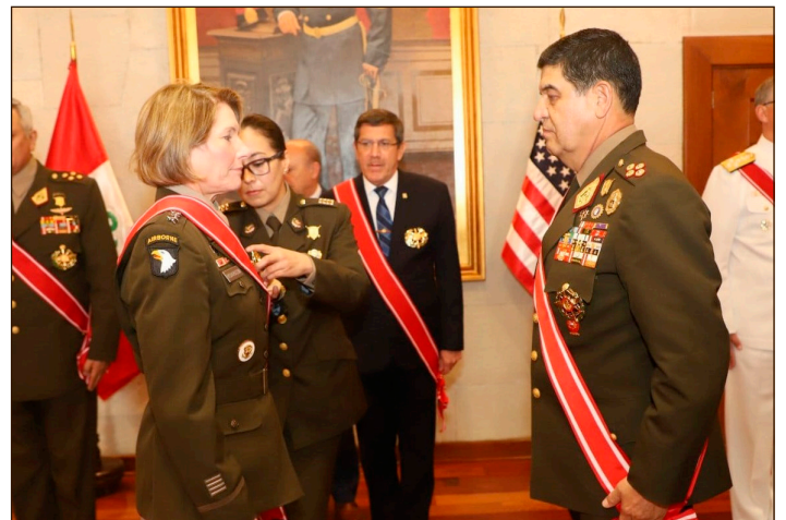
Generales de las FFAA fujimoristas condecoran a la asesina Richardson

La generala Richardson es la nueva virreina de América Latina que con la IV Flota de la armada norteamericana, están garantizando el saqueo imperialista en toda la región.