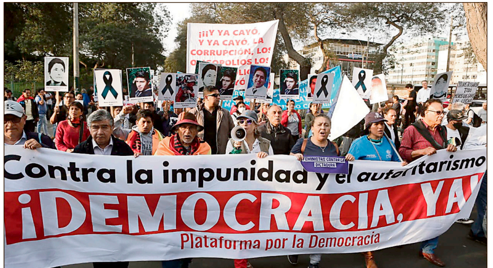
La “Plataforma por la Democracia” de la burocracia stalinista CGTP y partidos burgueses del régimen

Mientras tanto, la usurpadora Boluarte que todos ellos sostuvieron, sigue teniendo las manos libres y acaba de decretar el “estado de emergencia” en los principales barrios obreros de Lima (San Juan de Lurigancho y San Martín de Porres) y en Sullta en Piura, al norte del país. Con la excusa de la “inseguridad” sacarán el ejército a las calles para mantener a raya a la clase