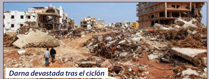
Darna devastada tras el ciclón

Miles de manifestantes de Darna marcharon al grito de "el pueblo