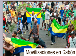
Mobilizaciones en Gabón

¡Fuera el imperialismo de Gabón y toda África