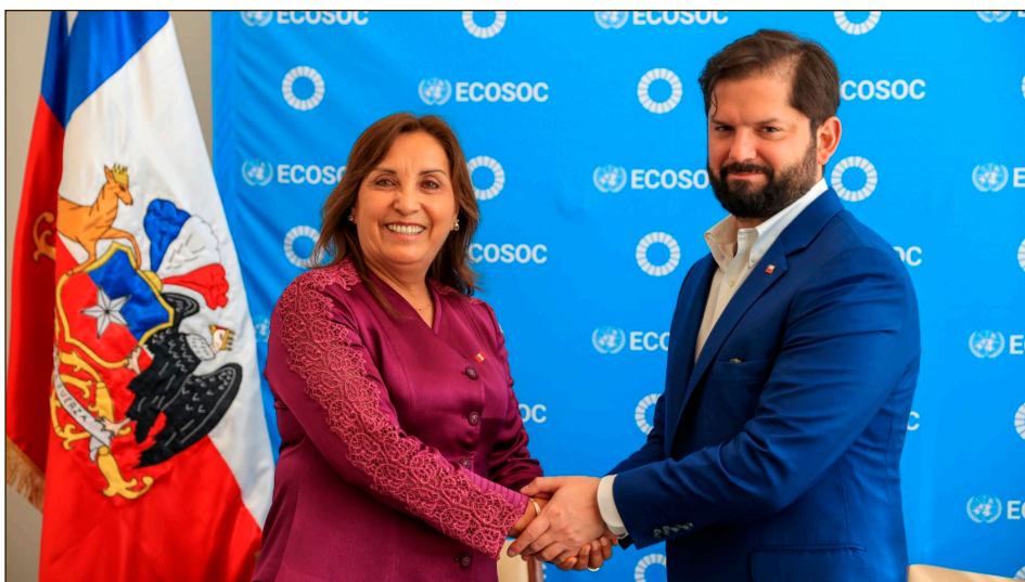
Los lacayos de Boric y Boluarte reunidos en EEUU

Este lugar destacado para los yanquis también lo ocupa Chile que igualmente formará parte de la APEP. Esto no es casual: después de la traición al combate revolucionario de masas de 2019, el gobierno de Bo-