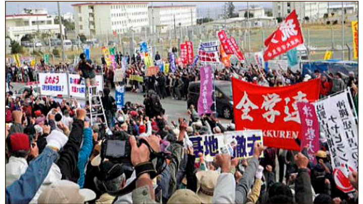
Movilización de los jóvenes revolucionarios Zengakuren de Japón

El gobierno japonés liderado por el neofascista Fumio Kishida se sintió aliviado por el surgimiento de un gobierno pro-yanqui en Perú a través del golpe de Estado. Kishida no sólo está dando un impulso a los capitalistas monopolistas japoneses que están incursionando en el mercado peruano; él también está planeando desarrollar una mayor cooperación militar con Perú. ¡Esto no debe permitirse! La administración estadounidense está haciendo intentos frenéticos de movilizar a este gobierno japonés liderado por Kishida y a otros detentadores de poder obedientes a Estados Unidos en el mundo, tratando así de alguna manera de contener a la China liderada por Xi Jinping, ahora presentada como el "archienemigo" de Estados Unidos. Joe Biden, jefe del decadente Estado imperialista de Estados Unidos, está empeñado en construir una red militar de cerco contra China (y Rusia) en las regiones de Asia y el Pacífico, fortaleciendo y ampliando así aún más las bases militares estadounidenses en esta zona. Esto es particularmente cierto en Japón, que se encuentra en la primera línea contra China. Se está construyendo a la fuerza una enorme y nueva base estadounidense en Okinawa a pesar de los feroces movimientos de