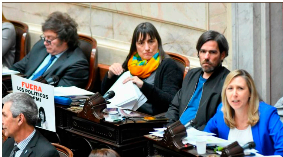
Los diputados del FIT-U en el Congreso

El FIT-U hizo un verdadero frente político con la burguesía, como lo viene haciendo hace años votándole decenas y decenas de leyes a los verdugos del pueblo en esa cueva de bandidos de testaferros de Wall Street.