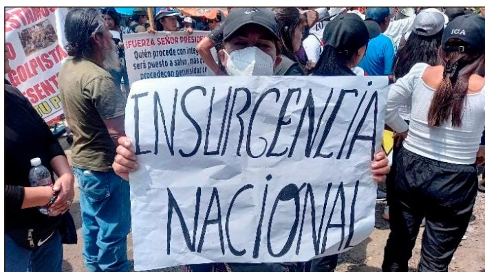
El grito revolucionario de masas contra el golpe de Dina y los yanquis

¡Disolución de la casta de oficiales de las FFAA fujimoristas, tutelada por los yanquis y su IV Flota del Pacífico! ¡Disolución de la policía y todas las fuerzas represivas del Estado!