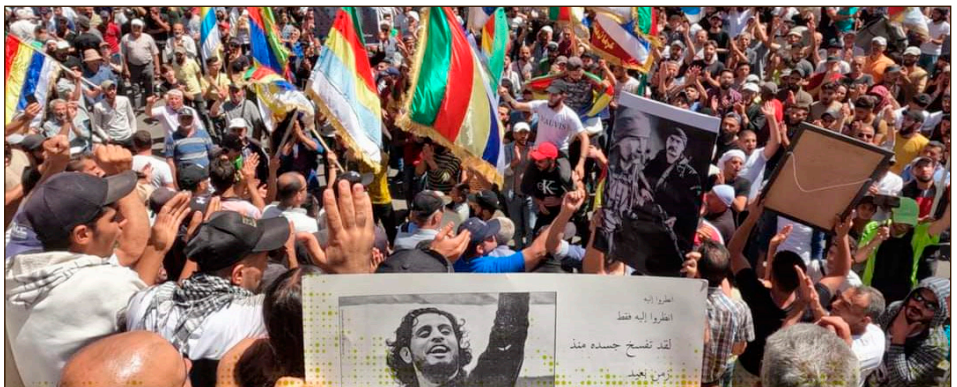
Marcha en Swayda levantando la imagen de Abd el Basset Sarout, mártir de la revolución

El levantamiento de las masas hizo volar por los aires los planes de Al Assad e Irán de descargar sobre ellas todo el peso de la crisis en la que entró por los precios de sus importaciones. Pero también hizo volar por los aires los acuerdos de la partición de la conferencia de Ginebra,