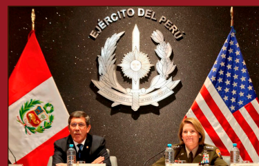
Richardson y el ministro de defensa de Dina

¡Hay retomar el combate revolucionario de obreros y campesinos para expulsar al imperialismo y echar abajo al gobierno de Dina, el Congreso y todo el régimen fujimorista!