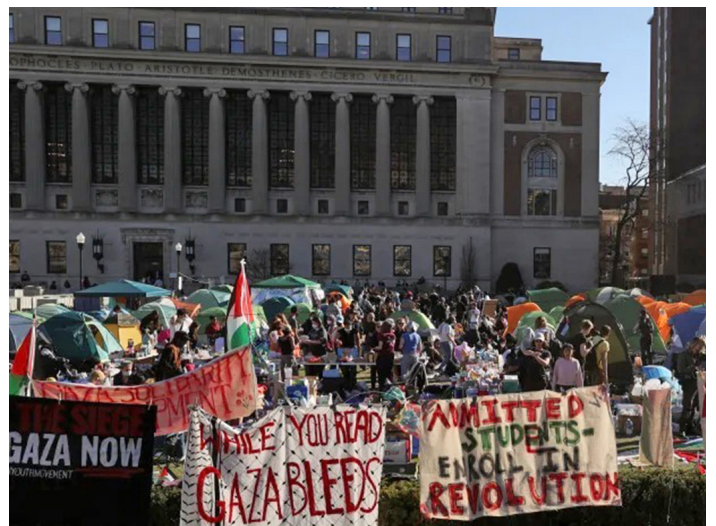
Concentración en las tomas de los campus de EEUU “Mientras lees esto, Gaza sangra”

Biden y Nentanyahu: ¡Asesinos y genocidas del pueblo palestino!