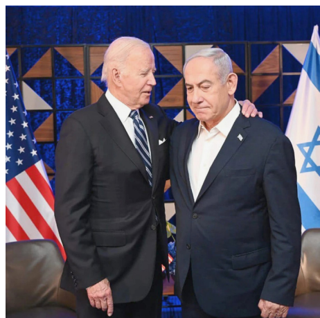
Biden y Netanyahu

Así los estudiantes no solo reciben la represión policial, sino también el ataque de hordas fascistas de sionistas que, bajo el amparo de la policía, atacaron brutalmente a los estudiantes universitarios de UCLA (Universidad de California en Los Ángeles). Y por si fuera poco, la burguesía empresarial de EEUU ha amenazado que