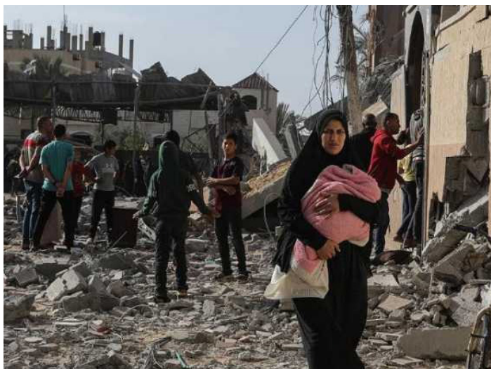
Ciudad de Rafah luego de los bombardeos del sionismo

¡Paremos la masacre y exterminio del sionismo en Rafah, Gaza y toda la Palestina!