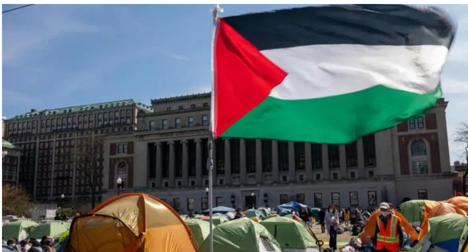
Campamento de universitarios de EEUU contra el genocidio en Palestina

1. Negarse a transportar mercancías procedentes o destinadas a "Israel".