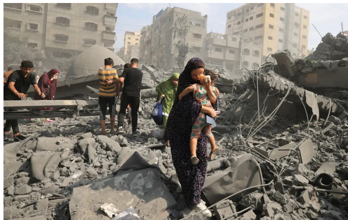
Genocidio del sionismo sobre Gaza

Lamentablemente, a los estudiantes y obreros norteamericanos les dijeron que apoyen al “progresivo” Sanders y a través de él a Biden contra el “fascista” Trump, sin embargo, Biden resultó ser mas sangriento y asesino como lo podemos ver hoy comandando al sionismo en Palestina. Y es que los aliados de los estudiantes de EEUU son los obreros de las automotrices de la UAW, los portuarios de Oackland, la clase obrera negra, que tienen toda la autoridad para tomar en sus manos el lla-