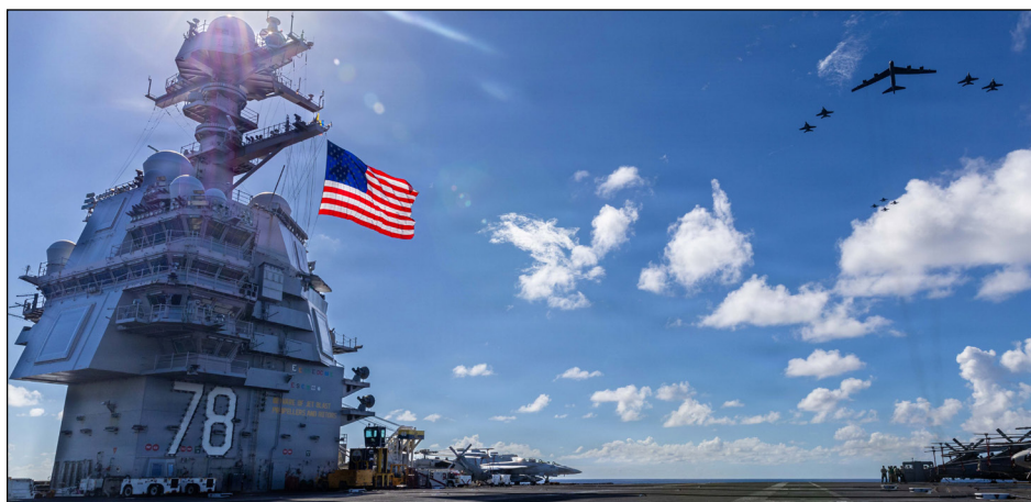
Despliegue militar yanqui en el Caribe con el portaaviones USS Gerald R. Ford, el más grande del mundo

De Alaska a Tierra del Fuego, ¡una sola lucha antiimperialista contra los piratas de Wall Street!