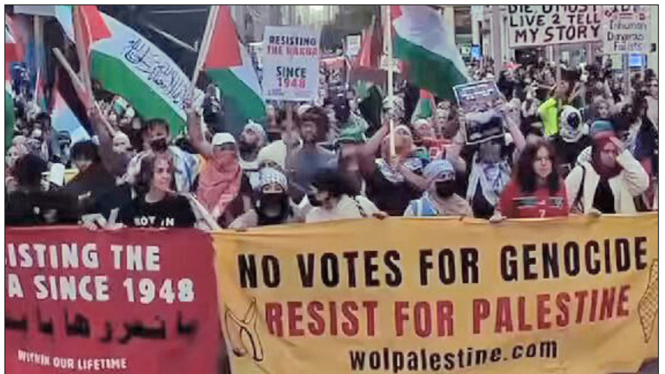
2024: la juventud de EEUU gana las calles por Palestina denunciando a Biden y Trump por genocidas

Mucho menos Mamdani llama a derrotar a Trump en las calles. Su único objetivo es que vuelva a resurgir el Partido Demócrata imperialista y jugar el mismo rol que antes jugaron Obama o el pro-sionista Sanders, que llamó abiertamente a apoyarlo.