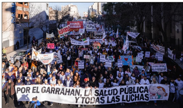
Movilización de los trabajadores del Hospital Garrahan

Esta es una encrucijada de la cual el proletariado debe salir rápidamente. Y eso no se define en los votos en las urnas que terminan de contarse, sino en la lucha de clases.