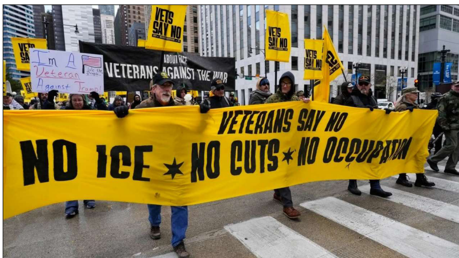
Noviembre 2025: manifestación de veteranos de guerra en EEUU al grito de "¡No a ICE! ¡No a los recortes! ¡No a la ocupación!"

EEUU el enemigo está en casa y es el que hay que derrotar antes de que, como hizo en Medio Oriente, llene de sangre América Latina y el mundo entero.