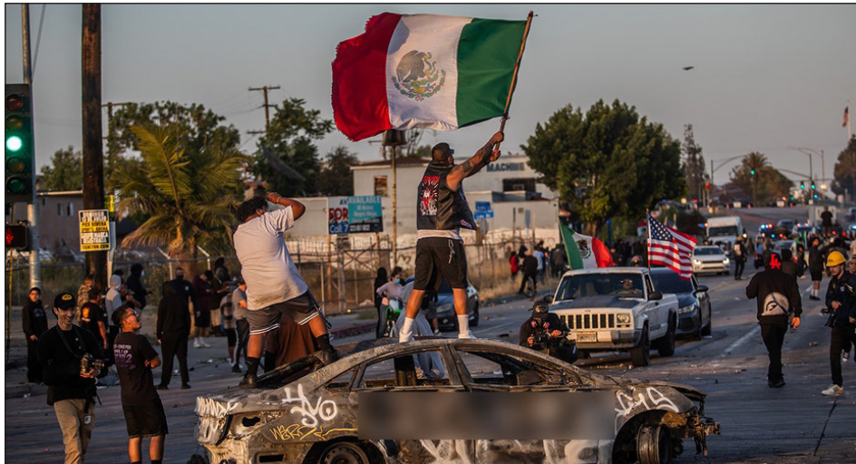
La "Batalla de Los Ángeles" contra el ataque fascista de Trump a los obreros hispanos

Como se gritaba en Minneapolis: ¡Disolución de la policía, de ICE y todas las