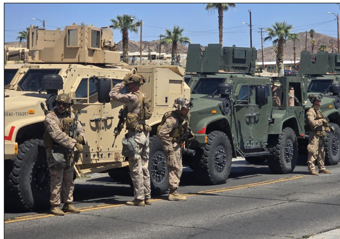
Marines yanquis enviados por Trump a Los Ángeles

cos (policías) rojos”, que resultaron ser, como decía la juventud sublevada, los verdaderamente peligrosos, que sacaron a las masas de la lucha de la Plaza de la Dignidad para someterlas nuevamente al régimen pinochetista de las bases yanquis.