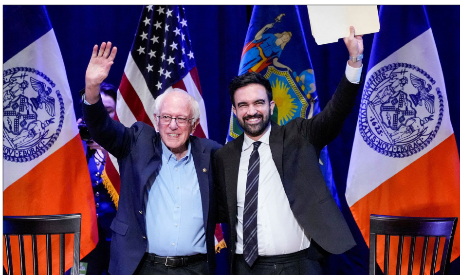
Mamdani junto a Sanders, el “ala izquierda” del Partido Demócrata

Tampoco son “democráticos”: condenaron a la heroica resistencia palestina y