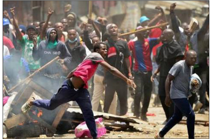
Combates en Tanzania

En la época de la esclavitud, el amo esperaba que el niño creciera para que ya maduro le sea útil como esclavo, cuando tuviera mayor vigor y fortaleza. En cambio, vaya paradoja, en este podrido sistema capitalista, la explotación infantil le ahorra el pago de salarios a la burguesía y los esclaviza en las cosechas y la minería, aprovechando las manos pequeños de los niños, que en su mayoría no llegan a vivir 30 años.