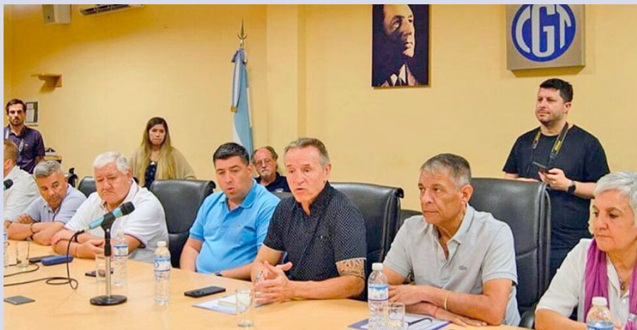
La cúpula de la CGT y diputados del PJ se preparan para discutir la reforma laboral en el parlamento

tiene que sacarse de encima a los traidores que la entregan. Tiene que ir por ellos y por esa burguesía ladrona de lúmpenes, narcos y vagos que viven a costa de la superexplotación obrera y el saqueo de la nación.