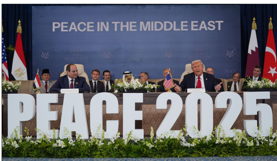
Trump preside la "Cumbre de Paz" de Egipto

la mitad de la Franja de Gaza, sigue atacando lo que "le parece necesario" y está realizando nuevas redadas y ataques en Cisjordania y el sur del Líbano. Este camino es el que profundizará de terminar de imponerse en Gaza. Un triunfo para el sionismo es un triunfo para el imperialismo, a partir del cual los yanquis, fortalecidos, redoblarán su ofensiva contrarrevolucionaria como en Siria ocupando territorio. ¡No se puede imponer ese ultimátum que solo prepara nuevas masacres! ¡Solo se terminará con el genocidio y habrá paz real y duradera en una Palestina libre del río al mar sobre la base de la destrucción del Estado sionista-fascista de Israel!