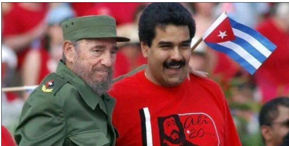
Maduro junto a Fidel Castro en Cuba (2013)

Para evitar un nuevo “Caracazo”, Maduro y los generales de las FFAA, impusieron un bonapartismo policíaco contra las masas reprimiendo cada levantamiento. Pero su gobierno también se apoyó a grado extremo en la estatización de los sindicatos liquidando todas las libertades democráticas, pues no solo eliminó los derechos laborales, reprimió cada protesta obrera, persiguió y encarceló a diri-