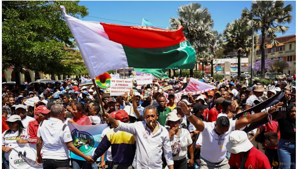
Masas sublevadas en Madagascar

Es así que con acciones de masas en las calles, incluyendo las huelgas generales y jornadas de lucha de septiembre, la influencia del imperialismo