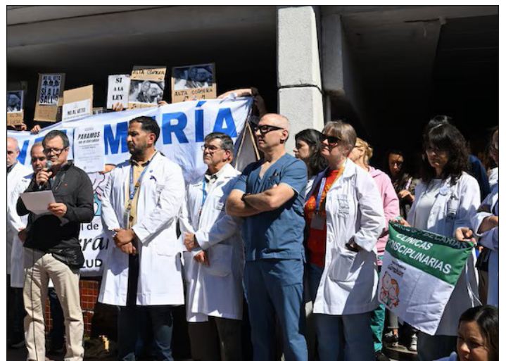
Los trabajadores del hospital Garrahan con su lucha despertaron la simpatía del conjunto de la clase obrera

Es por eso que los trabajadores del Garrahan en defensa del logro conquistado y para enfrentar la guerra que nos declararon, debemos pelear por reagrupar las fuerzas de todo el movimiento obrero.