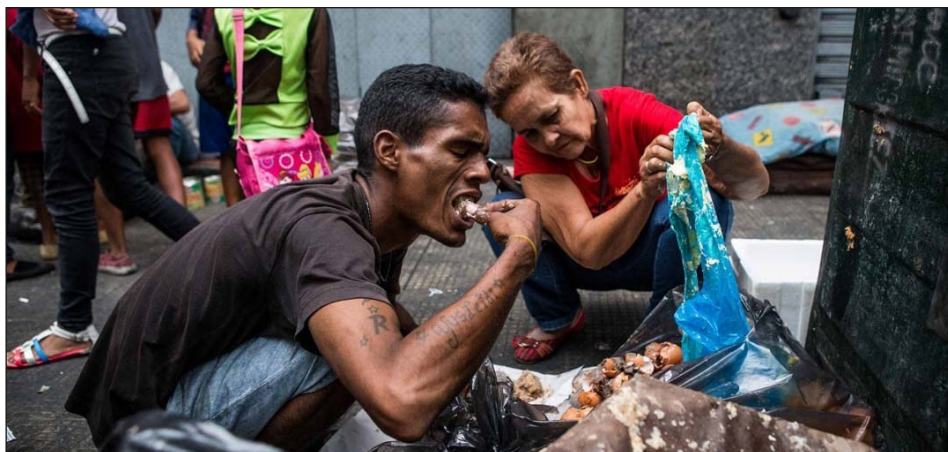
Explotados comiendo de la basura en Venezuela

El combate por derrotar al imperialismo debe pasar a manos de la clase obrera con un programa de unidad de acción militar para defender a la nación oprimida, pero de independencia política, que plantee como primera medida inmediata contra el cerco y a la amenaza militar de los yanquis, la ex-