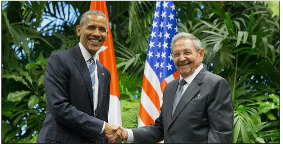
El carnicero Obama y Raúl Castro en Cuba (2015)

Lo de Obama fue un verdadero engaño y una mentira para sacar a las masas de las calles, donde un poderoso Movimiento