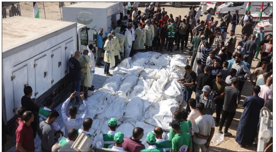
Las masas palestinas de Gaza entierran a sus mártires

Yendo por Cisjordania se puede confluir con la resistencia que sigue de pie allí