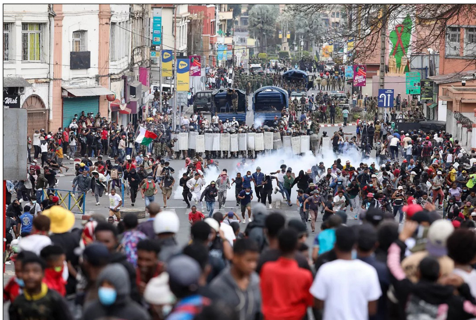
Choques con la policía en la capital Antananarivo

Hace 10 días manifestaciones y protestas se extendieron en todo Estados Unidos, en barriadas negras y obreras como las de Harlem o el Bronx, arrastraron a millones a las calles contra el gobierno bonapartista y genocida de Trump, en defensa de las