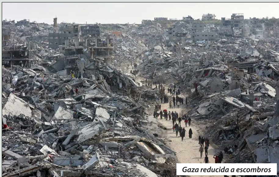
Gaza reducida a escombros

la OLP, saludó la resolución y declaró que estaba dispuesta “a asumir plenamente sus responsabilidades en Gaza”. No se podía esperar otra cosa de estos colaboracionistas, que vienen de encarcelar y tirar por la espalda a todo palestino que intentó luchar contra la ocupación junto a sus hermanos de Gaza. La OLP actuó como un verdadero brazo del sionismo al interior de Cisjordania. ¡Canallas!