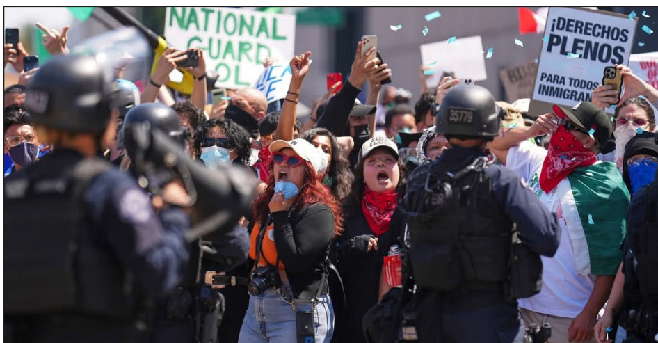
Manifestación en apoyo a los obreros migrantes en Los Ángeles

Por esto, millones no votaron al Partido Demócrata en las últimas elecciones presidenciales y el que ganó fue Trump, votado inclusive por amplios sectores de la clase obrera blanca, a los que los “demócratas” Obama y Biden atacaron abiertamente para salvar a la banca imperialista, arrancándoles todas sus conquistas.