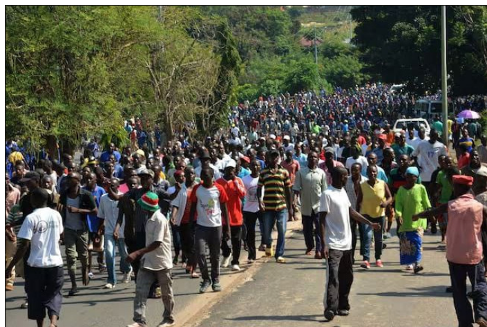
Miles de explotados ganan las calles de Tanzania

Las potencias imperialistas intentan volver a repartirse el mundo, con los yanquis a la ofensiva buscando recuperar su hegemonía. Los choques de clase son inevitables. El genocidio en Palestina, una guerra ya de desgaste en Ucrania que ha quedado ocupada por Moscú y colonizada por EEUU, con centenares de miles de muertos, y el imperialismo presto a atacar en Venezuela,