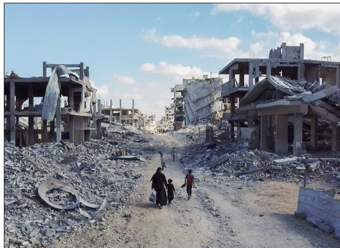
Gaza devastada por el genocidio del sionismo y los yanquis

Palestina se ha transformado en una guerra de todo Medio Oriente para imponer el "Gran Israel". La de Ucrania amenaza con convertirse en una gran guerra europea, inclusive de choques militares de mayor envergadura en el oriente de ese continente. La de Venezuela, busca abrir la primera guerra latinoamericana del imperialismo luego de Malvinas, más allá de otras ocupaciones y acciones contrarrevolucionarias. Son los yanquis que no están dispuestos a entregar a ninguna po-