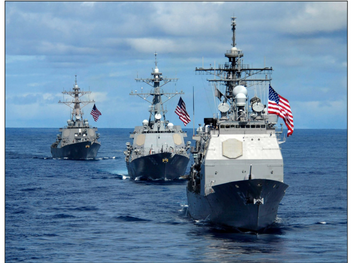
Despliegue de la flota de la marina yanqui en el Mar Caribe

A no dudarlo, que la “boliburguesía” está y estará dispuesta,