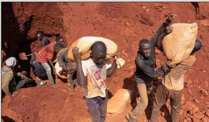
Los mineros extraen el coltán en República Democrática del Congo en condiciones de esclavitud

Es que lo sucedido en Kalando refleja la realidad de millones de explotados, que son el sostén fundamental de sus familias, y que cuando luchan por tomar las riquezas que les pertenecen, los mismos gobiernos sirvientes de las transnacionales despliegan su aparato represivo para garantizar la expoliación de la nación colonizada, incluso a costa de la vida de los obreros que estos mismos explotan.