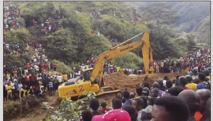
Excavaciones luego de la masacre y del derrumbe de la mina Kalando

Este fue el caso de los mineros de Marikana, que en 2012 protagonizaron una heroica huelga en la se que luchó por salario digno y mejores condiciones de trabajo. En ese momento, el gobierno asesino del CNA con su policía produjo una verdadera masacre para defender los intereses de la minera imperialista Lonmin.