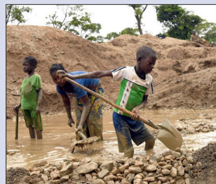
Niños esclavos en la República Democrática del Congo

La clase obrera negra debe ser símbolo y bandera de la clase obrera mundial. En el corazón de la bestia imperialista norteamericana y europea, desde las barriadas negras y migrantes, se pone de pie la vanguardia obrera y la juventud, que además de tomar en sus manos la lucha del pueblo palestino y en defensa de sus hermanos inmigrantes, en ciudades como Nueva York, Londres o Atenas toman como propia la lucha de sus her-