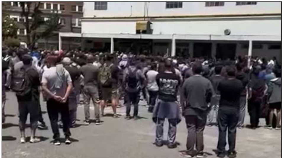
Asamblea en el Astillero

Los "autoconvocados" tienen toda la autoridad para llamar a una asamblea general, que VOTE DELEGADOS Y UN COMITÉ DE LUCHA DEL ARS!