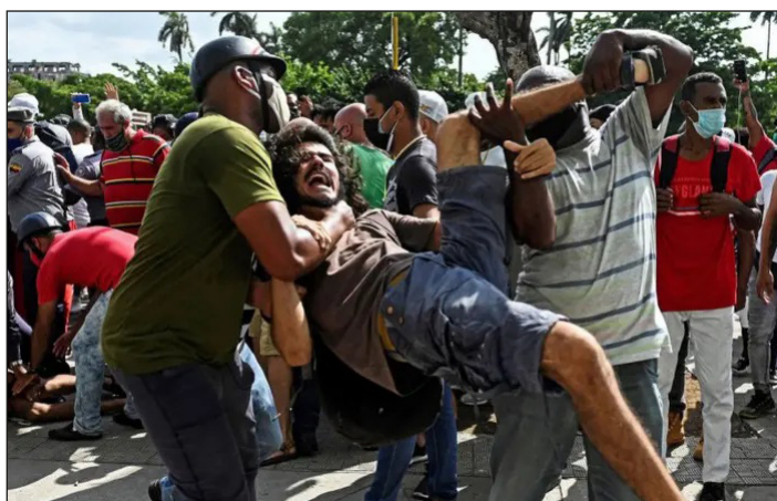
Cuba: brutal represión al levantamiento por el pan de los obreros hambrientos el 11 de julio de 2021

Boric ha garantizado en Chile mantener el modelo de saqueo que quieren imponer los yanquis en todo el subcontinente. Esta vez esto lo hizo el gobierno de la lacra stalinista, los “pa-