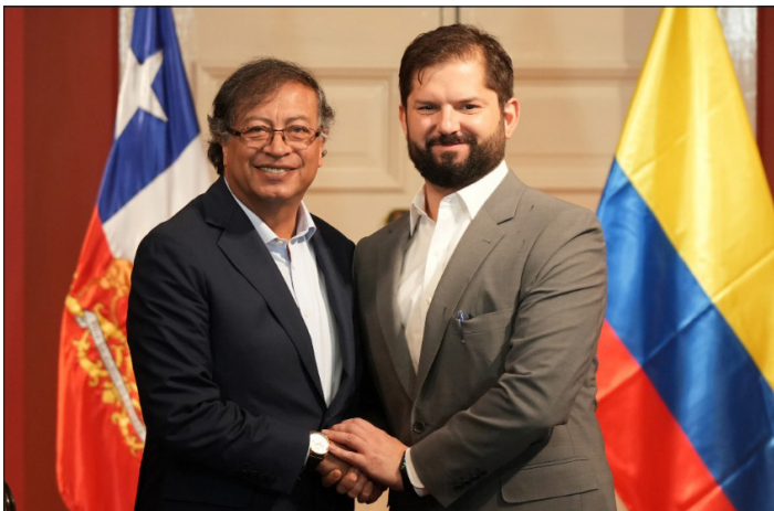
Petro de Colombia con Boric de Chile

Pero otra cosa muy distinta es aplicar en la vida misma los planes de hambre, de maquilización de la clase obrera, de entrega nacional, de miseria y pauperización de las grandes masas y la expropiación de todos los recursos de estas naciones oprimidas. Esto no se va a definir en ningún proceso electoral,