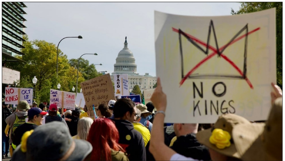
Movilización en Washington DC contra Trump: "No queremos reyes" (No Kings)

El “socialista” Mamdani, encubierto por toda la izquierda social-imperialista del mundo, que lo embellece como si fuera un “revolucionario”, no ha tenido ni tiene nada que ver en sus propuestas electorales ni en la acción en las calles, con ninguno de estos procesos de lucha de las masas de EEUU. Él viene a sacar a los explotados de las calles con 3 o 4 medidas mínimas y promesas