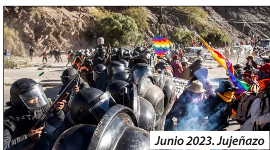
Junio 2023. Jujeñazo