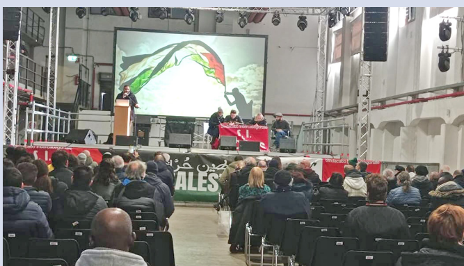
Asamblea del S.I. Cobas aprobando la declaración

Comité de Solidaridad Internacional de S.I. Cobas – Italia