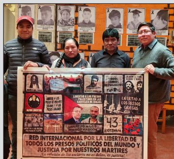
Corresponsal de la Red Internacional junto a familiares de la Asociación