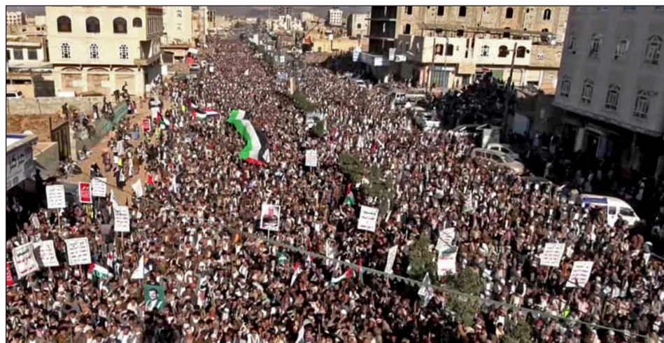
Enero 2024: Movilización de las masas yemeníes contra el genocidio en Gaza

¡Por un comité internacional de las organizaciones obreras para llevar adelante una huelga general internacional y una campaña de fondos para enviar ayuda, medicamentos, pertrechos y voluntarios para ir a combatir junto a las masas palestinas!