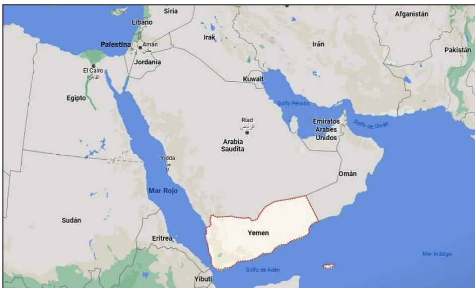
Mapa de la región

El imperialismo declaró una guerra total. Uno de los máximos dirigentes de Hamas, Salah Arouri, fue asesinado en Beirut, un hecho que condenamos y llamamos a vengar . ¿Cómo es que Hezbollah no ha abierto todavía el frente de Líbano con todo su arsenal? ¿Cómo puede Irán mantenerse todavía al margen, cuando los yanquis ya bombardean directamente Yemen? ¿Cómo puede ser que la OLP se