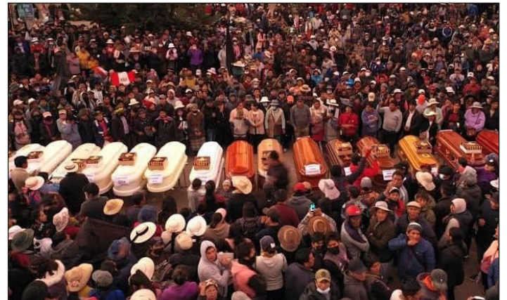
Masacre en Juliaca

El gobierno de la asesina Boluarte y sus secuaces golpistas quisieron escarmentar a sangre y fuego la heroica sublevación de masas que enfrentaban los planes del imperialismo. Fueron los piratas yanquis, a través de la jefa del Comando Sur del Pentágono, Laura Richardson, los que comandaron el golpe sangriento para quedarse de forma directa con las riquezas del litio y renovar los contratos ley de la minería para redoblar el saqueo de Perú sobre la base del hambre, la esclavitud y la sangre de la clase obrera y el pueblo pobre.