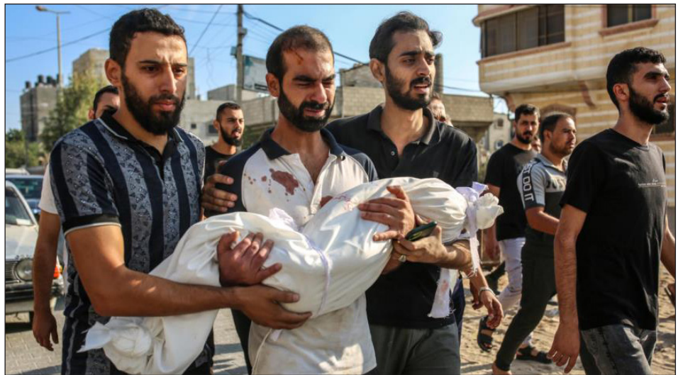
Masacre del sionismo en Gaza

Para pelear por esta perspectiva, debemos poner en pie un Comité de Huelga Internacional de apoyo a Palestina, de los sindicatos y organizaciones obreras , que lleve adelante una campaña de un jornal por obrero para recaudar fondos, y que desde allí se lleve un convoy con estos fondos y medicamentos, pertrechos, armas y voluntarios para romper el cerco a Gaza y luchar con la resistencia por la derrota del estado sio-