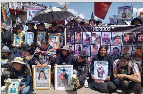
Familiares de los mártires y compañeros heridos en la masacre de Juliaca

Vea los reportajes a los compañeros de la Asociación de Juliaca en el sitio de la "Red Internacional por la libertad de los presos políticos del mundo y justicia por nuestros mártires"