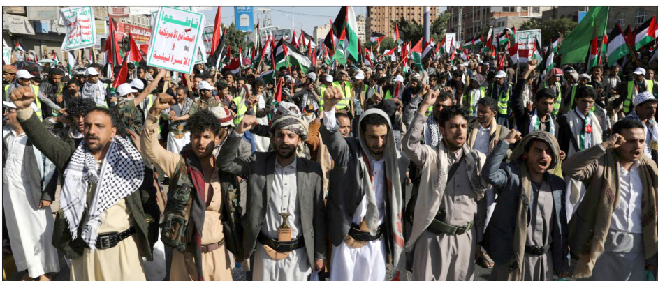
Diciembre 2023, marcha en Yemen en apoyo a Palestina

Por ello, desde el Organizador Obrero Internacional hacemos nuestro e impulsamos el programa de los sindicatos palestinos y el llamado del sindicato italiano S.I. Cobas a una huelga general internacional , que son un punto de partida para