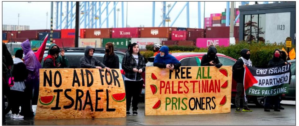
Trabajadores bloquean puerto de Tacoma (EEUU)

la de todos los explotados de Medio Oriente, para liberarnos del yugo y el saqueo imperialista y sus regímenes lacayos. Las burguesías árabes cercan a las masas palestinas y cuidan las fronteras del sionismo. Así lo hace por ejemplo el rey de Jordania, Al Sisi en Egipto y Al