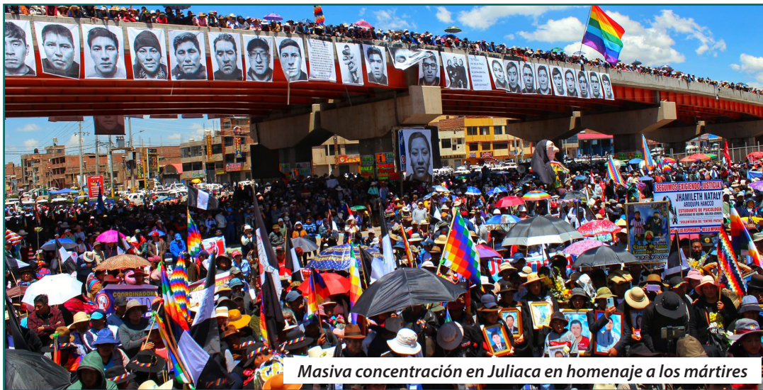
Masiva concentración en Juliaca en homenaje a los mártires

“¡La sangre derramada, jamás será olvidada!”