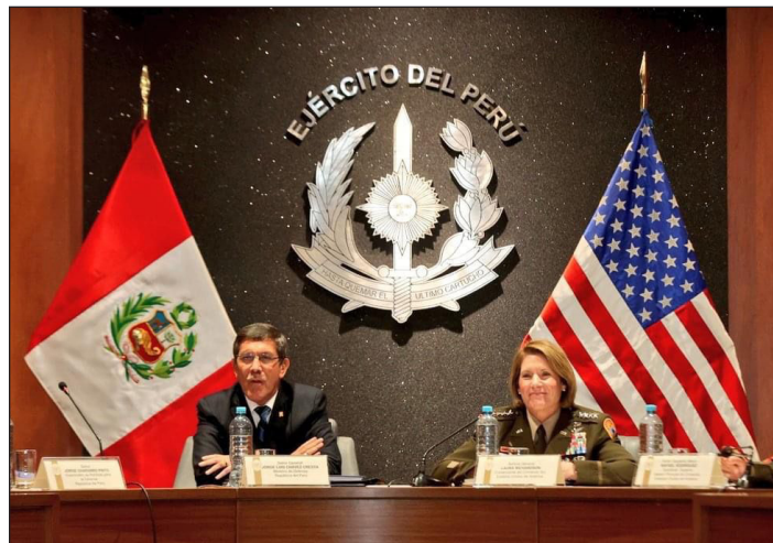
La generala Richardson y Jorge Chávez, ministro de defensa de Boluarte, en Lima

¡Por tribunales obreros y populares, encabezados por los familiares y heridos, para juzgar y castigar a todos los res-