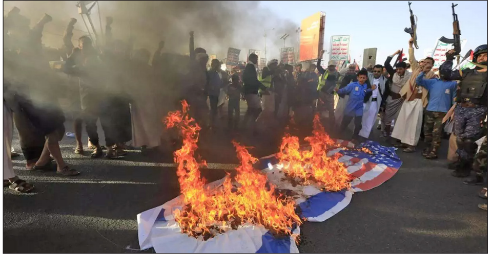
Manifestantes en Yemen queman banderas de EEUU y de Israel en protesta por los ataques contra los rebeldes hutíes

Desde el principio EEUU puso dos flotas a disposición del sionismo y le viene proveyendo armas y pertrechos para semejante masacre. Ahora, de esas flotas, salen vuelos de la muerte para bombardear en Yemen a los que se pusieron de pie para luchar junto a sus hermanos palestinos . Intentan parar a las masas yemeníes que desde noviembre impiden toda circulación del comercio imperialista en el Mar Rojo (una importante ruta comercial), causándole pérdidas multimillonarias, disparando así un poderoso misil contra el imperialismo y el sionismo luchando por ganar la guerra por Palestina. Yemen es un frente de la pelea por terminar con el holocausto palestino a manos de la ocupación sionista.