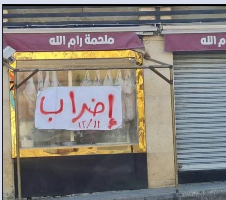
Las ciudades de Jenin (Cisjordania) y Aman (Jordania), totalmente paralizadas