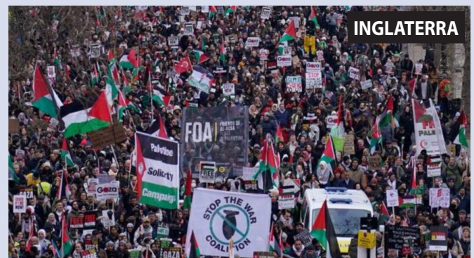
La clase obrera de los países imperialistas, como en Londres, gana las calles para paralizar la maquinaria de guerra sionista