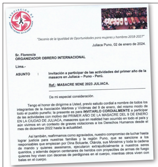
Facsimil de la invitación de la Asociación de Juliaca a “El Organizador Obrero Internacional” a la jornada a un año de la masacre

Corresponsal de “El Organizador Obrero Internacional” y del periódico “Tribuna Obrera Internacionalista” de Perú