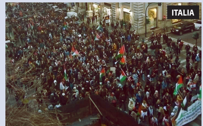
Roma: movilizaciones semanales por detener la masacre al pueblo palestino

Vea todas las acciones internacionales en