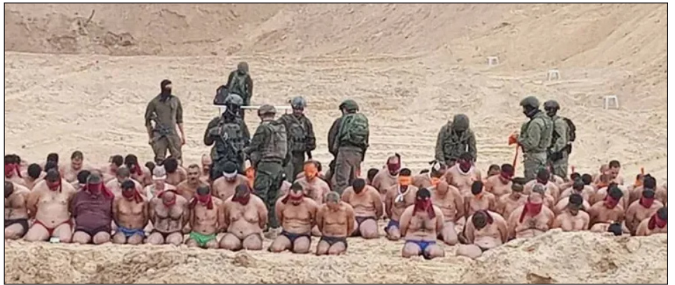
Palestinos tomados como rehenes por el ejército sionista fascista de Israel

A nivel internacional millones han ganado las calles en apoyo a las masas palestinas y por parar el genocidio. Se han parado barcos, puertos, aeropuertos y fábricas que armaban a Israel. Pero para parar la masacre y ganar la guerra contra el sionismo, se necesita subir otro escalón que ataque el corazón del imperialismo que lo financia y abastece.