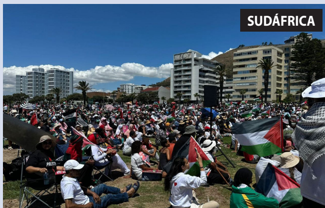
Manifestación en Ciudad del Cabo y en distintos puntos del país al grito de “¡Abajo el imperialismo norteamericano!”, “¡Palestina libre del río al mar!”