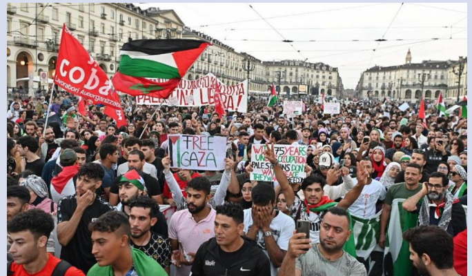
Marcha en Italia el 30/12/2023

La huelga se convocó para 4 horas, ampliables a 8, y fue seguida en cientos de almacenes; en muchos casos los trabajadores decidieron hacer huelga durante todo su turno. Las asambleas para preparar la huelga y los piquetes dieron la oportunidad de debatir con los trabajadores la cuestión de Palestina y el internacionalismo, contrastando la influen-