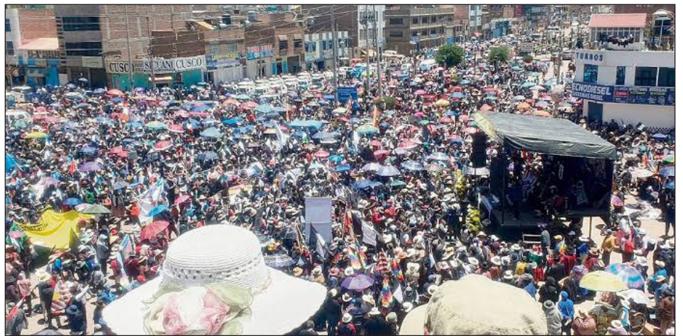
Masiva movilización en Juliaca a un año de la masacre