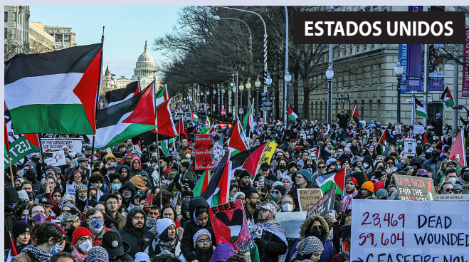
Movilización en Washington DC a la Casa Blanca denunciando al genocida Biden

En decenas de ciudades del mundo se realizaron acciones por las masas palestinas en Gaza y contra el genocidio sionista