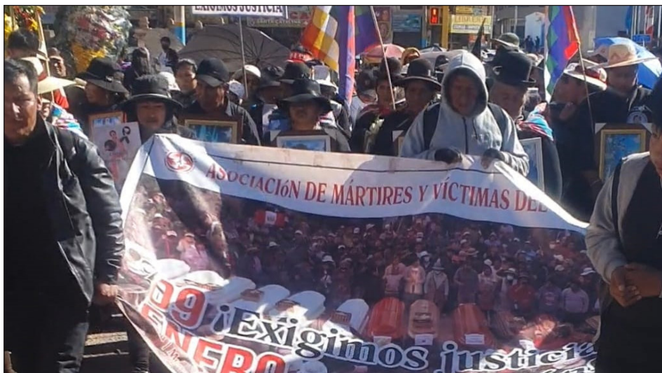
La “Asociación de Mártires y Víctimas del 9 de enero de Juliaca”

Por ello el día de hoy volvieron a la lucha, rodeando de solidaridad a los suyos, a los valientes compañeros de la “Asociación de Mártires y Víctimas del 9 de enero” que vienen encabezando la pelea por justicia por cada uno de los 80 compañeros asesinados en todo Perú por sublevarse