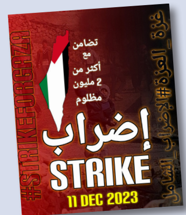
Flyer de la convocatoria a la huelga

El 11 de diciembre se llevó a cabo una huelga general contra el genocidio del sionismo en Gaza, en donde se paralizaron completamente ciudades de Jordania, incluyendo su capital Aman, el Líbano y también en Cisjordania, en ciudades como Jenin, Nablus y Ramallah.