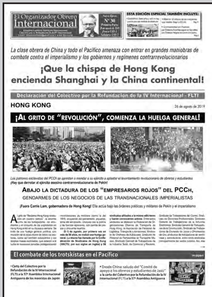
Facsímil de "El Organizador Obrero Internacional" N° 30, vocero de la FLTI, dedicado a los combates de los trabajadores y la juventud de Hong Kong

Para los camaradas, en Hong Kong hay una sublevación revolucionaria de masas contra la burguesía china y el imperialismo, encabezada