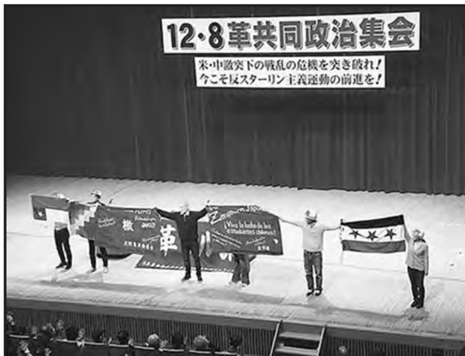
Intercambio de banderas entre la juventud Zengakuren y la FLTI

Como anunciamos en la presentación de esta Edición Especial de "El Organizador Obrero Internacional", una delegación del Colectivo por la Refundación de la IV Internacional / FLTI participó de la reunión política anual de los camaradas de la Liga Comunista Revolucionaria de Japón / Fracción Marxista Revolucionaria (JRCL-RMF). Invitados por la dirección de los marxistas del Pacífico, nos hicimos presentes entonces en esta reunión que fue realizada el pasado 8/12 en Tokio.