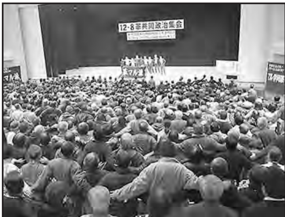
Cantando "La Internacional" en la reunión nacional en Tokio