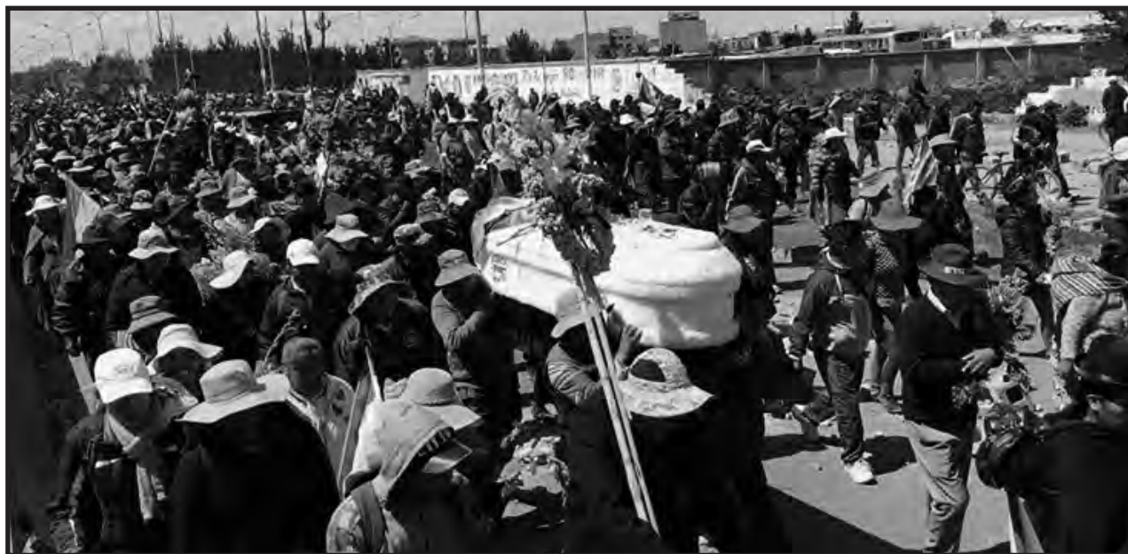
El Alto, Bolivia: movilización con los féretros de los mártires de Senkata

En nuestra despedida de Japón, centenares de jóvenes y obreros de vanguardia nos plantearon el llamado a que “¡Luchemos juntos!”... Ya lo estamos haciendo.