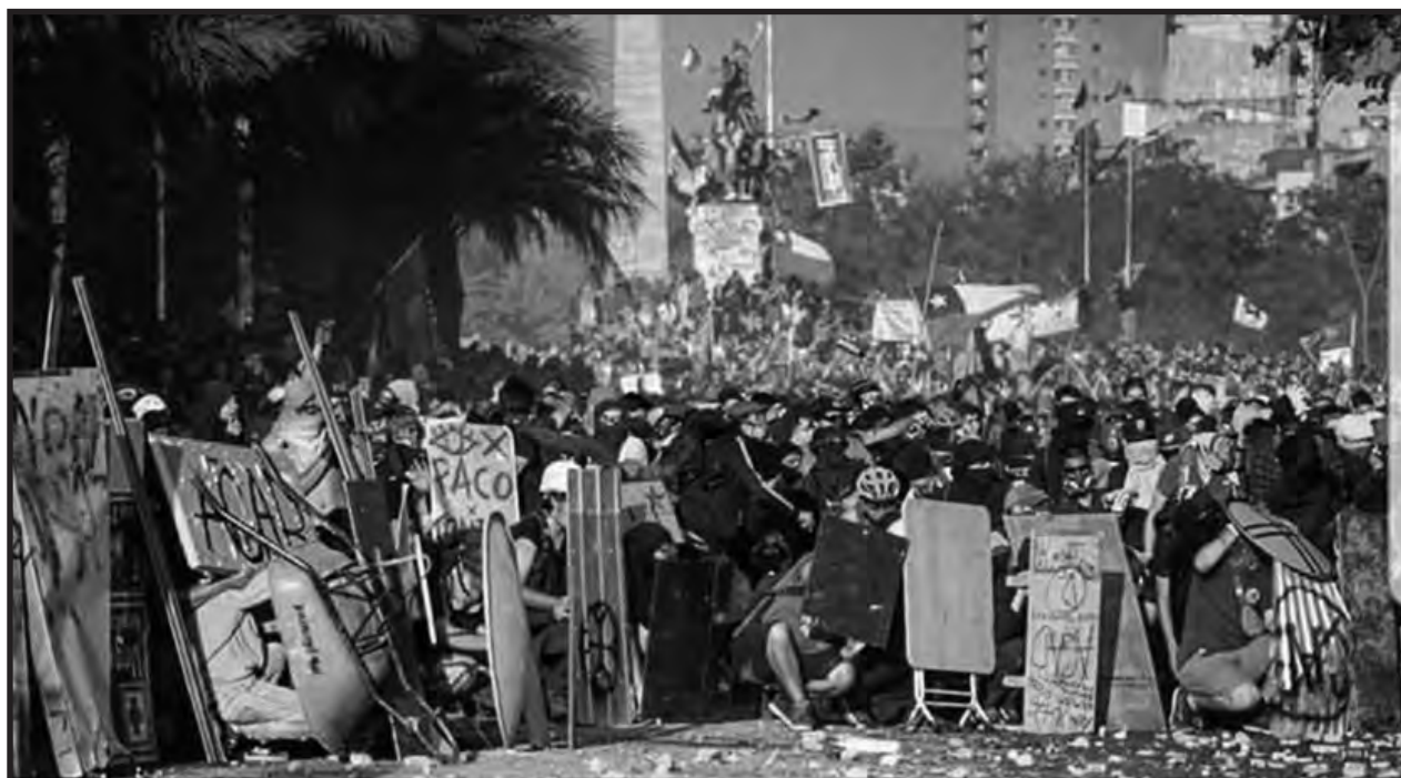
La "primera línea" de los combates revolucionarios de Chile

La lucha por una huelga general revolucionaria indefinida hasta que caiga Piñera y la organi-