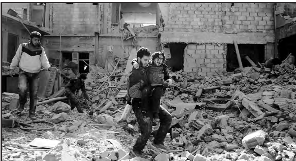
Siria: la ciudad de Ghouta devastada tras los bombardeos de Al Assad y Putin

Como decía Trotsky en el "Manifiesto de la IV Internacional sobre la guerra imperialista y la revolución proletaria mundial" de mayo de 1940, para los pequeños partidos de la IV Internacional, no se trataba tan solo de aprovechar la oportunidad de avanzar a las masas en tal o cual revolución, sino que se trata de conquistar una corriente revolucionaria internacional en todo un período histórico de crisis, guerras y revoluciones.