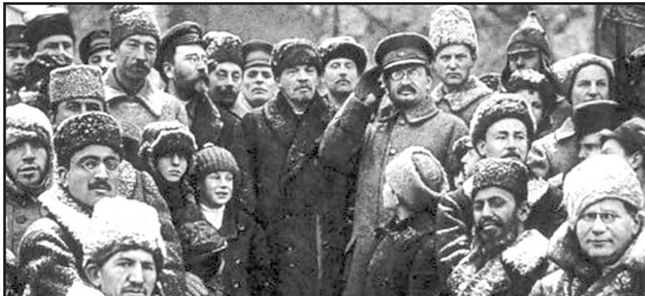
Lenin y Trotsky

Los marxistas revolucionarios lo volveremos a intentar y eso estamos haciendo. Es que la clase obrera no se merece la dirección que tiene a su frente. La tarea de saldar cuentas con las direcciones traidoras no es una tarea nacional. Nuestras discusiones y acción común internacionalista con la JRCL-RMF es un paso adelante en nuestra lucha por reagrupar a las alas izquierda del movimiento marxista internacional porque sabemos que en esa pelea, nuestro combate y la sangre que dejamos en Siria podrán transformarse en una fuerza real de vanguardia, de orgullosos obreros de una corriente proletaria revolucionaria en el Magreb y Medio Oriente. Sabemos que en ese combate podremos colaborar decisivamente con lo que ansía la clase obrera y la juventud revolucionaria de Chile, que es sacarse de encima a los “pacos de rojo” del PC que mil veces llevaron a