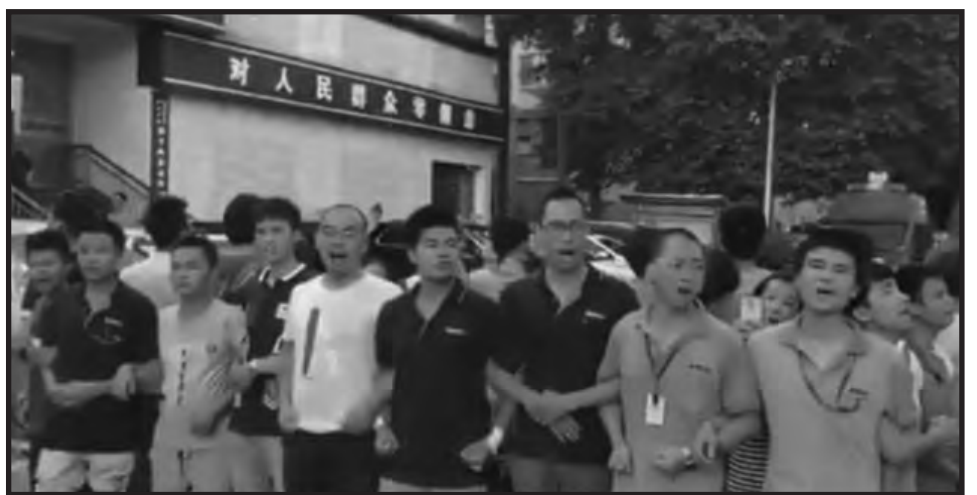
China: los obreros combaten por sindicatos independientes

Así fue que aclaramos nuestro punto de vista alrededor de la cuestión china, que está siendo debatida y será un punto de discusión con los camaradas de Japón, como es en todo el movimiento marxista internacional. Lo que sí está planteado como política