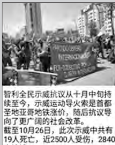
Imagen de la publicación en Telegram

Los camaradas de la Cuarta Internacional de Chile emitieron una declaración al respecto y salieron a las calles para unirse a las filas del equipo de protesta.