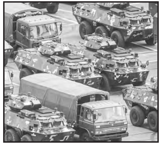
El gobierno contrarrevolucionario del PC chino despliega su ejército frente a Hong Kong

La FLTI ha hecho suya la consigna que levanta la JRCL-RMF de "¡Parar un segundo Tiananmen!" en Hong Kong y nos comprometimos a llevarla al conjunto del movimiento obrero mundial. Lo mismo alrededor de la rebelión de los uigures, que el ejército de los mandarines chinos ha atacado y aplastado en los sucesivos levantamientos de esa nacionalidad oprimida, mientras mantiene a más de dos millones en campos de concentración para hacerlos trabajar luego en las fábricas-cárceles. La lucha de los estudiantes de Hong Kong en defensa de los uigures, es parte de la solidaridad de las masas honkonesas con todos los explotados de la China continental.