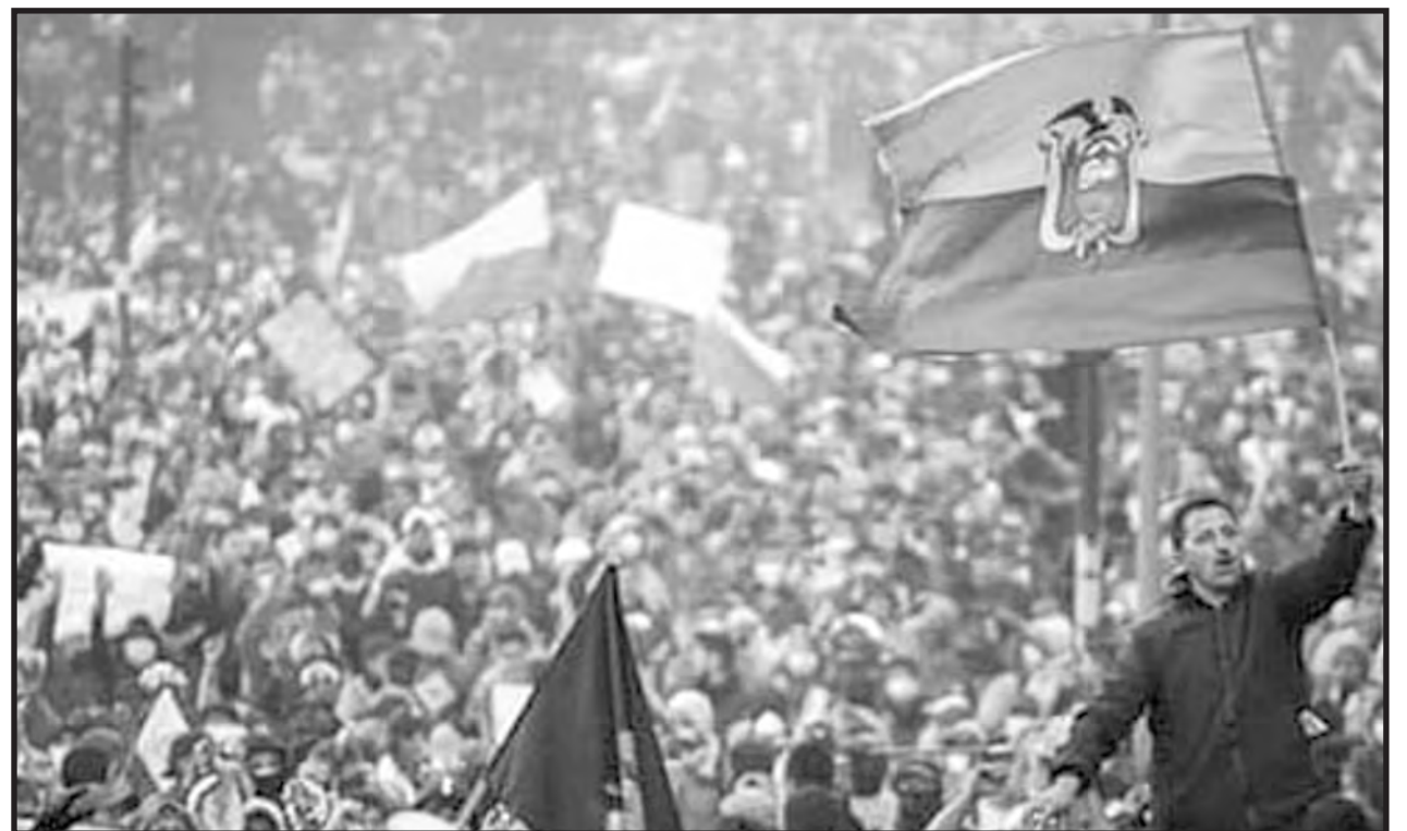
Combate revolucionario en Ecuador

Esta cuestión no es secundaria puesto que el inicio de toda situación revolucionaria o pre-revolucionaria le plantea a las masas que lo central que tienen por delante esos procesos, es la conquista de organismos de doble poder armados. Es que luego de que se desarrollan acciones independientes revolucionarias de masas, la tarea es preparar los organismos de poder de los explotados que le