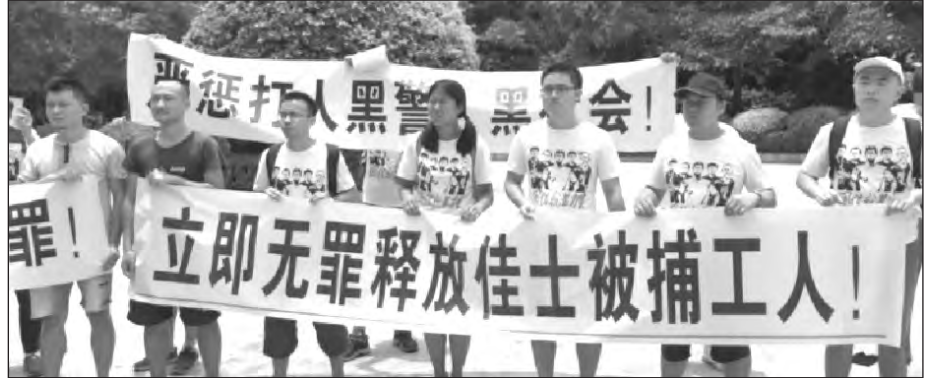
Agosto 2018: activistas en Shenzhen protestando en apoyo a los trabajadores de Jasic. En sus banderas piden el castigo a la policía corrupta y la liberación de los obreros detenidos