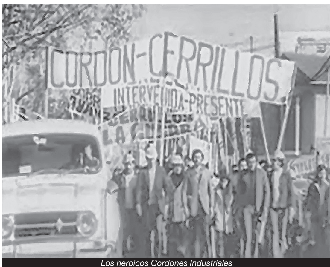
Los heroicos Cordones Industriales

¡Abajo la farsa de la “revolución bolivariana” de Morales que ataca a los mineros de Huanuni en Bolivia, de Maduro que hambrea a la clase obrera venezolana, de la Dilma que garantiza la súper-explotación de los trabajadores de Brasil al servicio del imperialismo, de la Kirchner que busca encarcelar a los petroleros de Las Heras por osar pelear contra las petroleras imperialistas! ¡Los “bolivarianos” son tan lacayos de Obama y tan antiobrereros como los gobiernos pro-imperialistas del TLC!