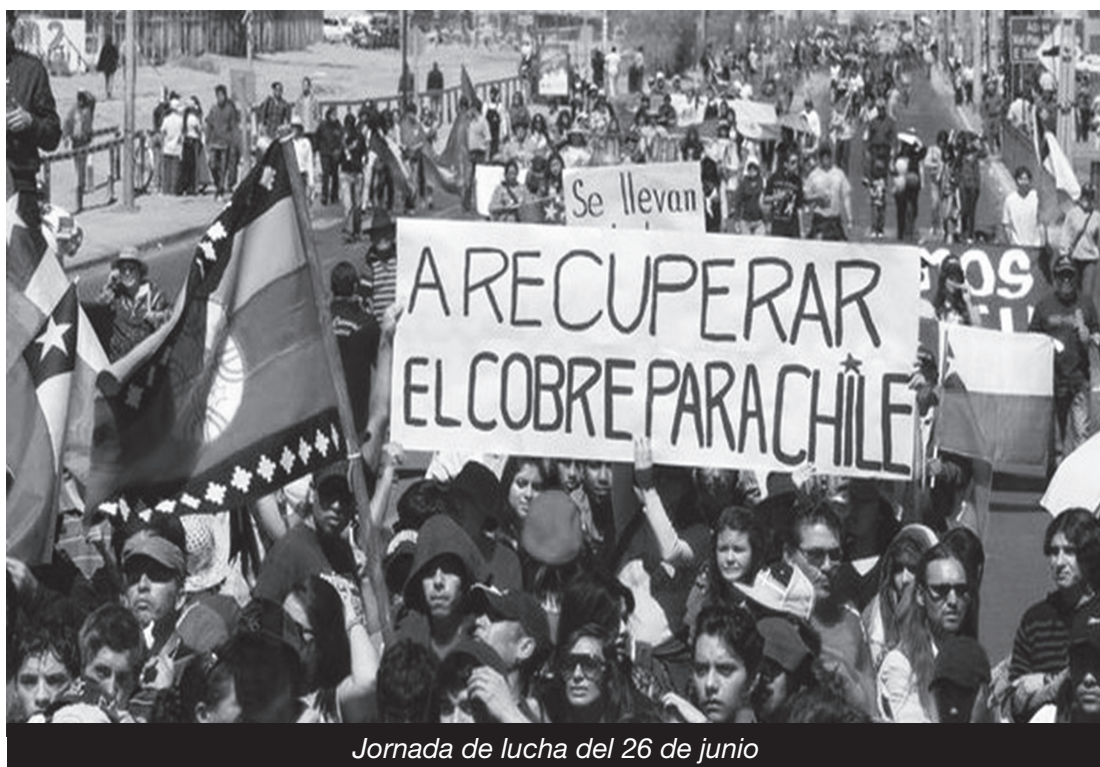
Jornada de lucha del 26 de junio

Los distintos sectores del proletariado están lejos de haber agotado sus energías de combate, pero está claro que el imperialismo y los patrones nativos fueron conquistando las mejores condiciones para continuar profundizando su ataque contra