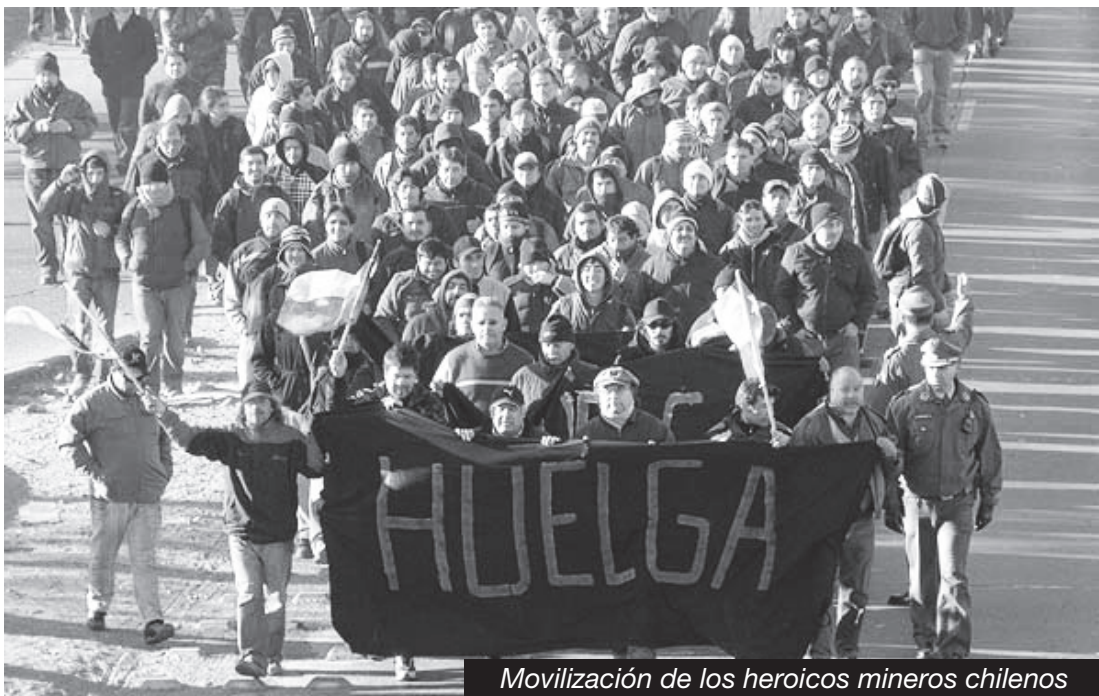
Movilización de los heroicos mineros chilenos