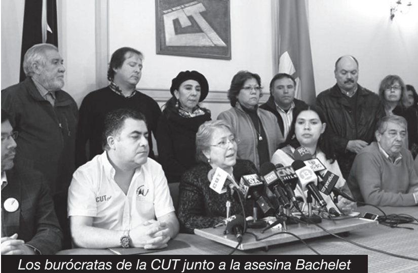
Los burócratas de la CUT junto a la asesina Bachelet

Ante el combate de la clase obrera y los explotados que volvieron a ganar las calles contra el gobierno de Piñera, el régimen cívico-militar y el imperialismo... Una vez más los dirigentes de la CUT junto a toda la burocracia sindical y estudiantil –sostenidos por todas las corrientes de la izquierda reformista– garantizaron la división de las filas obreras y mantener todas las luchas dispersas