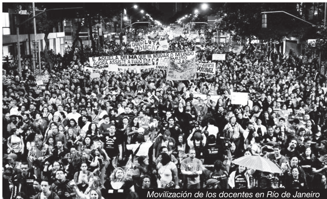
Movilización de los docentes en Río de Janeiro

La lucha de los petroleros contra la privatización y por el salario y el trabajo digno, la lucha de los obreros metalúrgicos contra el ataque de las transnacionales como la GM, Ford, Scania, MB, VW, etc., la lucha de los trabajadores de los Correos, de los Aeropuertos y de los Puertos contra la privatización y por el salario, la lucha de los profesores en defensa de la educación pública y mejores condiciones de trabajo, y también la lucha de los campesinos pobres por la tierra y contra los asesinatos en el campo, amenazan con conmovir al país. Todas estas luchas, como consecuencia de los enormes combates revolucionarios de junio, enfrentan directamente y desenmascaran el plan antiobrero del gobierno de Dilma-Temer (PT-PMDB), de entrega de la nación al imperialismo y enfrentan directamente el ataque de las transnacionales y de la patronal esclavista. Ellos quieren imponer privatizaciones, superexplotación