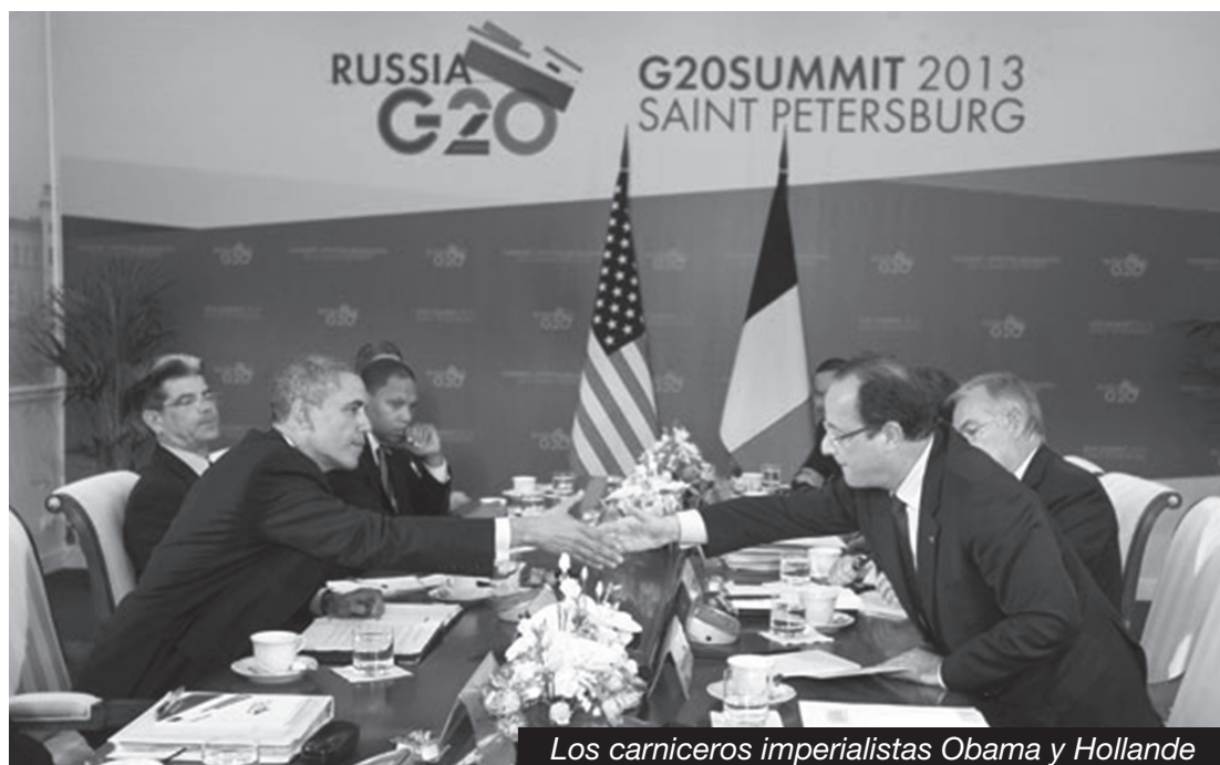
Los carniceros imperialistas Obama y Hollande

Pero aunque estos calumniadores de las masas revolucionarias sean ciegos, los revolucionarios sí distinguimos a la revolución y a nuestra clase en ella. Esta vive hoy en la resistencia que es hecha a pesar y en contra de generales burgueses, cuando las masas defienden sus casas y a sus familias, en Alepo, en Homs y en Damasco, donde las insurrecciones locales en las afueras de la ciudad se arman con los fusiles de los soldados que desertan del ejército de Al Assad. A esos “rebeldes” teme el imperialismo, más que a Al Assad. Justamente la Guardia Republicana iraní y Hezbollah fueron a ayudar a Al Assad a limpiar Damasco de decenas y decenas de revueltas obreras, tomas de fábricas, en la ciudad más industrial de Siria. Es que en la capital se define, como ayer en Libia, la suerte del poder y del gobierno.