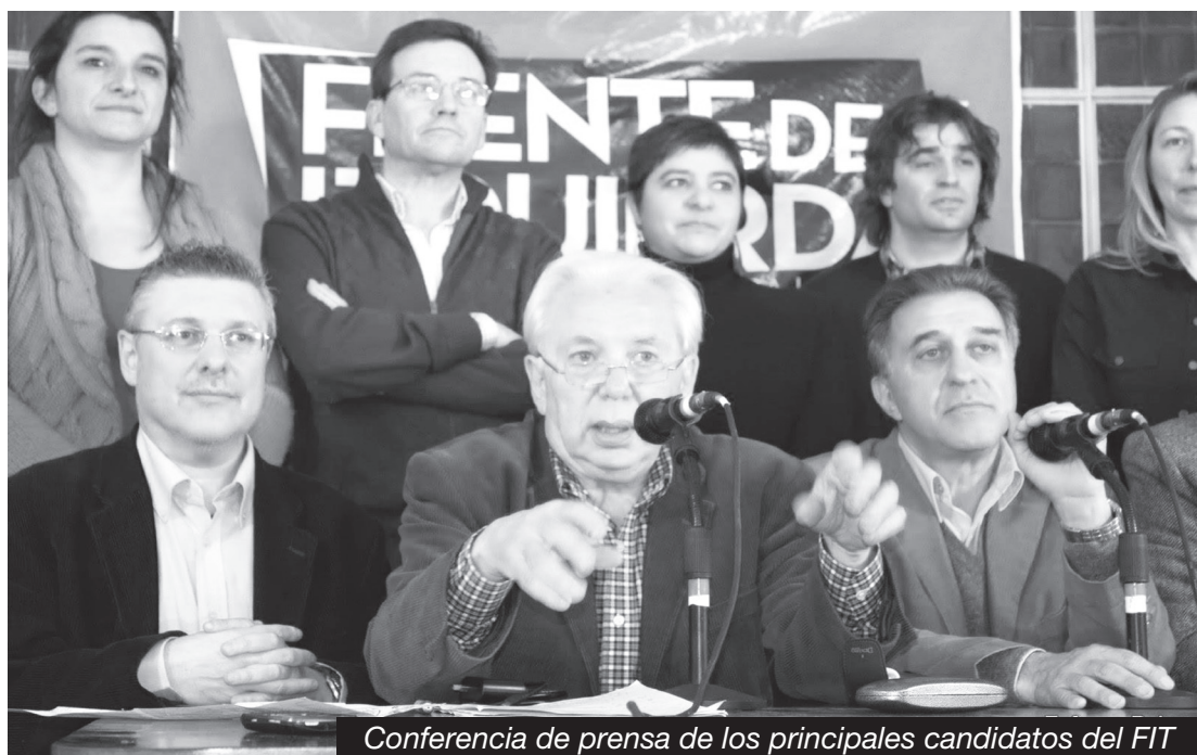
Conferencia de prensa de los principales candidatos del FIT

Un obrero enfrenta a la patronal en la huelga y en la asamblea, no en una urna. Allí, para preparar y educar a la clase obrera para que no caiga en esa trampa, debemos hacerla avanzar en su conciencia votando a candidatos obreros y socialistas. Pero plantearles que allí puede vencer es un engaño. La tarea no es más que preparar la destrucción de la máquina gubernamental de dominio de la burguesía y destruirla, inclusive la parlamentaria. Justamente para eso van los marxistas al parlamento, para facilitar su destrucción. Los marxistas revolucionarios, en toda