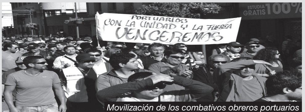
Movilización de los combativos obreros portuarios