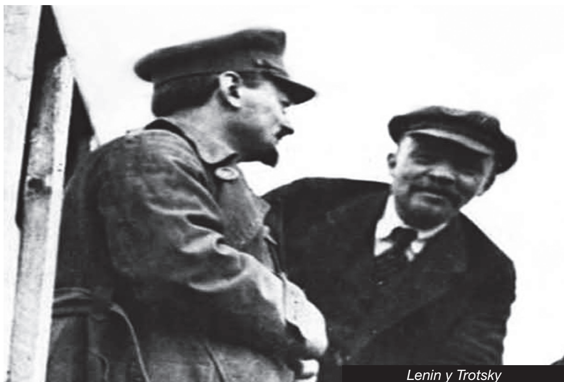
Lenin y Trotsky

El MAS, con no menos borrachera que la dirección del FIT, ha titulado "duro voto castigo a la burguesía" y lo mismo dice el MST... y el voto a Massa