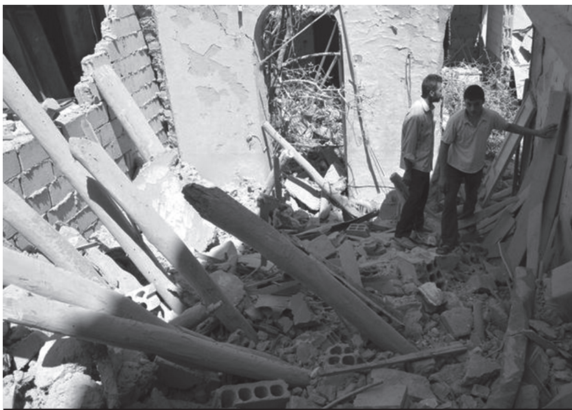
Aleppo devastada por la aviación de Al-Assad

¡Abajo el pacto de Obama, la ONU y Putin con el perro Al-Assad, para seguir masacrando a la revolución siria!