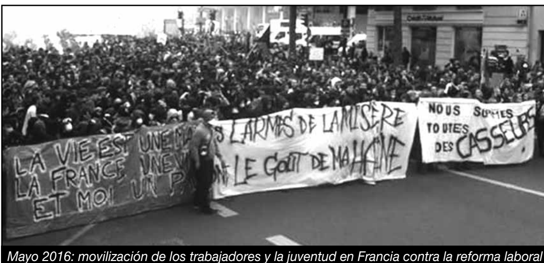
Mayo 2016: movilización de los trabajadores y la juventud en Francia contra la reforma laboral

Un sindicato de un país imperialista debe llamar a que el movimiento obrero de su país ataque la propiedad imperialista y lucha junto a sus hermanos de clase del mundo