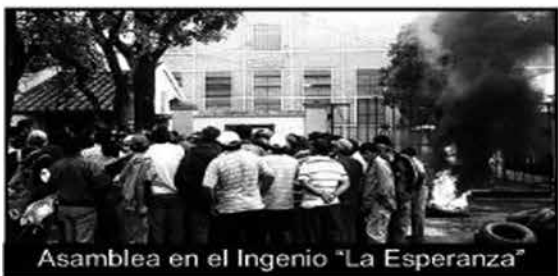
Asamblea en el Ingenio "La Esperanza"