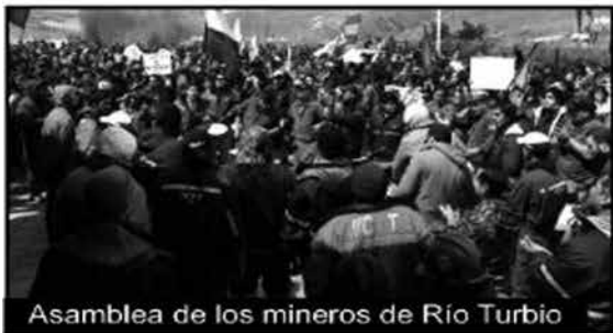
Asamblea de los mineros de Río Turbio