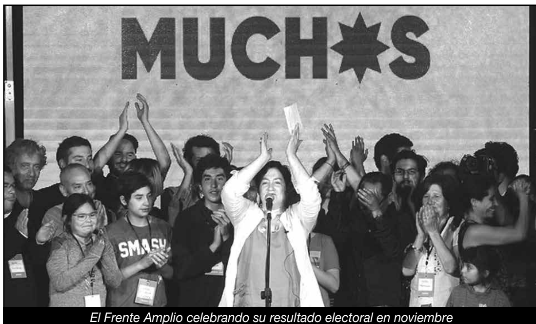
El Frente Amplio celebrando su resultado electoral en noviembre

¡Expropiación sin pago y bajo control obrero de las transnacionales y bancos!