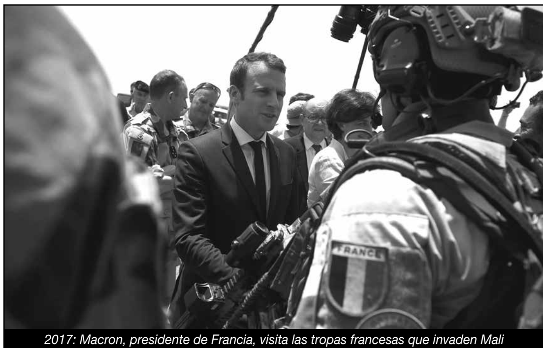
2017: Macron, presidente de Francia, visita las tropas francesas que invaden Mali

Mientras la burguesía y las transnacionales le quieren hacer vivir un infierno a los trabajadores con la quita de sus conquistas, el III Encuentro de la RSISL votó que