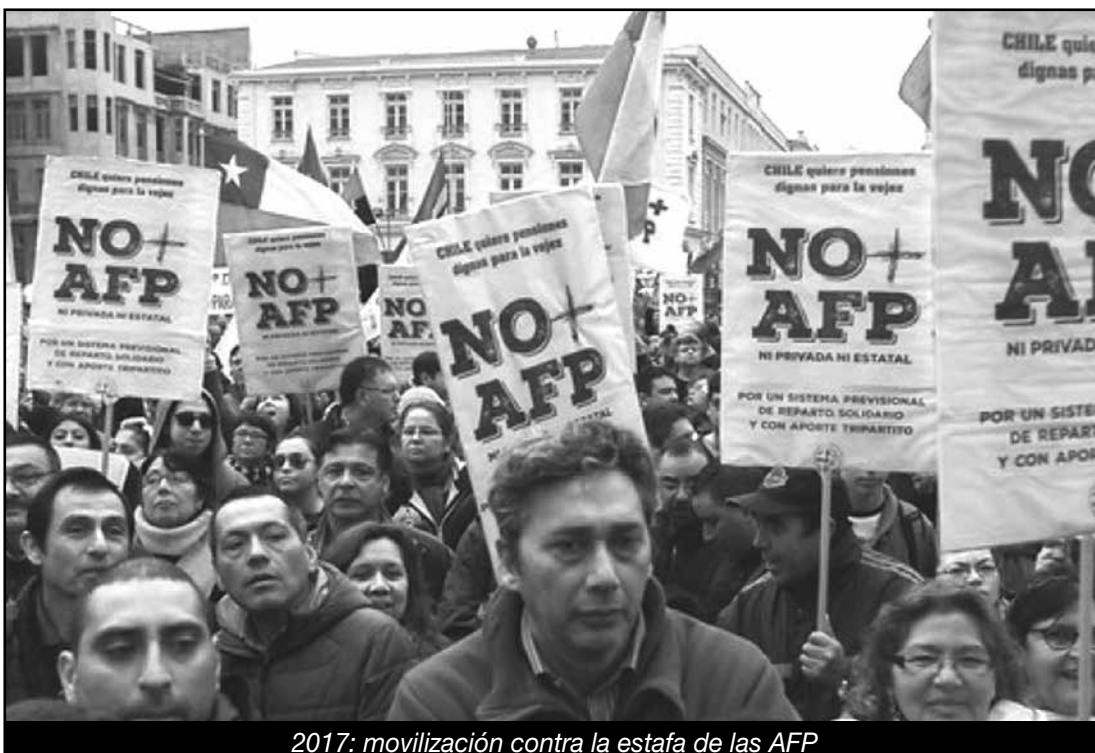
2017: movilización contra la estafa de las AFP

PARTIDO OBRERO INTERNACIONALISTA - CUARTA INTERNACIONAL (POI-CI), INTEGRANTE DE LA FLTI