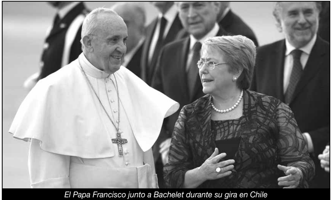
El Papa Francisco junto a Bachelet durante su gira en Chile

De esta forma, la burguesía pudo imponer su trampa electoral, intentando relegitimar con millones de votos su régimen odiado por las masas. Por eso festejaron de conjunto todos los partidos del régimen pinochetista su verdadero triunfo reaccionario contra los trabajadores y las masas oprimidas que fue el accionar de la burocracia de la CUT, el Frente Amplio y toda la izquierda colaboracionista conspirando para que no triunfe el combate revolucionario de los explotados.