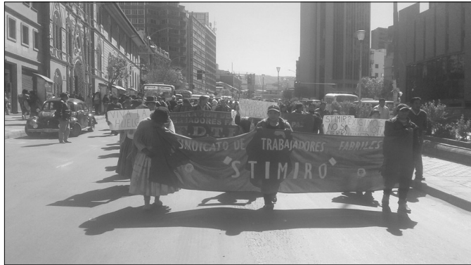
Marcha de los trabajadores de STIMIRO junto a delegados Federación Fabril