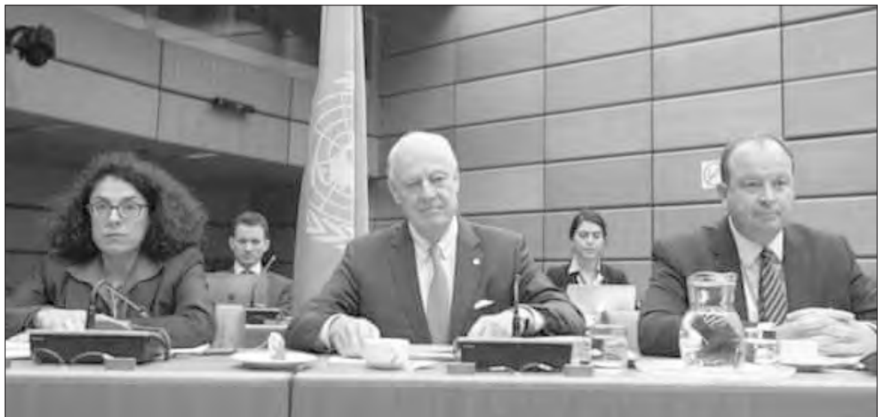
Conferencia de Ginebra

Todos los partidos de la izquierda reformista han seguido como sombra al cuerpo a esta política del PKK. Han planteado que “lo único progresivo en Siria son los kurdos” y llamaron a defender incondicionalmente Afrin, cuando ésta ha quedado ahora bajo control de Al Assad. Y al mismo tiempo, callan y silencian la verdadera masacre: a las masas de Ghouta e Idlib. Con la cuestión de Afrin han montado una cortina de humo para que terminen de caer las últimas trincheras de la revolución siria.