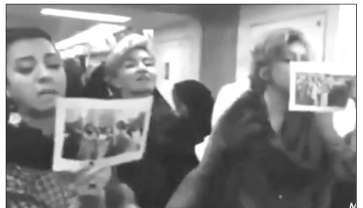
Irán: mujeres desafían a la autocracia quitándose el velo

Por eso el pasado 8 de marzo dijeron: “¡basta!” y marcharon por miles en los campos de refugiados en las fronteras. Así se suman a las mujeres que ya habían ganado las calles en Idlib y