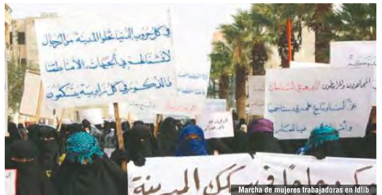
Marcha de mujeres trabajadoras en Idlib

¡Fuera las bases yanquis y los cuarteles de Al Assad de Rojava!