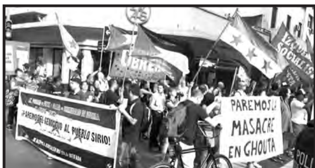
1 de marzo de 2018 Buenos Aires, Argentina

7 TH ANNIVERSARY OF THE SYRIAN REVOLUTION