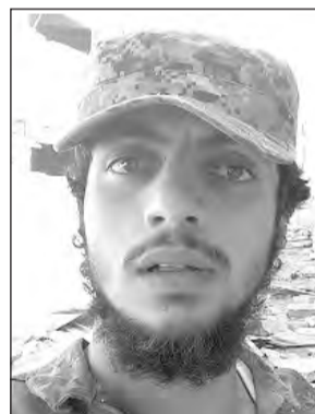
Abu Al Baraa

¡Honor a los mártires que dieron su sangre obrera y rebelde bajo la bandera del socialismo por el triunfo de la revolución!