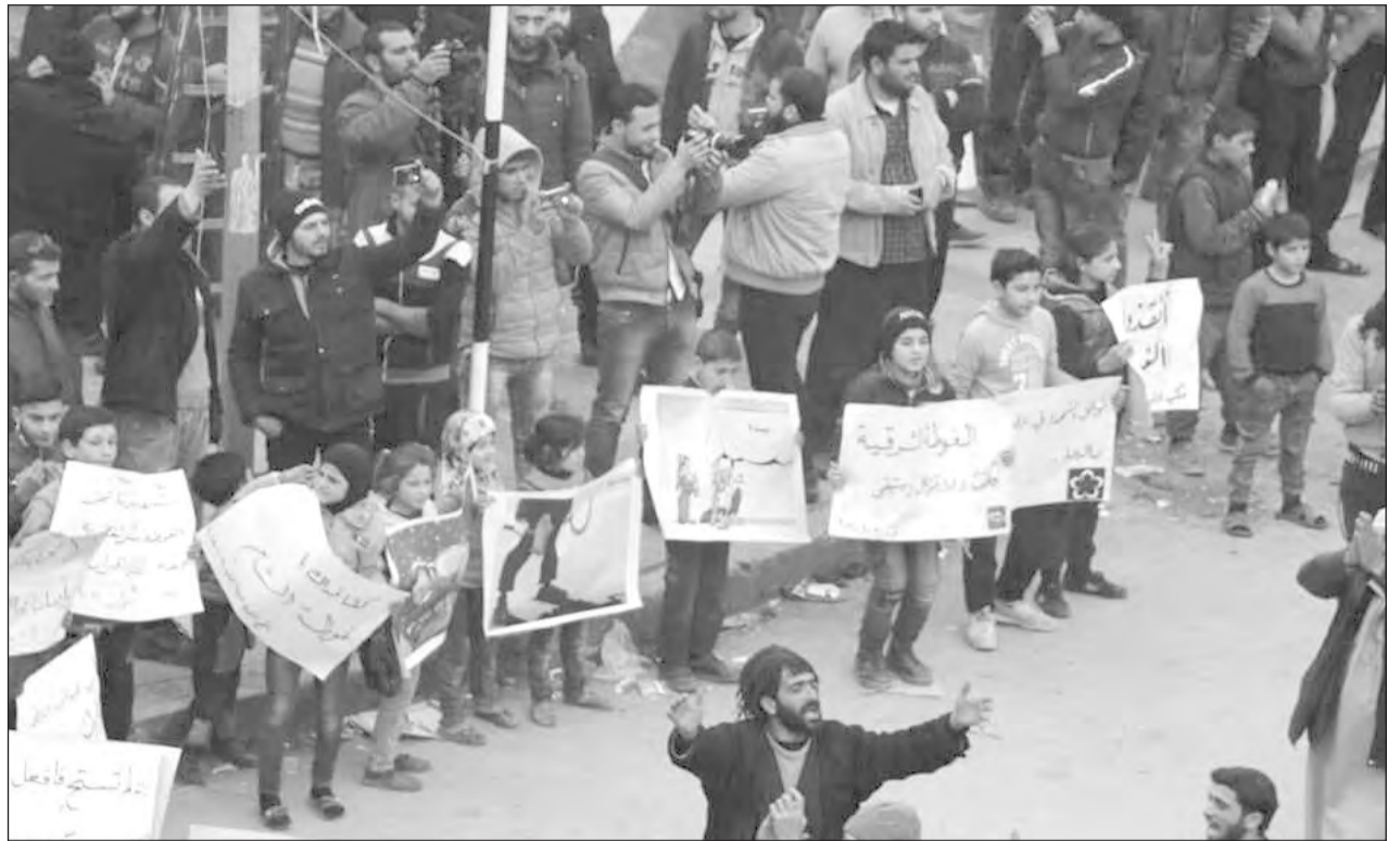
Marcha en Idlib al grito de “¡Que se abran los frentes!”

La izquierda reformista cercó la revolución siria separándola de los trabajadores del mundo. ¡Hay que romper este cerco y conquistar la unidad de las filas obreras a nivel internacional para luchar contra un mismo enemigo: el imperialismo y sus lacayos!