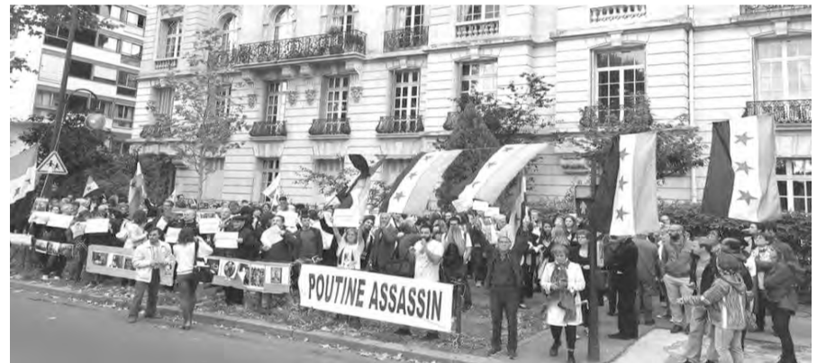
Manifestación en la embajada rusa en París en apoyo a las masas sirias (Octubre 2016)

El colectivo “Por una Siria Libre y Democrática” de Francia (PSLD) junto a decenas de organizaciones de solidaridad con el pueblo sirio, comités de refugiados e inmigrantes sirios en Europa, organizaciones obreras como la Unión Sindical Solitaires , la FSU (Federación Sindical Unitaria) y el SNESUP (Sindicato Nacional de la Enseñanza Superior) y partidos políticos como el Partido Socialista, el movimiento ENSEMBLE (Movimiento por una alternativa de Izquierda alternativa y solidaria), el EELV (Europa-Ecología – Los Verdes) y el movimiento GÉNÉRATION.S (Movimiento Generación), llaman a una marcha en apoyo al pueblo sirio en el 7º Aniversario de la revolución.