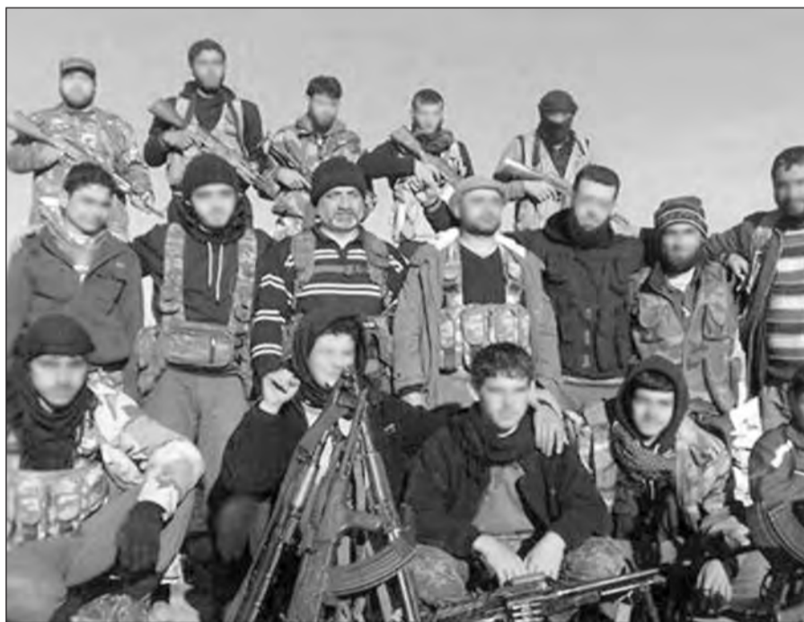
Brigada León Sedov

¡Honor a los socialistas sirios caídos en la avanzada del combate contra el perro Bashar y Putin, sirvientes del imperialismo!