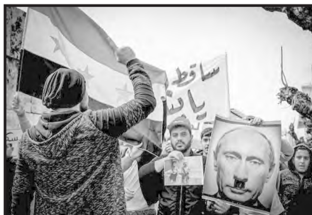
18 de febrero de 2018 Grecia, Atenas

VEA MÁS SOBRE LAS ACCIONES EN SOLIDARIDAD CON GHOUTA Y LA REVOLUCIÓN SIRIA EN: