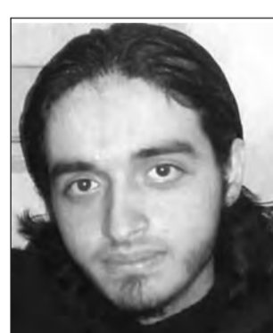
Abu Al Jud