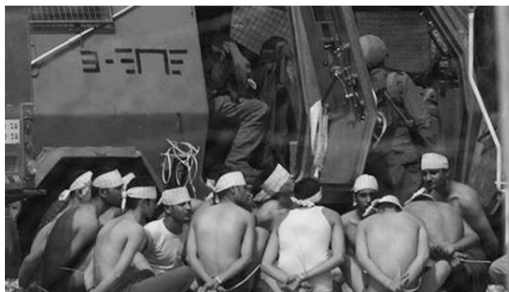
Prisioneiros palestinos detidos pela força de ocupação sionista

Mas os organizadores deste evento, entre os quais se encontrava parte da Frente de Esquerda que tirou 1.200.000 votos nas