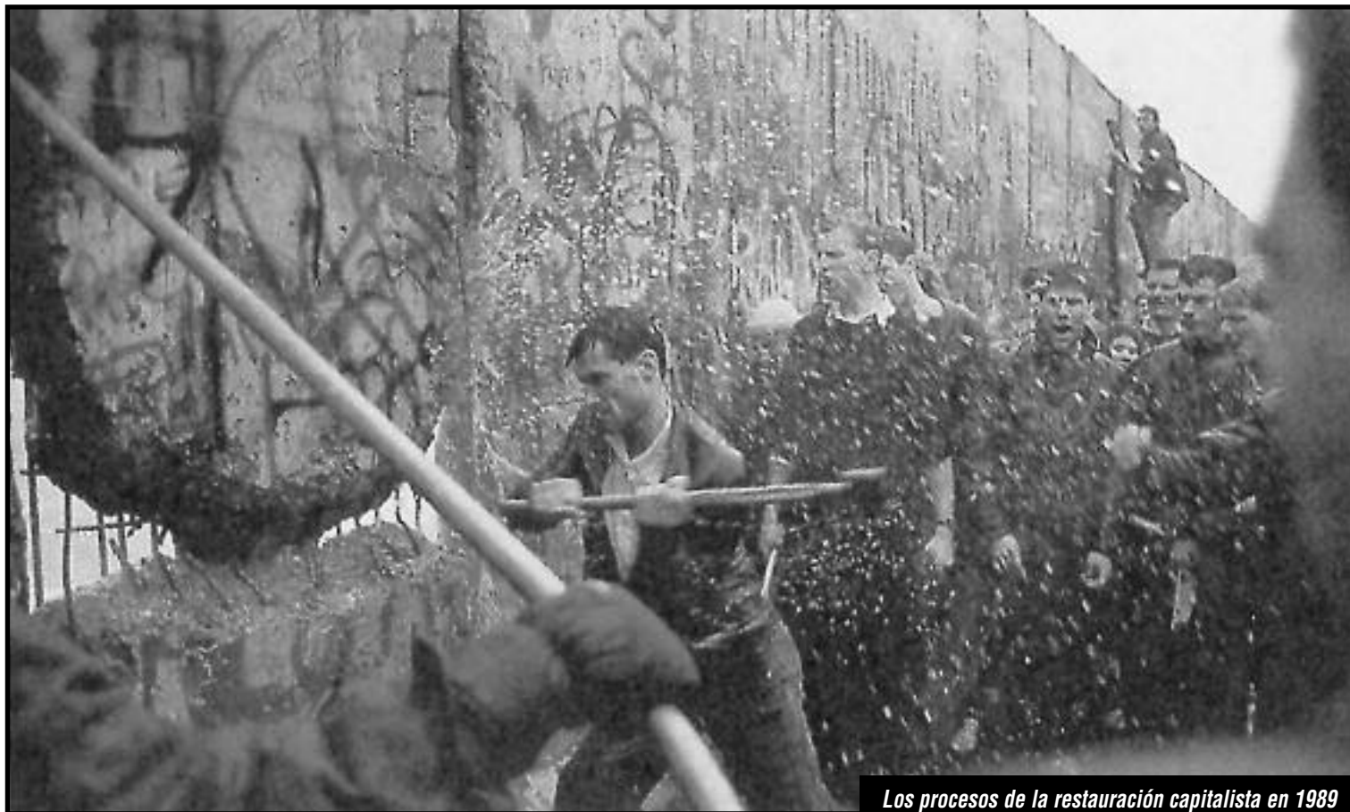
Los procesos de la restauración capitalista en 1989

En este caso ya no podían echarle la culpa a que “perduraba el régimen de la guerra” para justificar sus capitulaciones, porque que surgía el régimen del '89, de “fortaleza del capitalismo”, al que ahora