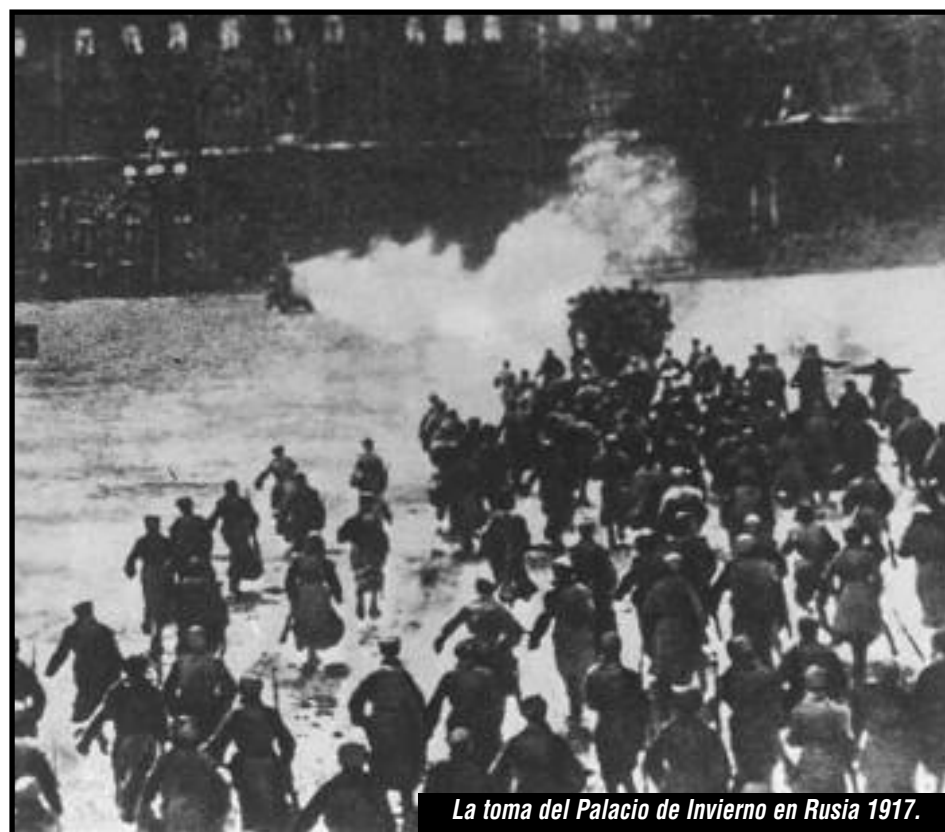
La toma del Palacio de Invierno en Rusia 1917.

síntesis del bolchevismo, la estrategia y el combate de la IV Internacional frente a la guerra!