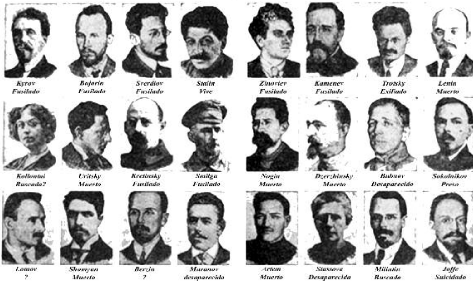
The Central Committee of The Bolshevik Party in 1917

Del Comité Central Bolchevique de 1917; para 1939 solo quedaban con vida Trotsky en exilio y Stalin, el resto fueron asesinados por el stalinismo