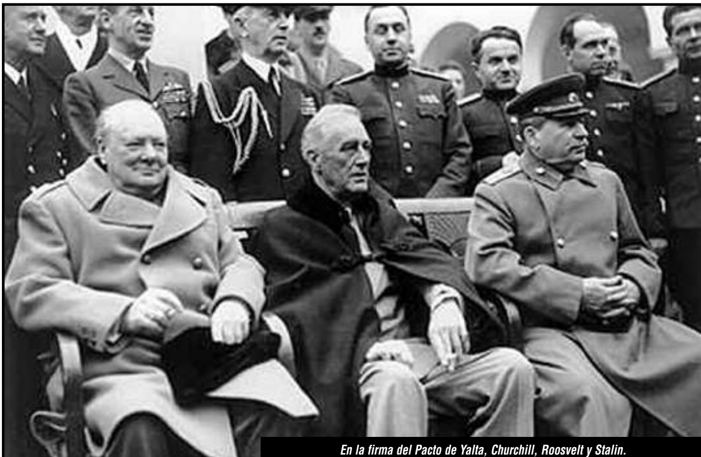
En la firma del Pacto de Yalta, Churchill, Roosevelt y Stalin.