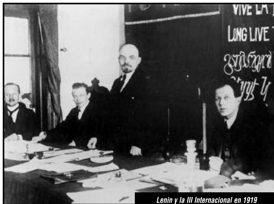
Lenin y la III Internacional en 1919

Por eso silencian que la obra más grande, y por la cual hoy ellos se ven obligados a tener que hablar en nombre del trotskismo para mejor destruirlo, es que se fundó la IV Internacional con un programa y una perspectiva de llevar al triunfo al proletariado internacional a fines de los años '30. Su programa y su legado fueron tan fuertes en la historia que aún hoy, luego de que fueran mil veces falsificados, revisados y bastardeados, el programa de la IV Internacional es el único desde donde