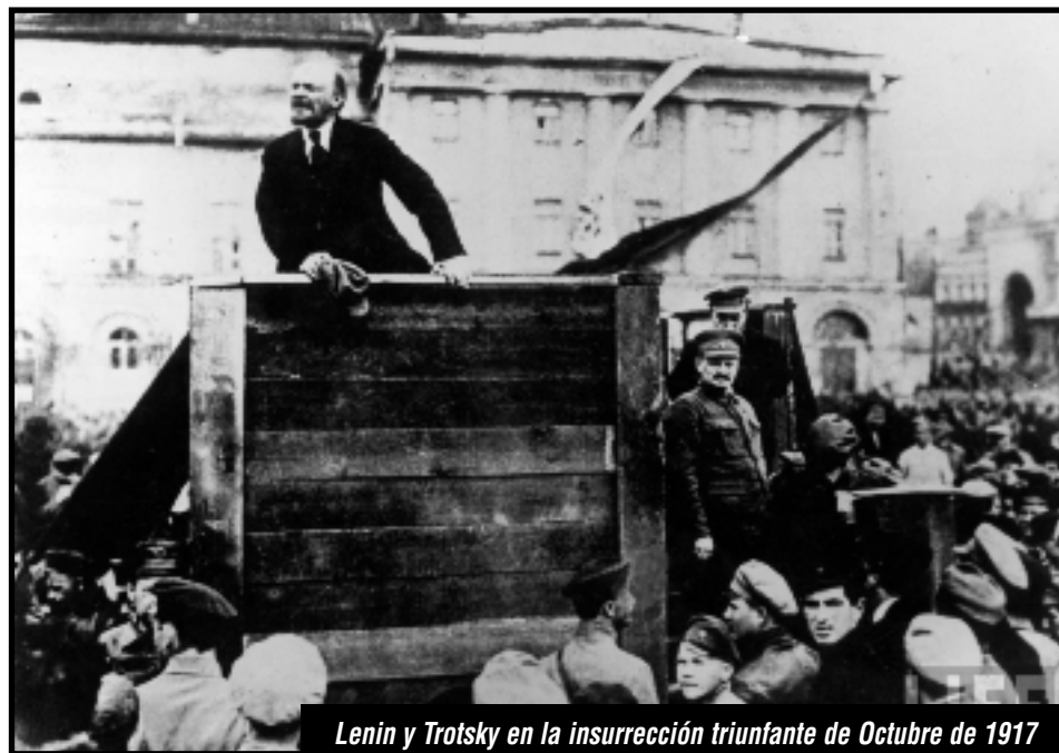
Lenin y Trotsky en la insurrección triunfante de Octubre de 1917

La Merkel, el Bundesbank y Wall Street ya aplauden a estos mariscales de derrotas de los partidos socialimperialistas europeos y sus podridas burocracias sindicales. Con la devaluación del euro, con el subsidio a sus propias transnacionales, con una altísima productividad del trabajo y sobre la base de la ruina y el endeudamiento del resto de las potencias imperialistas europeas, Alemania ha comenzado a crecer al 2,2% trimestral y sale a disputar el mundo. Las direcciones reformistas contuvieron al proletariado en la Europa imperialista arruinada, cercaron a la clase obrera revolucionaria griega y francesa para que sean los carniceros alemanes los que salgan victoriosos en el medio de la crisis. ¡¿Y ahora se atreven a rendir “homenaje” al camarada León Trotsky?!