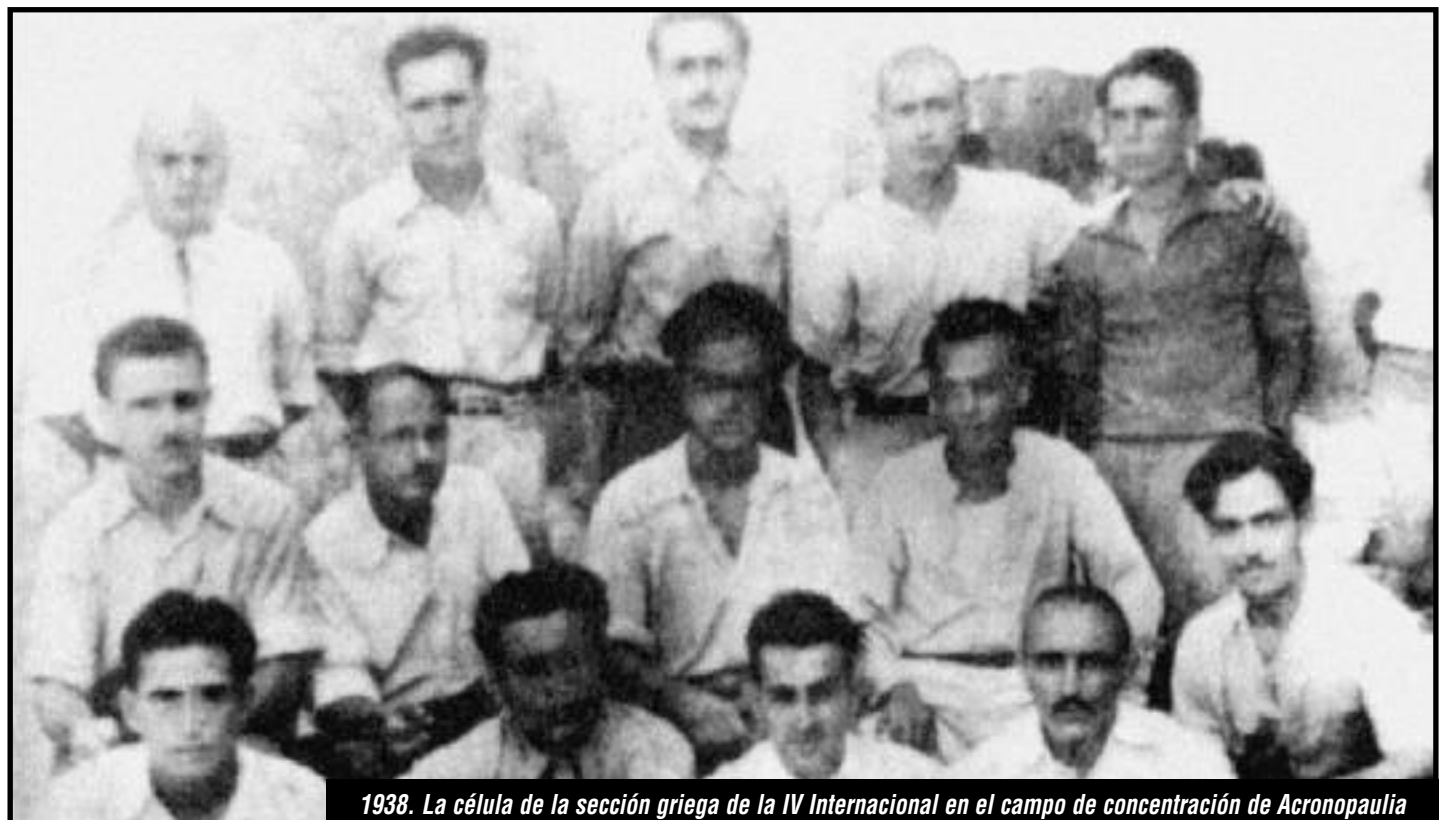
1938. La célula de la sección griega de la IV Internacional en el campo de concentración de Acronopaulia

Vamos a afirmar que duros golpes contra el trotskismo no sólo vinieron del stalinismo, sino del pérfido accionar del pablismo y el revisionismo, que desde las propias entrañas de la IV Internacional liquidaron su teoría, legado y programa, como sucediera con la II y III Internacional.