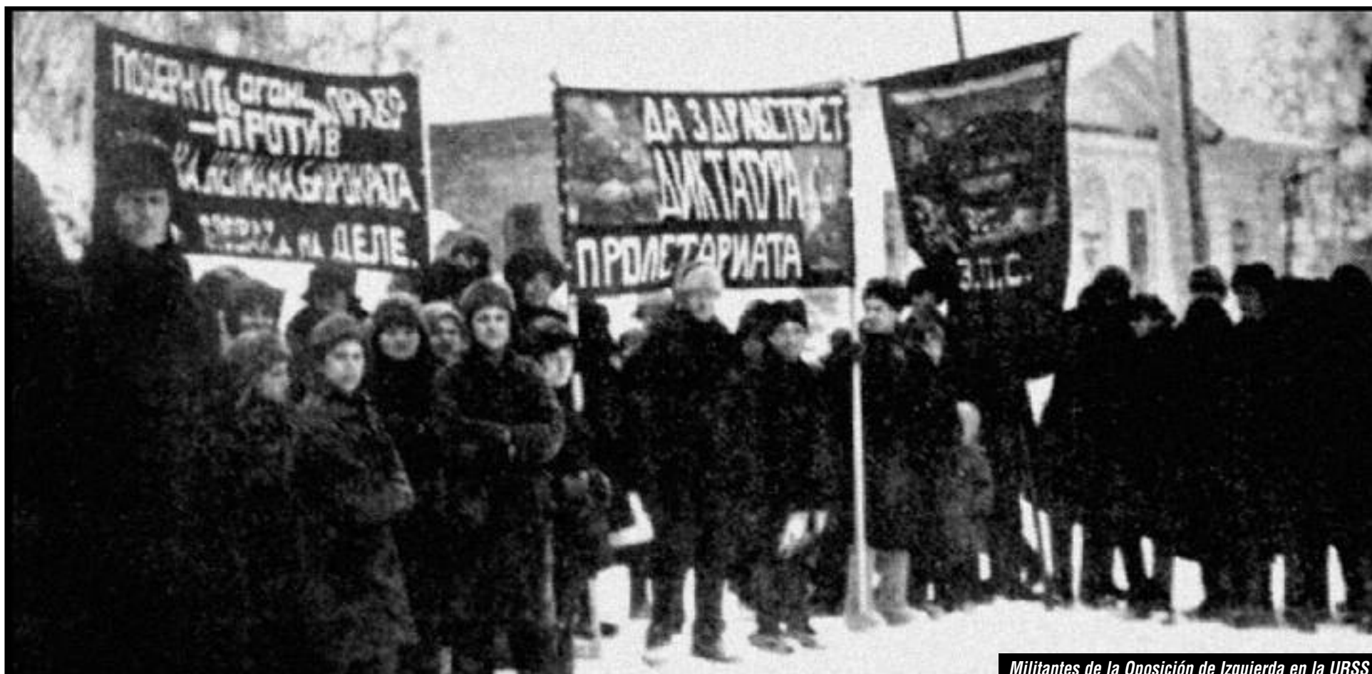
Militantes de la Oposición de Izquierda en la URSS

¡Viva el Trotskismo! ¡Viva la IV Internacional!