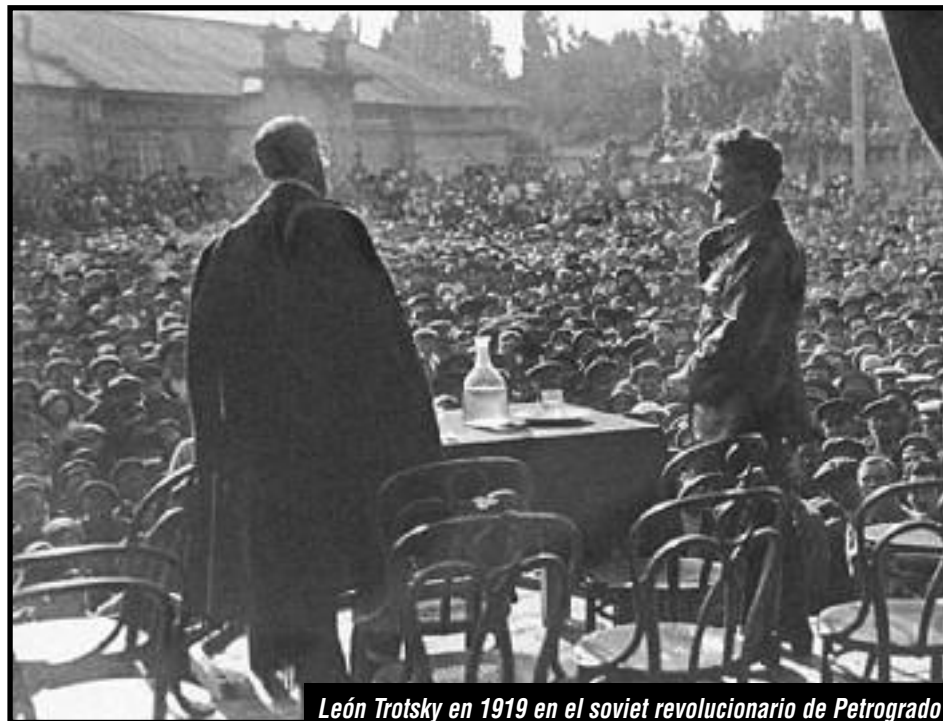
León Trotsky en 1919 en el soviet revolucionario de Petrogrado

Desde la FLTI afirmamos y reivindicamos lo que denunciara Krupskaya,