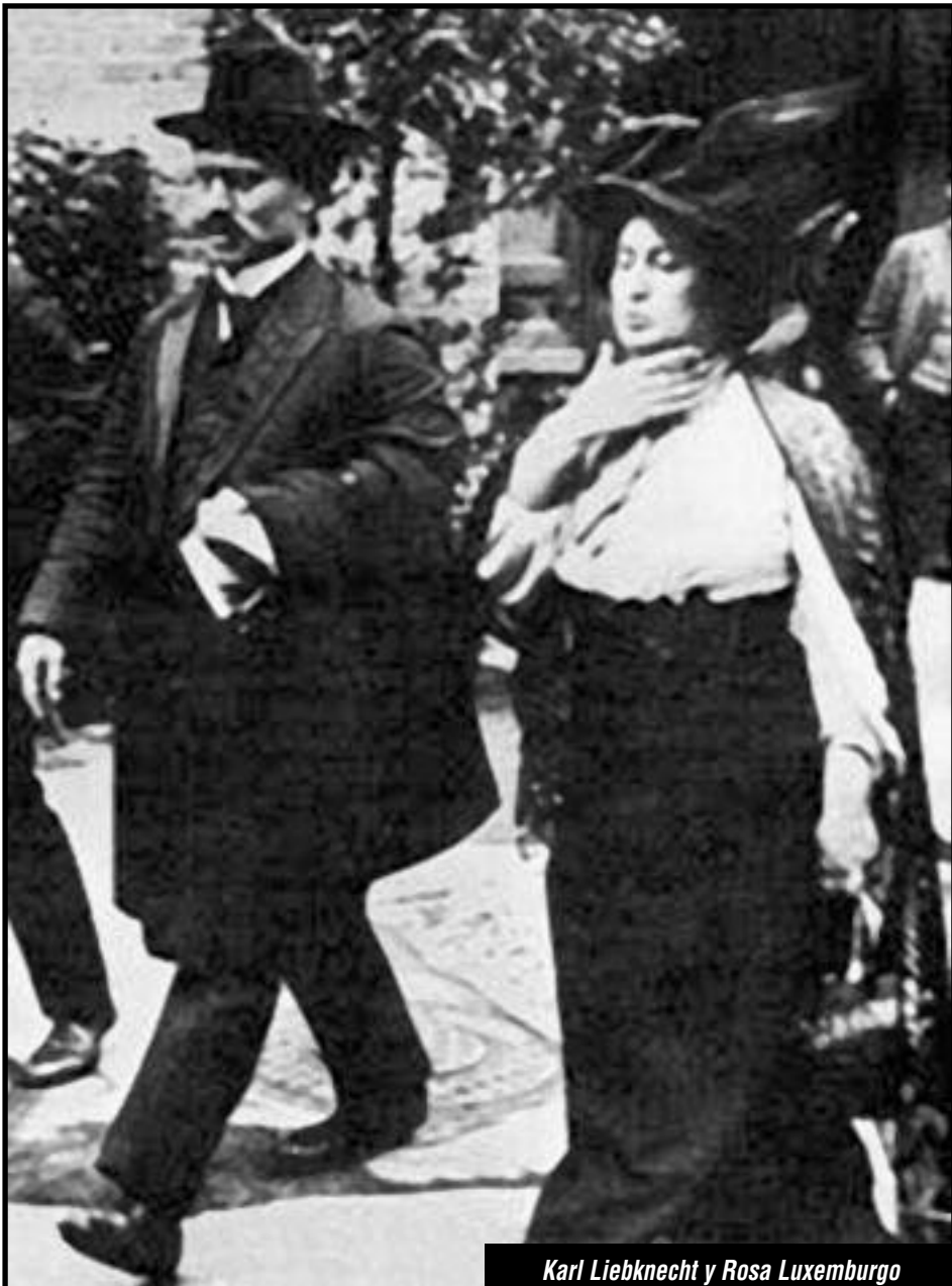
Karl Liebknecht y Rosa Luxemburgo

Desde la FLTI sabemos que liquidar y destruir a toda una generación de revolucionarios internacionalistas e incorruptibles es lo que permitió en última instancia que el capitalismo se sobreviviera, puesto que el proletariado sufrió un duro golpe a la centralización internacional de su combate, su organización y conciencia internacionalista, condiciones indispensables para que la clase obrera pueda liberarse de la explotación en la sociedad capitalista.