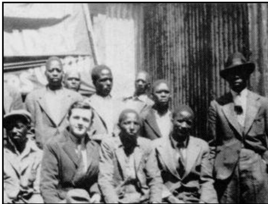
Los militantes trotskistas de la IV Internacional en Johannesburgo, Sudafrica 1934

Les va la vida en que no se logre constituir un punto de apoyo donde todo obrero del mundo que quiera luchar por la revolución proletaria internacional y unirse con sus hermanos de clase del mundo -como única posibilidad de triunfar en cada país- pueda agruparse bajo las banderas lim-