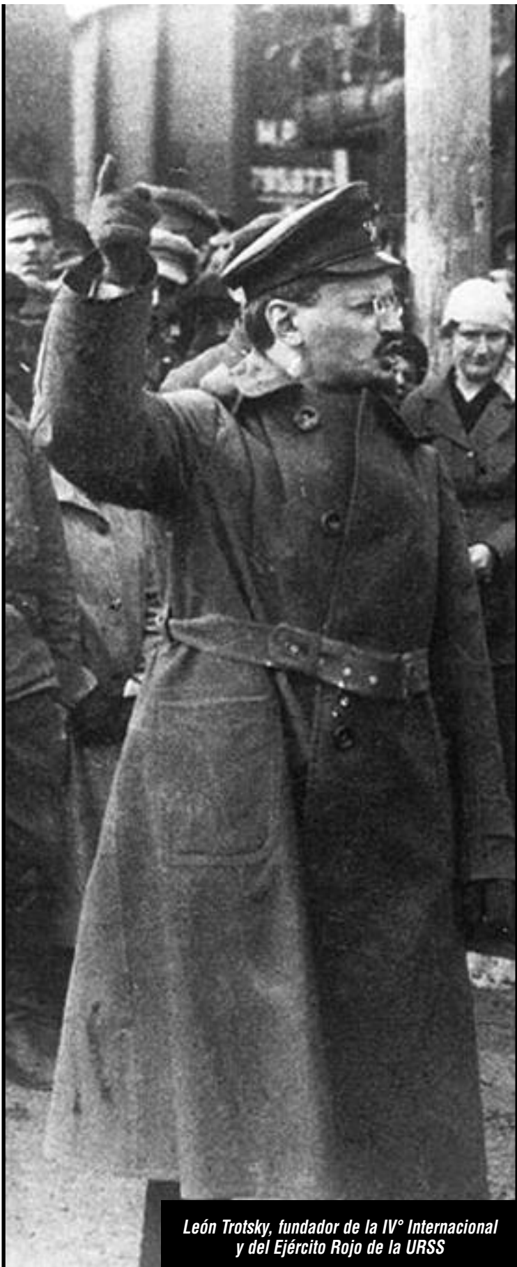
León Trotsky, fundador de la IVº Internacional y del Ejército Rojo de la URSS

A 70 años del asesinato de León Trotsky, desde la Fracción Leninista Trotskista Internacional rendimos un homenaje a su obra más grandiosa: fundar la IV Internacional, que fuera continuidad del bolchevismo y la III Internacional, es decir, de la fracción internacionalista y revolucionaria del proletariado mundial.