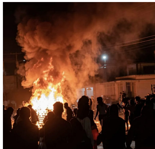
Manifestantes queman locales del PC cubano

luego quedársela como un trofeo y así escarmentar a los trabajadores cubanos y de todo el continente, mostrando que lo que cae es el “socialismo” para que nunca más la clase obrera ose levantarse en su nombre y le toque su propiedad.