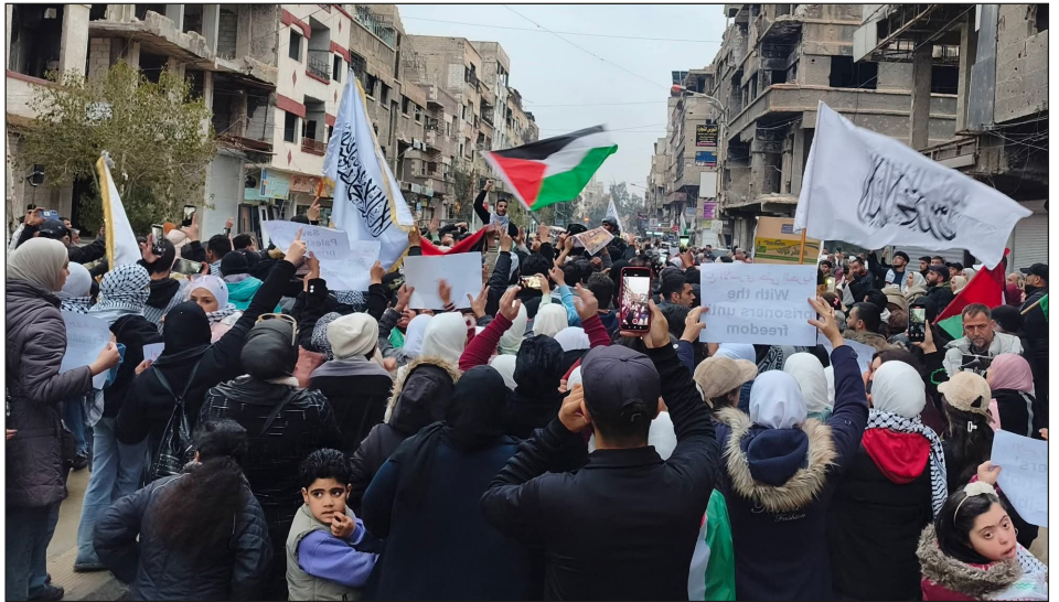
Campamento palestino de Yarmouk en Damasco

¡Expropiación sin pago de todas las petroleras, bancos y fábricas bajo control de sus trabajadores!