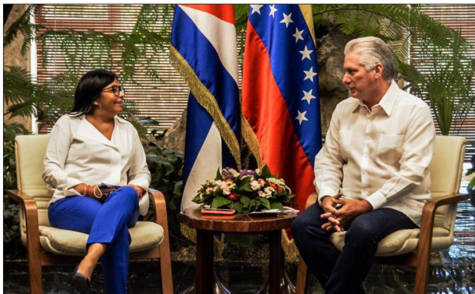
La cipaya Delcy Rodríguez de Venezuela junto a Díaz Canel

¡Hay que recuperar las empresas que los millonarios del PC le robaron al pueblo