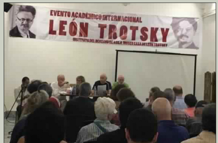
La Habana, 2019. "Encuentro León Trotsky" organizado por el stalinismo cubano

No olvidamos que Alan Woods, dirigente de la CMI y uno de los promotores del Encuentro fue quien, en medio de la estafa de