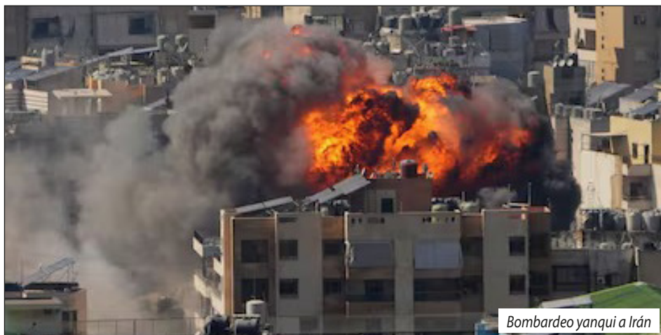
Bombardeo yanqui a Irán

Declaraciones del Secretariado de Coordinación Internacional de la FLTI