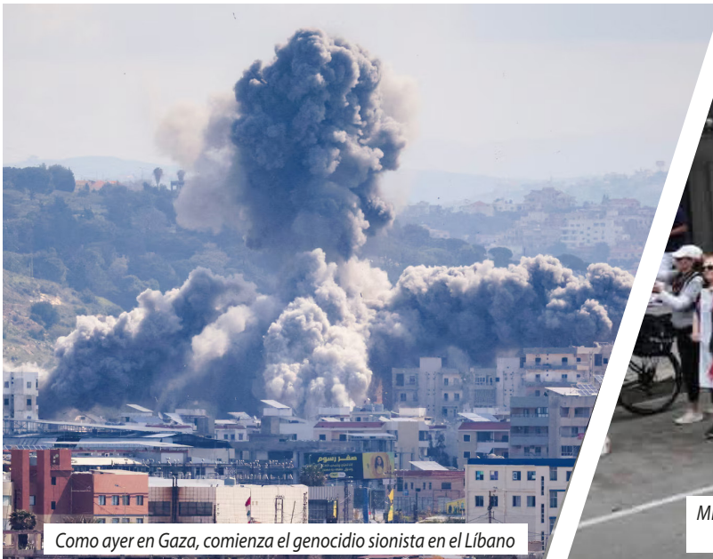
Como ayer en Gaza, comienza el genocidio sionista en el Líbano

¡HAY QUE DERROCAR A TRUMP EN EEUU, APLASTAR A LA BESTIA SIONISTA Y ROMPER EL CERCO A GAZA!