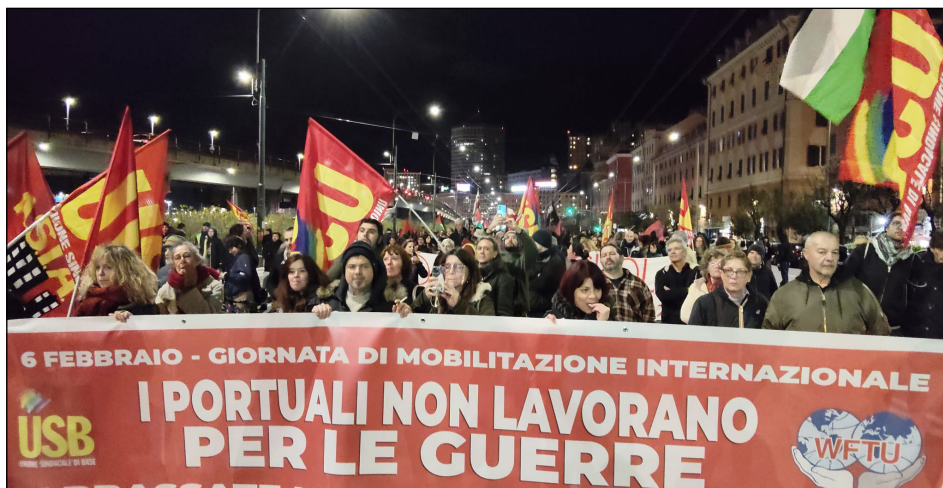
Febrero 2026 - Huelga de trabajadores portuarios de Italia por Gaza "Los portuarios no trabajamos para la guerra"

Es que sobran potencias imperialistas. Sus monopolios se pelean a dentelladas el mercado mundial. Si a un imperialismo le va bien, al otro le va mal. De eso se trata el imperialismo: del sistema capitalista en descomposición que aproxima más y más a la civilización humana a la barbarie y a la guerra.