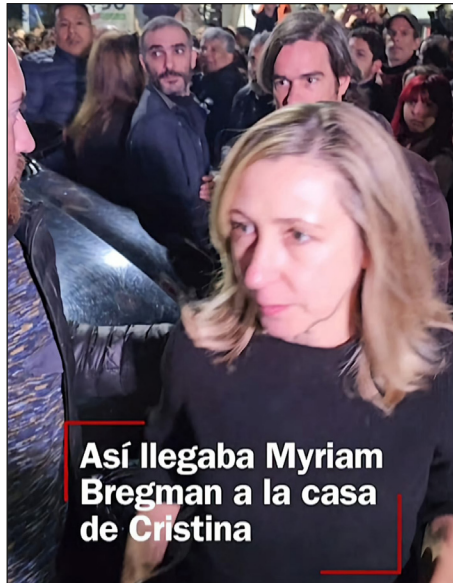
Así llegaba Myriam Bregman a la casa de Cristina

Si hoy comparamos la "imagen positiva" de Bregman con las tareas revolucionarias que tiene planteada la clase obrera, claramente concluiríamos que no hay nada