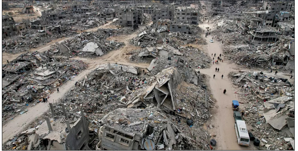
Gaza devastada por el genocidio del sionismo y los yanquis

Mientras, las potencias imperialistas europeas, expectantes ante la ofensiva yanqui por las zonas de influencia en