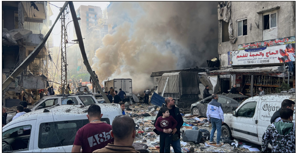
Suburbios de Beirut, Líbano, bombardeados por el sionismo

cesitan la huelga general internacional, ganar las calles para destruir al estado fascista de Israel, y derrocar sin demora a Trump, el Hitler que tiene hoy la Casa Blanca salido de la cloaca de Wall Street, BlackRock, State Street, Vanguard y demás fondos de inversión de la industria de guerra yanqui.