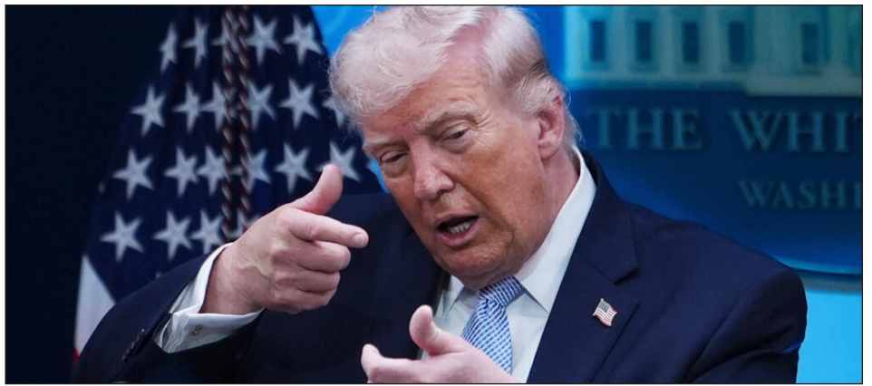
El carnicero Trump lanza un ultimátum a la nación iraní

guerra de tierra arrasada e intervención directa con tropas de los yanquis en Irán, es la clase obrera de EEUU, que por millones entran al combate y golpean al corazón de la bestia imperialista.