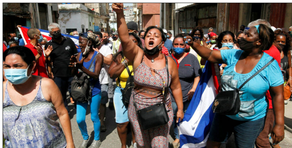
Protestas de las masas cubanas en 2021

negro en EEUU y más tarde entregando la oleada revolucionaria de principios de siglo XXI ponía a ésta a los pies de las burguesías “progresistas” o de la estafa de la “revolución bolivariana” “sostenida por el FSM y su “ala izquierda” de renegados del trotskismo.