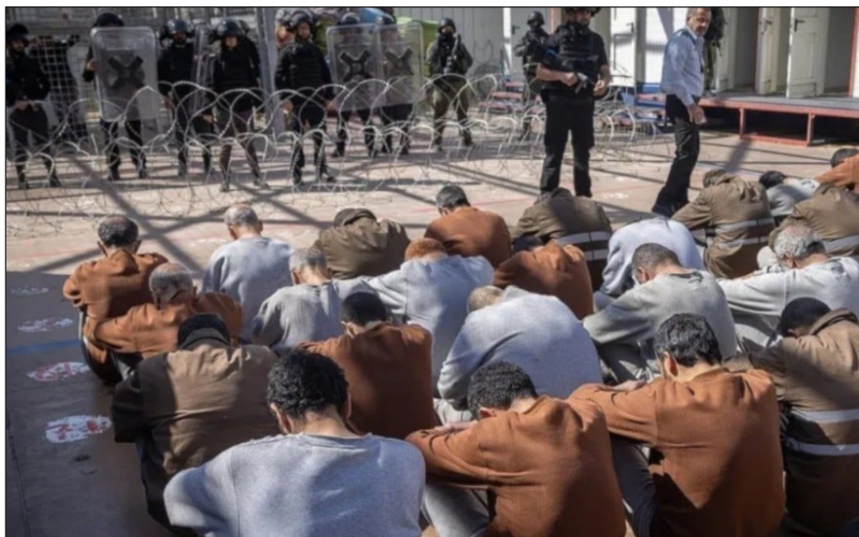
Presos palestinos en las mazmorras del ocupante sionista

No podemos olvidar que desde el 2023 más de 72 mil mártires fueron asesinados por el ejército sionista en Gaza y más de 1000 en Cisjordania. Son más de 9500 los prisioneros políticos en las cárceles del ocupante viviendo en condiciones inhumanas. La mitad de ellos están presos por “detenciones administrativas”, es decir, sin ningún tipo de acusación y sin derecho a defensa. En esos verdaderos campos de tortura que son las prisiones sionistas, han muerto más de 80 detenidos.