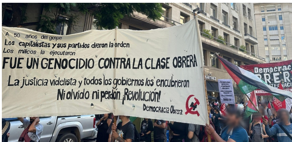
Intervención de Democracia Obrera en la movilización por el 24 de Marzo: "¡Fue un genocidio contra la clase obrera", "¡Ni olvido, ni perdón... Revolución!"

¿Cómo un 24 de Marzo no van a denunciar a la casta de oficiales de las