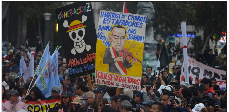
Jornada revolucionaria del 15/10/25: la juventud obrera grita "¡Que se vayan todos!"

UN CONGRESO NACIONAL DE DELEGADOS DE BASE DE TODOS LOS TRABAJADORES, LA JUVENTUD COMBATIVA Y LOS CAMPESINOS POBRES PARA ROMPER CON LA BURGUESÍA Y PELEAR POR LA HUELGA GENERAL