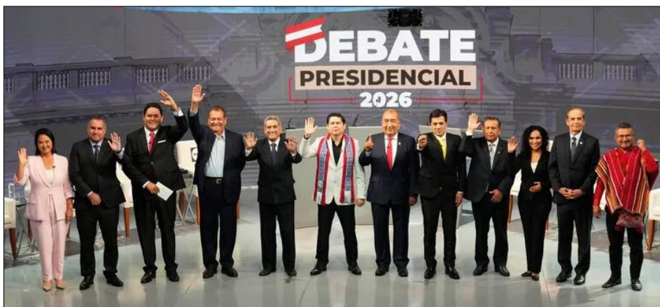
Debate presidencial de los candidatos a las elecciones ilegítimas

En esta trampa electoral la burguesía apuesta a una renovación del gobierno y el Congreso corrupto, una notaría de Wall Street, en momentos en que los yanquis vienen por todo en América Latina. En Perú buscan poner un nuevo agente directo tipo Milei de Argentina, Paz de Bolivia o Kast de Chile, para que aplique hasta el final