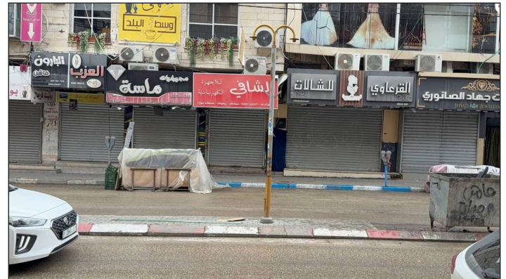
Calles desoladas durante la Huelga General en Cisjordania

Estas mismas movilizaciones se están dando en todas las ciudades de Siria. Levantan en alto consignas de apoyo a Gaza y a Líbano contra el sionismo. En distintas marchas se exige que se abran los frentes. Desde Daraa ya marchan al Golán ocupado bus-