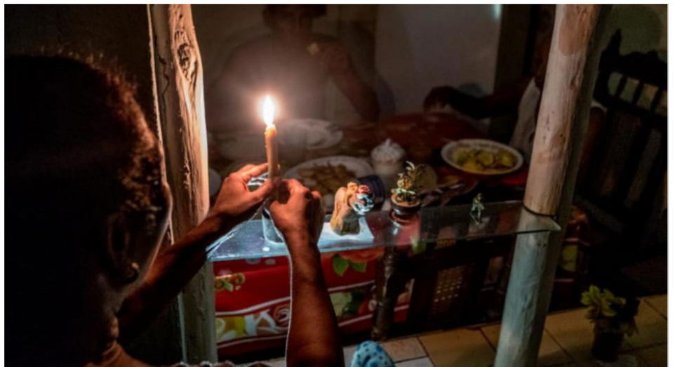
Apagones generalizados en Cuba

EEUU pisa América Latina arrodillando a las burguesías bolivarianas cipayas. Con la rendición de la Delcy en Venezuela y de Petro en Colombia termina de aislar Cuba, profundiza el bloqueo económico impidiendo el suministro de petróleo a la isla, recurso vital para mantener el transporte,