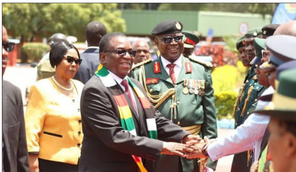
Mnangagwa y altos mandos del ejército

Ante el golpe económico inflacionario que profundiza la crisis, y ahora con el autogolpe bonapartista de Mnangagwa en ciernes, la burocracia de la ZCTU (cen-