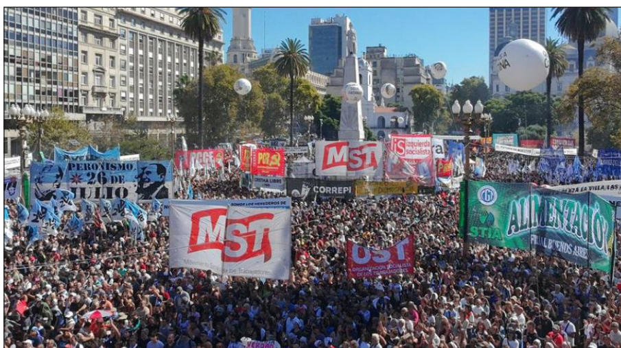
Banderas de partidos del FIT-U en el acto en Plaza de Mayo con los organismos de DDHH kirchneristas

que ayer fueron cómplices del golpe videlista y hoy le dieron superpoderes a la autocracia de Milei