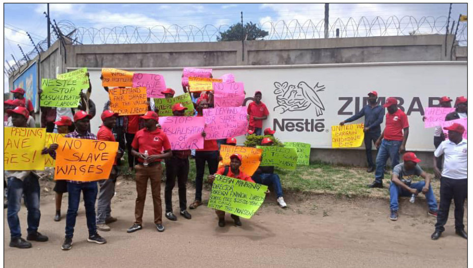
Obreros de Nestlé en lucha por salarios

El UFAWUZ (sindicato de la alimentación), y los enfermeros que están peleando por salario, tienen toda la