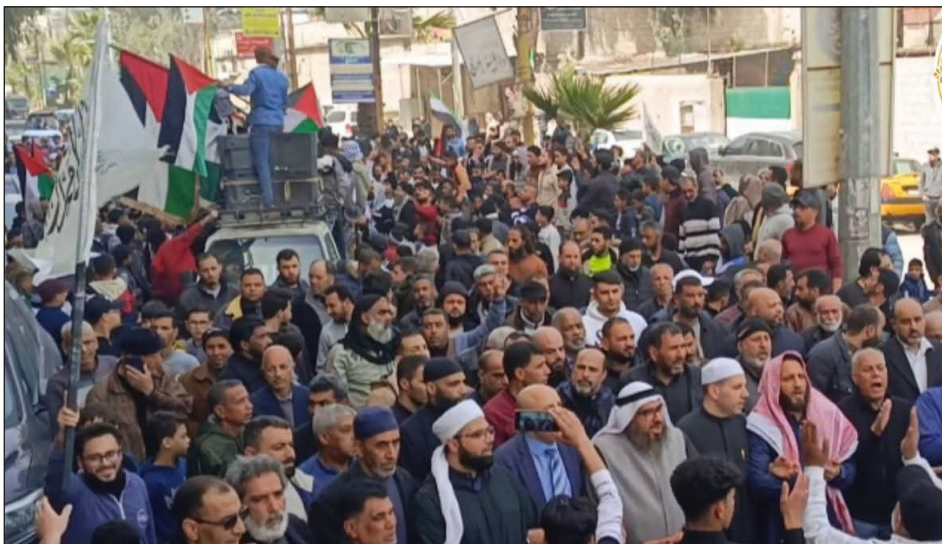
Campamento de Sida Zeineb - Altos del Golán

Al Jolani llegó a Damasco a contener y desviar la revolución y miró para otro lado mientras el sionismo invadía y tomaba tierras en el sur de Siria. Luego pactó con Netanyahu seguir custodiando las fronteras del Golán y salió a la luz lo que verdaderamente es: un sirviente de Trump, el nuevo regente de los negocios de la burguesía y el imperialismo en Siria, que viene de pac-