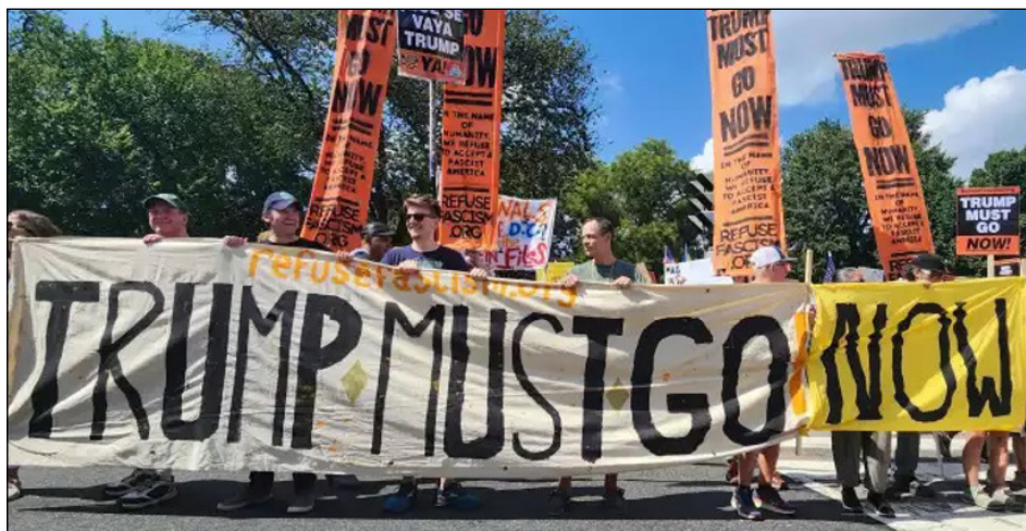
Movilización en EEUU: "¡Trump debe irse ahora!"

¡Legalidad a todos los sindicatos y organizaciones de lucha de las masas iraníes!