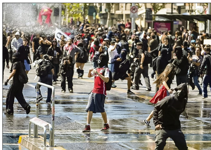
La juventud rebelde gana las calles

Si la movilización estudiantil de más de una decena de miles fue un primer paso, lamentablemente no fue más masiva debido a que las direcciones burocráticas de la CONFECH, la FEUSACH y la FECH (dirigidas por el Frente Amplio, el Partido Comunista y el Partido Socialista) ni siquiera querían convocarla porque dijeron que "era una irresponsabilidad". ¡Son la Jota de