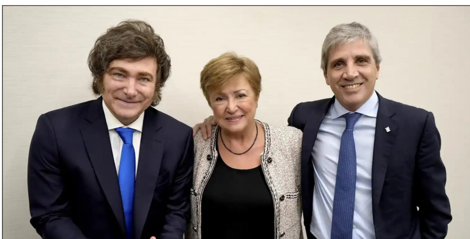
La titular del FMI, Kristalina Georgieva, junto a Milei y su Ministro de Economía Caputo

Es que este plan solo pasa a los palazos y a los tiros y así se preparan, de ser necesario, para provocar un nuevo baño de