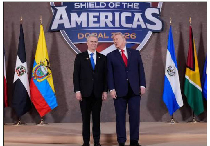
Kast firma el “Escudo de las Américas” de Trump

¡Por un Congreso Obrero Nacional con delegados con mandato de base de todo el movimiento obrero, la juventud rebelde y los campesinos pobres, para abrir el camino a la Huelga General Revolucionaria hasta derrotar el “bencinazo” y todo el programa de ajustes antiobreros de Kast, el régimen cívico-militar pinochetista y el imperialismo! ¡Que la crisis la paguen los que la provocaron, el imperialismo yanqui y sus socios menores, los capitalistas nacionales!