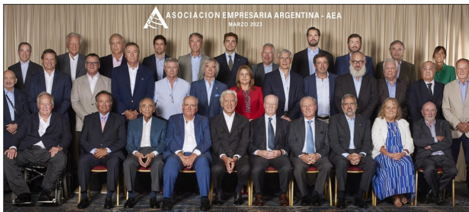
Los grandes capitalistas de AEA: los jefes de los milicos genocidas de la dictadura videlista y hoy de los políticos patronales de la archirreaccionaria Constitución del '53

Cómo en Uruguay, Chile, Bolivia... los explotadores y el imperialismo dieron un golpe para aplastar a la clase obrera y su curso revolucionario.