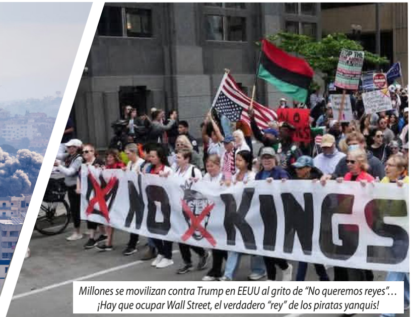
Millones se movilizan contra Trump en EEUU al grito de “No queremos reyes”... ¡Hay que ocupar Wall Street, el verdadero “rey” de los piratas yanquis!