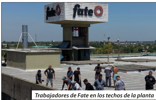
Trabajadores de Fate en los techos de la planta

Los obreros de FATE y sus familias, que llevan más de 50 días de lucha recibiéndolo la solidaridad de distintos sectores y del barrio donde está la planta, tienen toda la autoridad para plantear este camino. Pero Crespo, el PO y todo el FIT-U