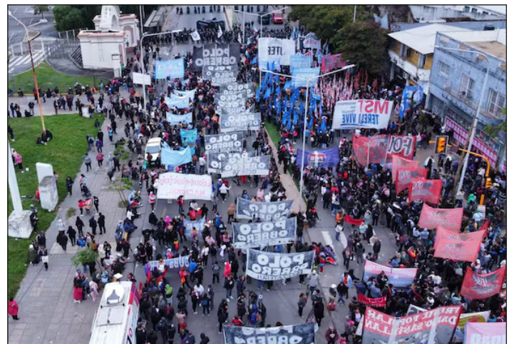
Corte de trabajadores desocupados en Puente Pueyrredón

despidos y desocupados junto a los trabajadores de planta. ¡Marchemos a la CGT a echar a los burócratas traidores que nos dividen y entregan! ¡Paso a la autoorganización y a los que luchan!