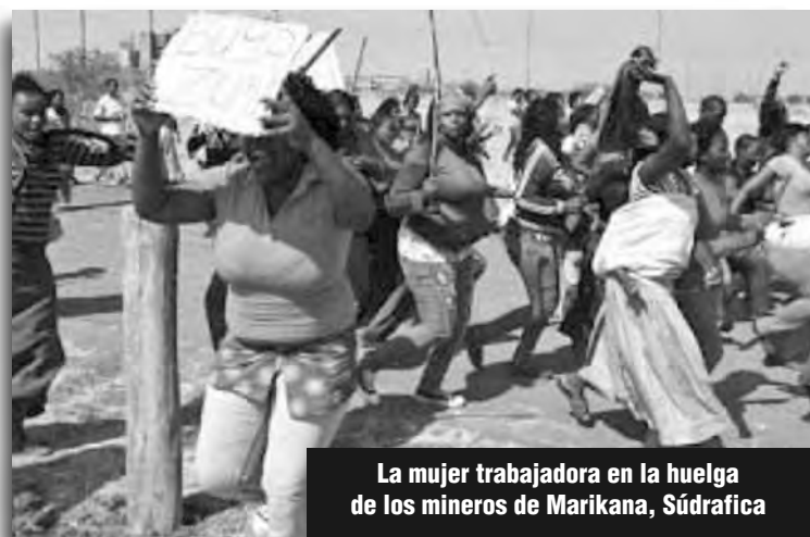
La mujer trabajadora en la huelga de los mineros de Marikana, Súdrica

La mujer obrera, para poder ir a trabajar o realizar cualquier actividad, se ve obligada muchas veces a tener que dejar solos a sus hijos, o a gastar gran parte de su salario de miseria pagando para que se los cuiden. Por ello, luchamos por licencia por maternidad de dos años, pagada por la patronal y el estado; y por guarderías gratuitas, con personal idóneo y profesional, garantizadas por el estado y bajo control de los trabajadores, abiertas los 365 días del año, las 24 horas, para que la mujer de la clase obrera pueda trabajar, estudiar, hacer deportes, divertirse, sabiendo que sus hijos están bien cuidados y seguros. Esta pelea es inseparable de la lucha por una salud y una educación públicas gratuitas y de alta calidad, sobre la base de terminar con los subsidios a la educación privada, de la expropiación de todos los establecimientos educativos y sanatorios y clínicas privados, y de impuestos progre-