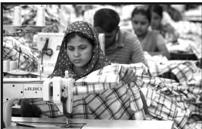
Obreras textiles de Bangladesh superexplotadas en las maquilas de las transnacionales imperialistas

¡PASO A LA MUJER TRABAJADORA, VANGUARDIA DE LA REVOLUCIÓN SOCIALISTA MUDIAL!