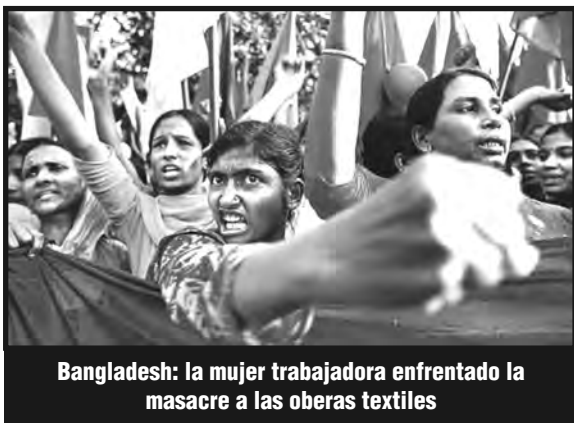
Bangladesh: la mujer trabajadora enfrentado la masacre a las operas textiles

Develado el “secreto” de la triple explotación, se derrumba también como un castillo de naipes la afirmación de los