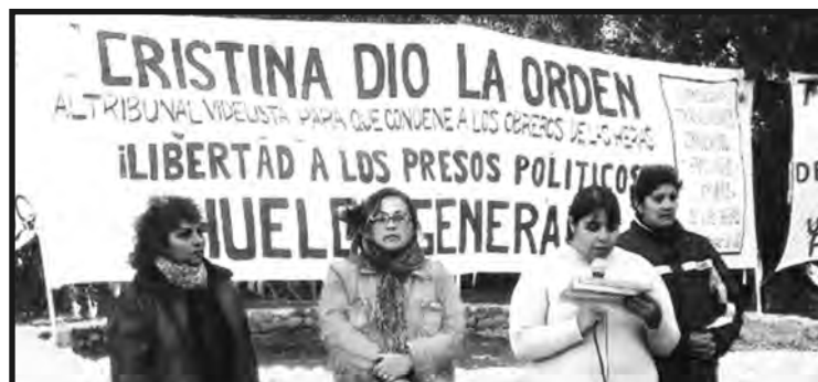
Acto 1ro de Mayo (2014) en Las Heras: Las mujeres y compañeras de los trabajadores y luchadores encarcelados, procesados y condenados por el gobierno de la Kirchner y sus jueces

Comisión de Trabajadores condenados, Familiares y Amigos de Las Heras / comisionamigosfamiliareslh@gmail.com / Facebook: libertad petroleros las heras