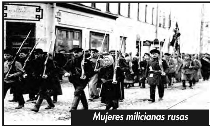
Mujeres milicianas rusas

El programa revolucionario frente a la mujer trabajadora es, en primer lugar, el programa de lucha por la revolución socialista triunfante, la conquista del poder y la imposición de la dictadura del proletariado, sin lo cual no podrá liberarse la clase obrera, de la cual la mujer trabajadora es parte. Porque como decía la III Internacional revolucionaria, “Mientras exista la dominación del capital y la propiedad privada, la liberación de la mujer no será posible (...) La igualdad no formal, sino real de la mujer no es posible más que bajo un régimen donde la mujer de la clase obrera será la dueña de sus instrumentos de producción y de distribución, tomando parte en su administración y teniendo la obligación del trabajo en las mismas condiciones que todos los miem-