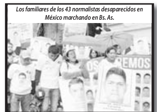
Los familiares de los 43 normalistas desaparecidos en México marchando en Bs. As.