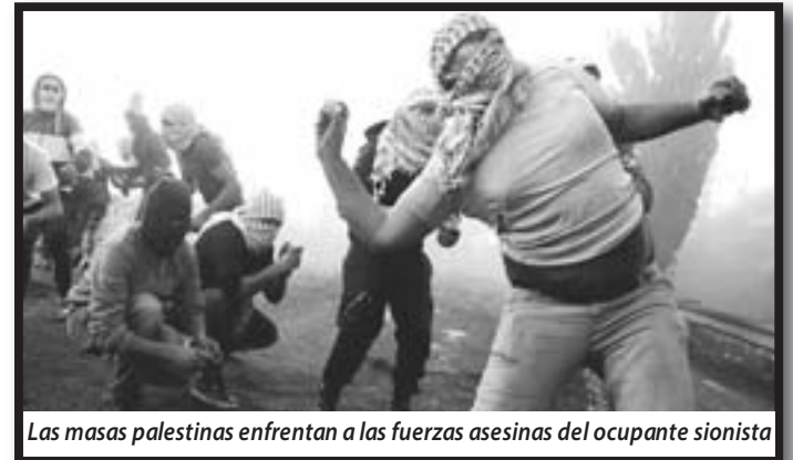
Las masas palestinas enfrentan a las fuerzas asesinas del ocupante sionista