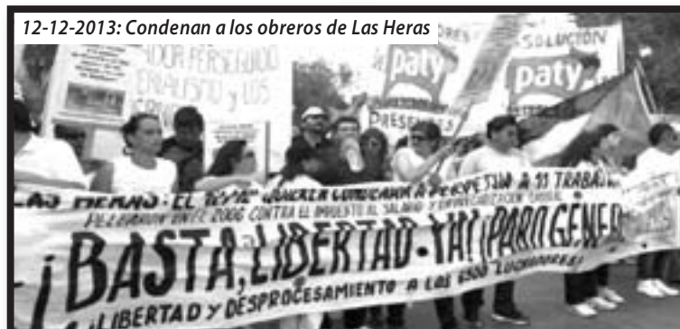
12-12-2013: Condenan a los obreros de Las Heras