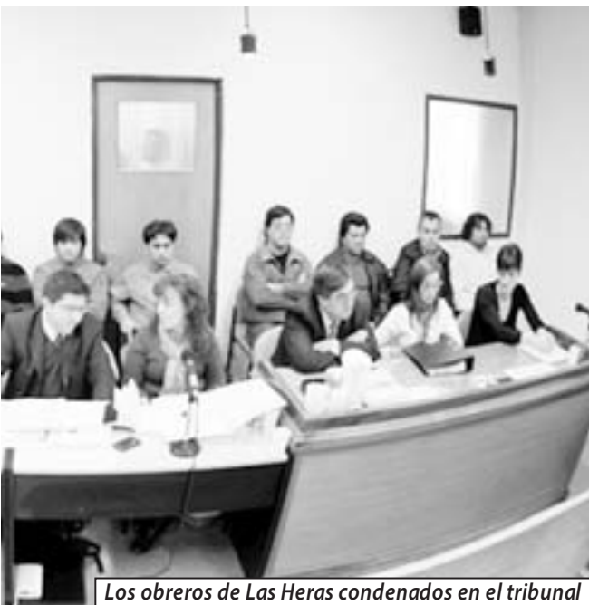
Los obreros de Las Heras condenados en el tribunal

no de la Kirchner, sus Fuerzas Armadas genocidas, sus jueces y sus políticos corruptos, exigieron nuestra condena y nuestro castigo, como sucedió en una Asamblea Nacional Parlamentaria en 2014. Los de arriba se han unido para esclavizar a los trabajadores y condenar a los que luchamos, y los de abajo tenemos que unirnos para parar la mano a tanto atropello e injusticia.