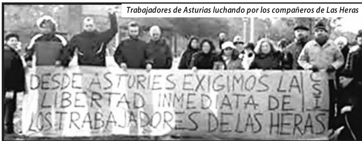
Trabajadores de Asturias luchando por los compañeros de Las Heras