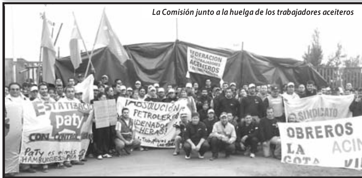
La Comisión junto a la huelga de los trabajadores aceiteros

Los trabajadores y oprimidos de Argentina necesitamos unirnos para enfrentar la persecución, luchar por nuestras demandas y hermanarnos con nuestra clase en todo el mundo; junto a la resistencia siria y palestina y a todos los comités de solidaridad con nuestros hermanos refugiados que existen a nivel internacional; junto a los familiares y comités de solidaridad con el compañero Abdallah y los presos independentistas vascos; junto a las organizaciones estudiantiles que luchan por la educación gratuita y de calidad en Sudáfrica, Chile, México y Colombia; junto a las organizaciones obreras de África que luchan contra el saqueo y la explotación de la Anglo American y demás monopolios; junto a los heroicos obreros y estudiantes de Japón que enfrentan al gobierno de Abe; junto a los obreros chinos que pelean contra las condiciones de superexplotación en las fábricas cárcel y maquilas; junto Mumia Abu Jamal y a la juventud trabajadora que lucha por 15 dólares la hora en Estados Unidos y los trabajadores negros y chicanos que luchan contra el racismo y el asesinato de la policía de Obama; junto a los obreros de SIDOR de Venezuela; junto a los trabajadores de la salud y mineros de Perú; junto a los mineros y explotados del Donbass en Ucrania; junto a las organizaciones obreras y estudiantiles del Estado Español como Asturias en Pie y todos los que luchan contra la persecución, la represión y la cárcel de los Borbones y su policía asesina.