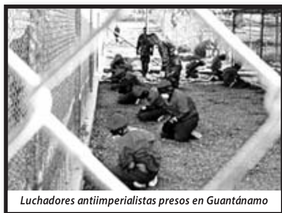
Luchadores antiimperialistas presos en Guantánamo