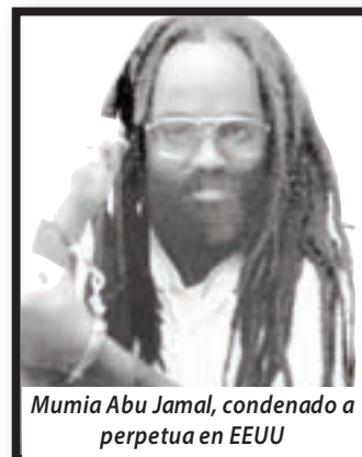
Mumia Abu Jamal, condenado a perpetua en EEUU