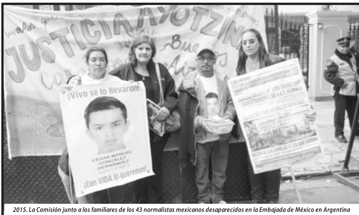
2015. La Comisión junto a los familiares de los 43 normalistas mexicanos desaparecidos en la Embajada de México en Argentina

Por estas duras luchas y ataques, y porque nos dimos cuenta que sin solidaridad no solamente íbamos a ser condenados sino que estaríamos ya en prisión, es que nosotros y nuestras familias salimos a contarle nuestra verdad a todos los trabajadores de Argentina y el mundo: las petroleras con el gobier-