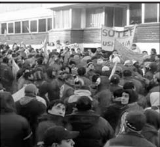
ros fueguinos en lucha. 2015: 34 Docentes y camioneros procesados

Nos unimos también a los docentes de CNTE de Oaxaca, México, que pelean por terminar con los procesamientos y encarcelamientos de sus dirigentes.