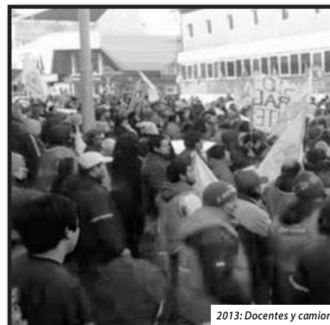
2013: Docentes y camioneros