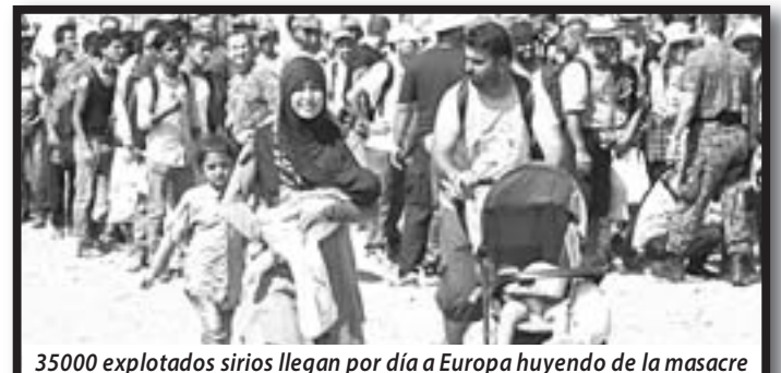
35000 explotados sirios llegan por día a Europa huyendo de la masacre

EN APOYO A LOS TRABAJADORES PERSEGUIDOS Y ENCARCELADOS, los refugiados políticos y contra los genocidios a los pueblos que se sublevan contra el hambre, la injusticia y el saqueo