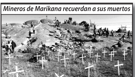
Mineros de Marikana recuerdan a sus muertos