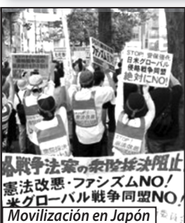
Movilización en Japón