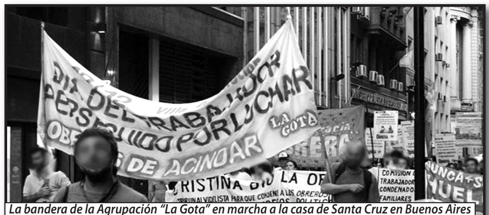
La bandera de la Agrupación "La Gota" en marcha a la casa de Santa Cruz en Buenos Aires

procesados y condenados, es un día mas que los obreros siguen despedidos, por eso hacemos nuestro el Llamamientos de Las Heras, para este 12/12, de poner en pie una Mesa Coordinadora de todos los procesados, donde tendremos la oportunidad de unificarnos y que truene el grito de