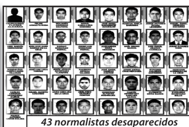
43 normalistas desaparecidos