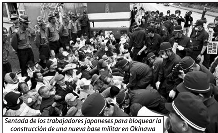
Sentada de los trabajadores japoneses para bloquear la construcción de una nueva base militar en Okinawa

Japan Revolutionary Communist League (Revolutionary Marxist Faction)