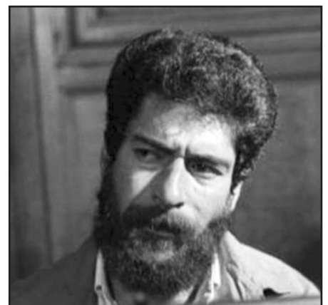
George Abdallah, combatiente por la causa palestina preso en Francia hace 32 años