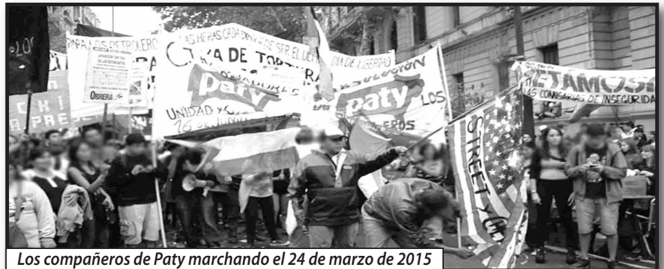
Los compañeros de Paty marchando el 24 de marzo de 2015

Desde la Comisión de Trabajadores de Paty "16 de junio en lucha" contestamos, adherimos y hacemos nuestra la invitación a participar este 12 de diciembre de 2015 en el DIA INTERNACIONAL DE LUCHA POR EL TRABAJADOR PERSEGUIDO Y ENCARCELADO. Pues tal como lo venimos haciendo desde que el tribunal de la venganza en el 2013 largo su condena a los obreros petroleros de Las Heras para disciplinarnos a todos los trabajadores que osemos levantar la voz contra nuestros explotadores por el pan de nuestras familias, mejores condiciones de trabajo, contra la precarización laboral y por la demanda de a "igual trabajo, igual salario". Siempre desde 2006 los obreros de Paty estamos junto a los petroleros de Las Heras y sus familias; como también estuvimos, estamos y estaremos luchando junto a todos los explotados del mundo, como nuestros hermanos sirios, palestinos, los jóvenes valientes griegos que hoy yacen