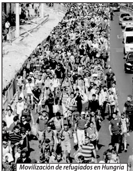
Movilización de refugiados en Hungría