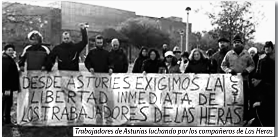
Trabajadores de Asturias luchando por los compañeros de Las Heras

Por esa razón nos gustaría que nos informarais sobre esa Red de