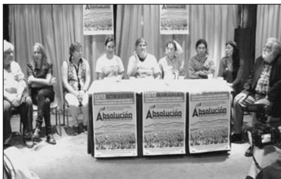
La delegación del Comité de familiares el Miércoles 23 de octubre de 2013. Conferencia de Prensa en el Hotel Bauen en Buenos Aires

Durante el trascurso del mismo y en los alegatos, los abogados defensores de los petroleros (amenazados constantemente por este tribunal y