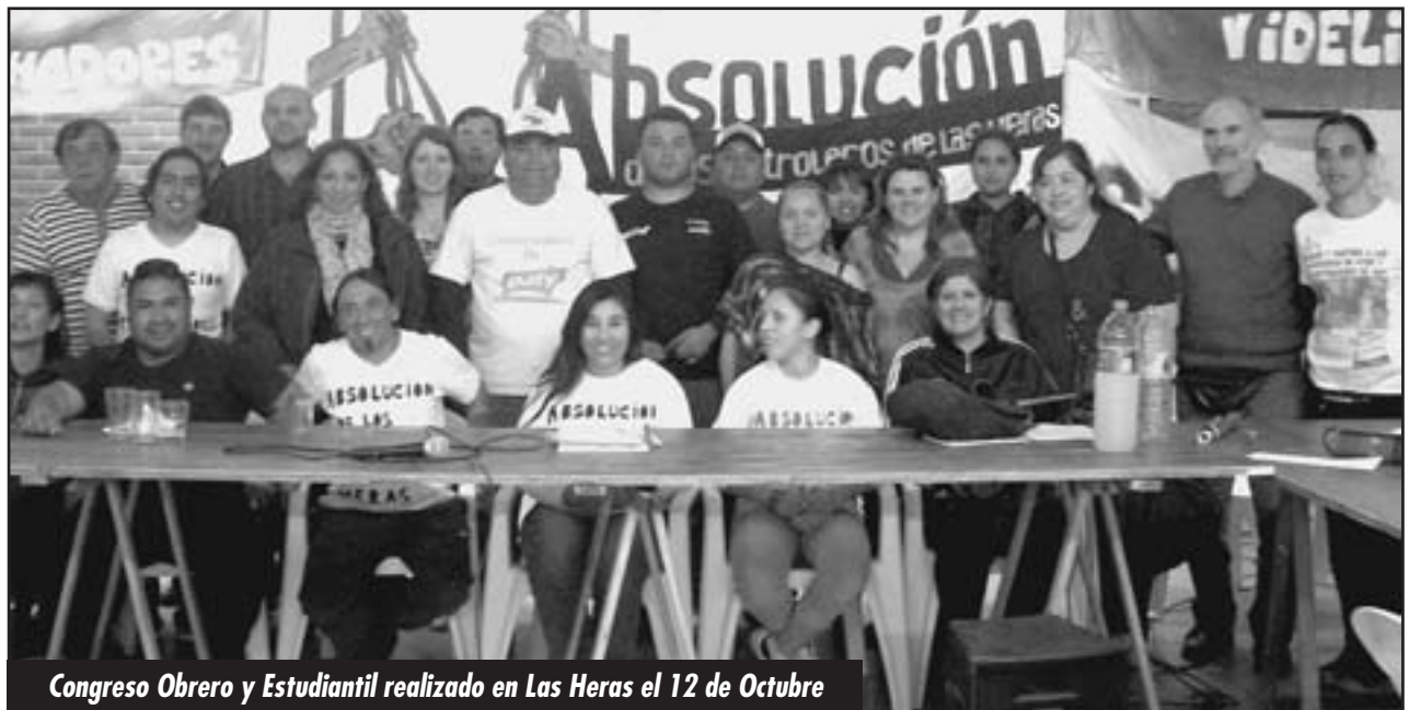
Congreso Obrero y Estudiantil realizado en Las Heras el 12 de Octubre

Un Congreso de Obreros y estudiantes y la Comisión de Trabajadores procesados, familiares y amigos de Las Heras ha hecho una moción a todos los trabajadores y a los luchadores antiimperialistas que debemos todos tomar en nuestras manos: