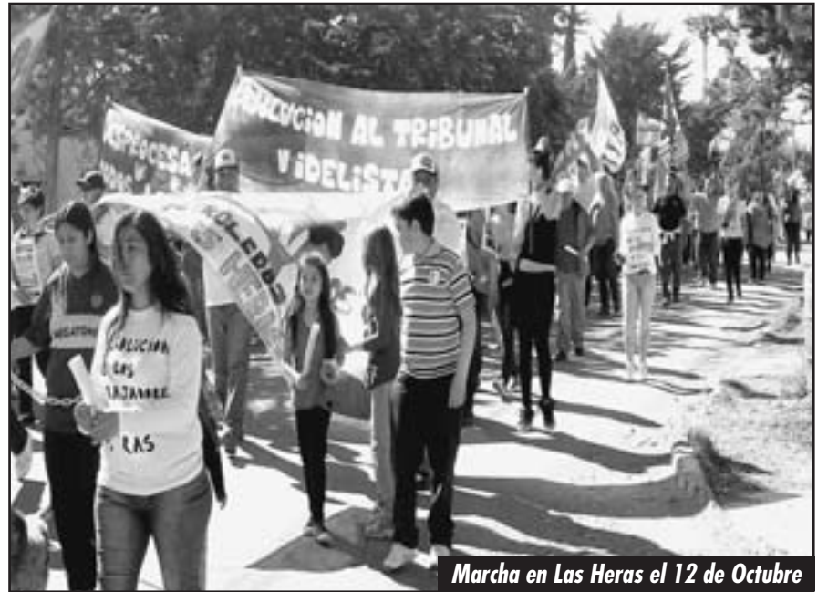
Marcha en Las Heras el 12 de Octubre