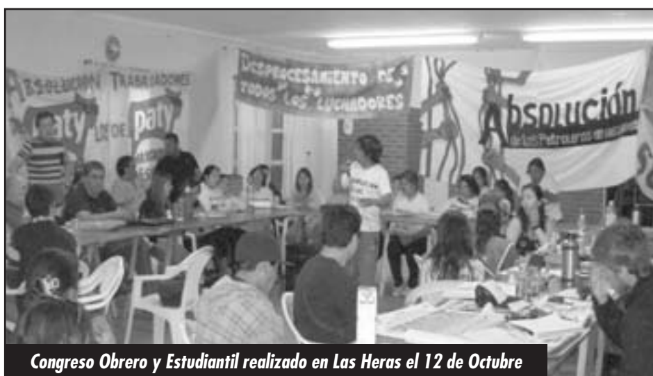
Congreso Obrero y Estudiantil realizado en Las Heras el 12 de Octubre

Los jueces, en pleno desarrollo del juicio oral, los detenían 24-48 hs para que "recuerden" muy bien lo que tenían que decir. Y esta brutal intimidación fue denun-