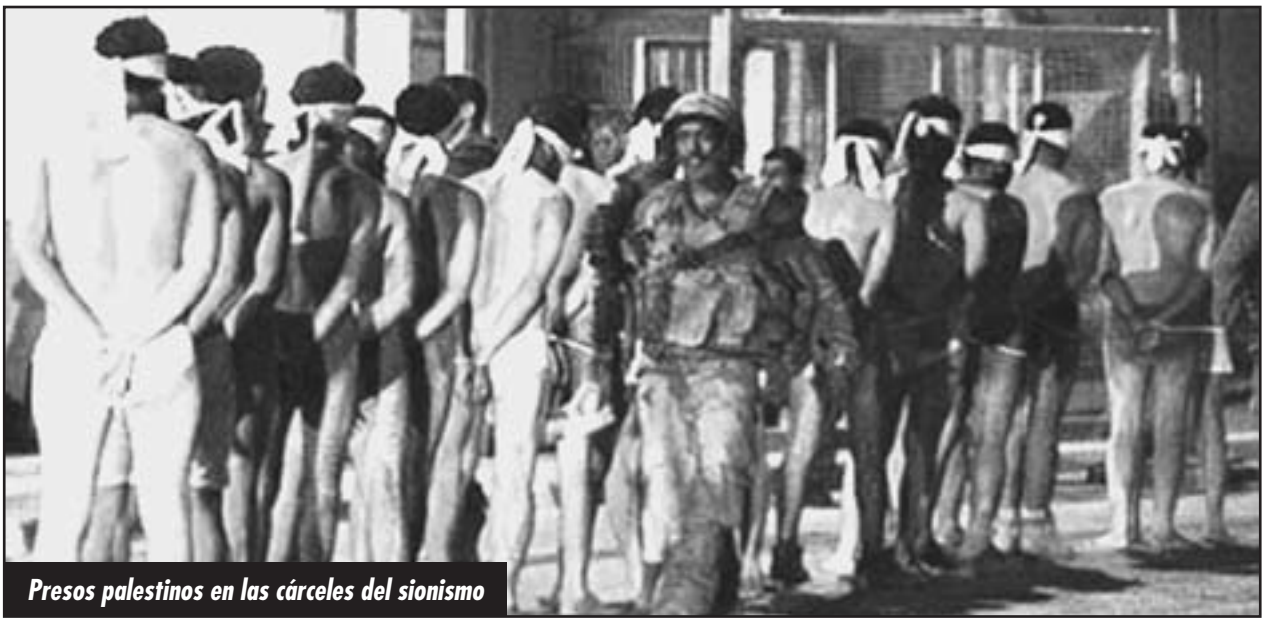
Presos palestinos en las cárceles del sionismo

Semanas atrás, el imperialismo yanqui con sus mercenarios entró a territorio libio y secuestró a Abu Anas el-Liby, cuando regresaba a su hogar lue-