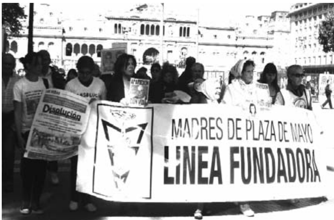
24-10-2013 En la ronda de las Madres de Plaza de Mayo se hizo escuchar la demanda de libertad a los obreros petroleros de Las Heras, a los presos políticos y el desprocesamiento de los 6500 luchadores