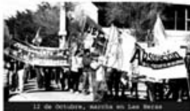
12 de Octubre, marcha en Las Heras

Todos los trabajadores debemos marchar por nuestra dignidad, nuestra libertad y hoy más que nunca contra el impuesto al salario y la precarización laboral.