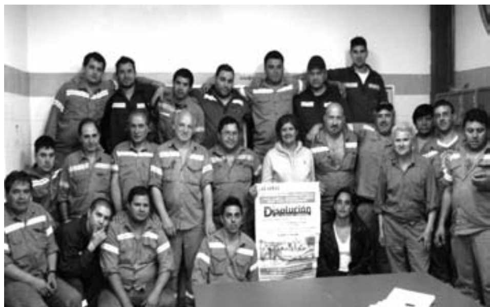
Subterráneos de Bs.As. Taller Constitución / 26-10-2013 ¡Gran asamblea de solidaridad obrera junto a la delegación de la Comisión de Las Heras!