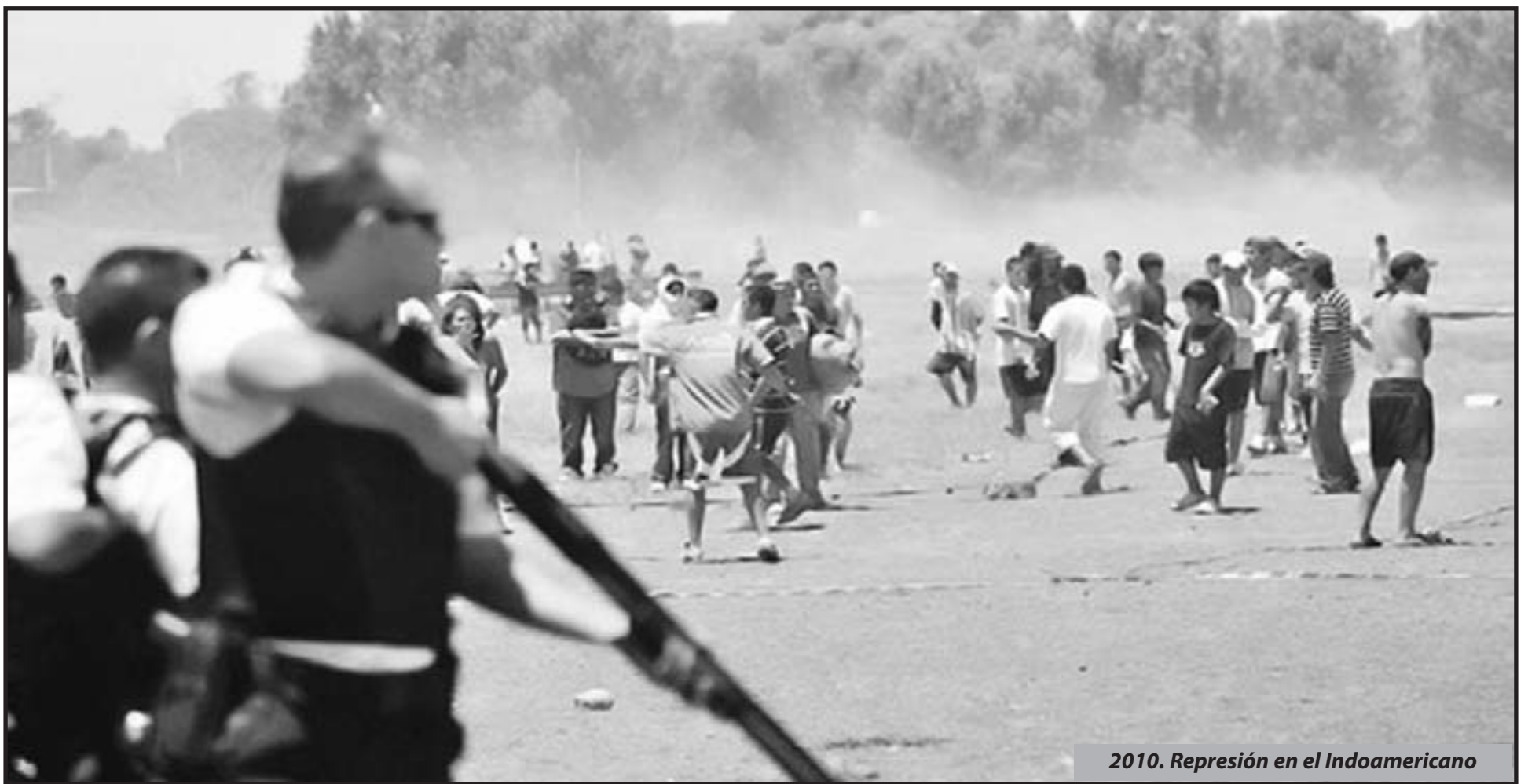
2010. Represión en el Indoamericano

Las corrientes de la izquierda Argentina como el FIT y el MAS que coinciden en su programa, han decidido seguir tras los pasos de la izquierda brasilera, de asimilarse al régimen de los opresores y hacerle creer a los trabajadores que sus demandas serán conseguidas con leyes en el parlamento de los verdugos. En cada lucha no han dudado ni dudan en llevar los conflictos al callejón sin salida de las conciliaciones obligatorias de los Ministerios de Trabajo, que no es más que un directorio de recursos humanos de todos los patrones contra los trabajadores.