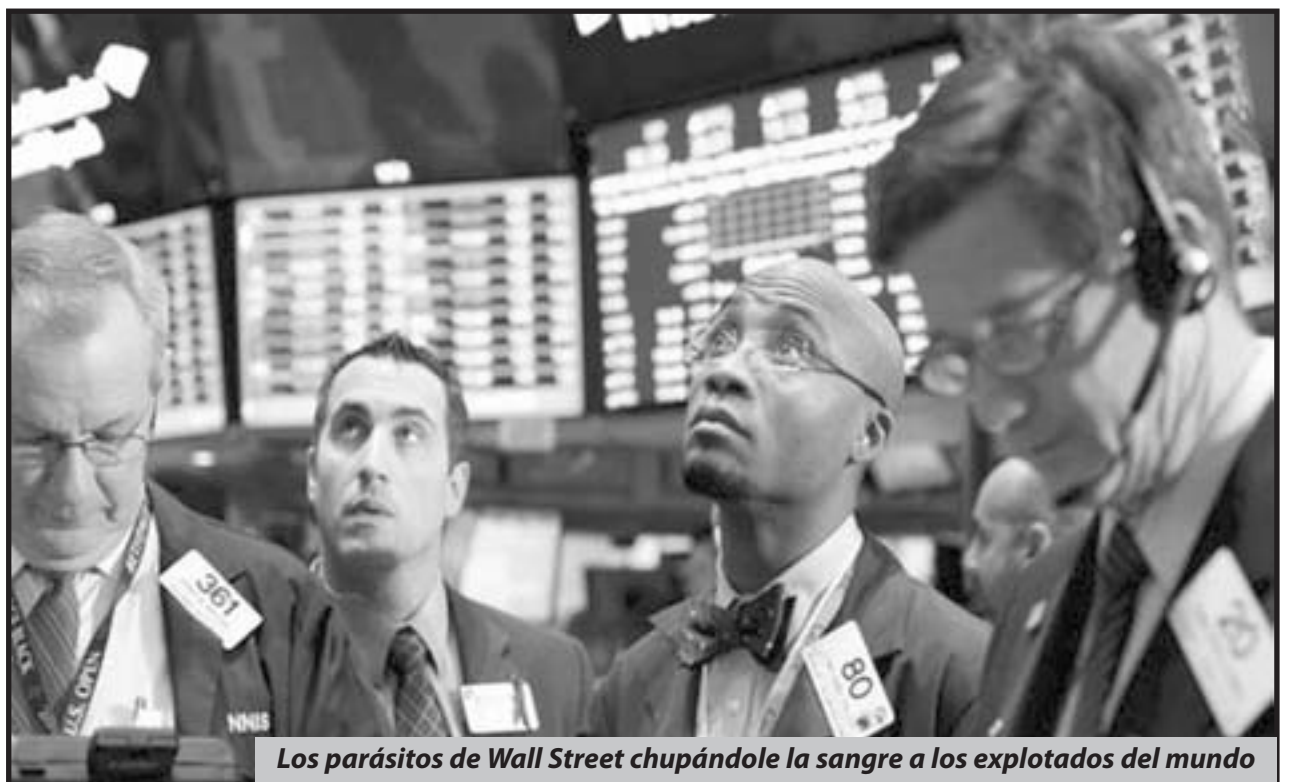
Los parásitos de Wall Street chupándole la sangre a los explotados del mundo