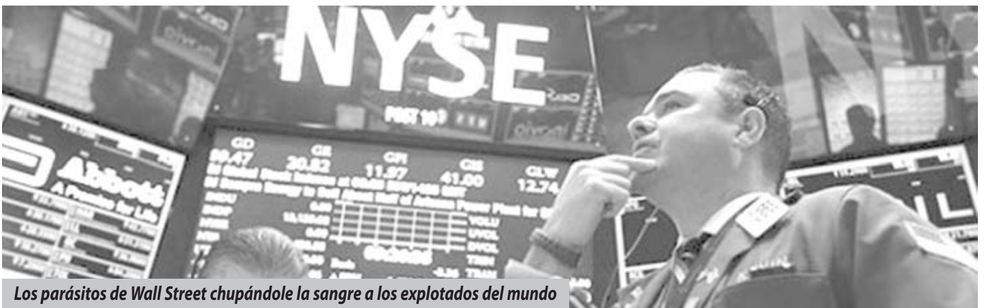
Los parásitos de Wall Street chupándole la sangre a los explotados del mundo

¡Fuera de Argentina y de todo el continente los banqueros y transnacionales de Wall Street!