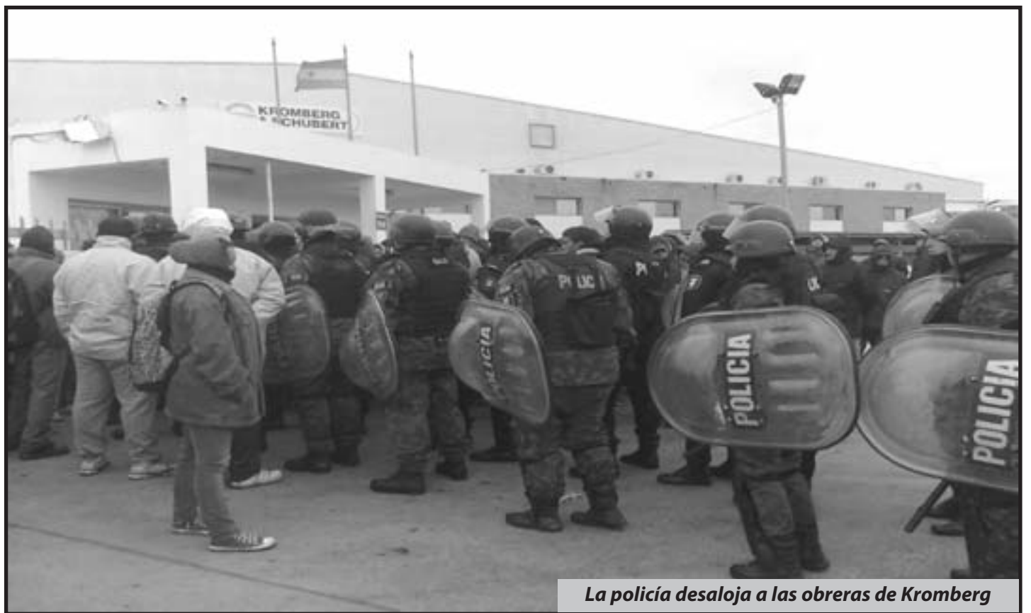
La policía desaloja a las obreras de Kromberg

No solamente esto, se han negado a hacer un solo acto unitario que unifique a una enorme cantidad de luchadores y delegados obreros que el FIT tiene en sus filas. Porque eso demostraría el