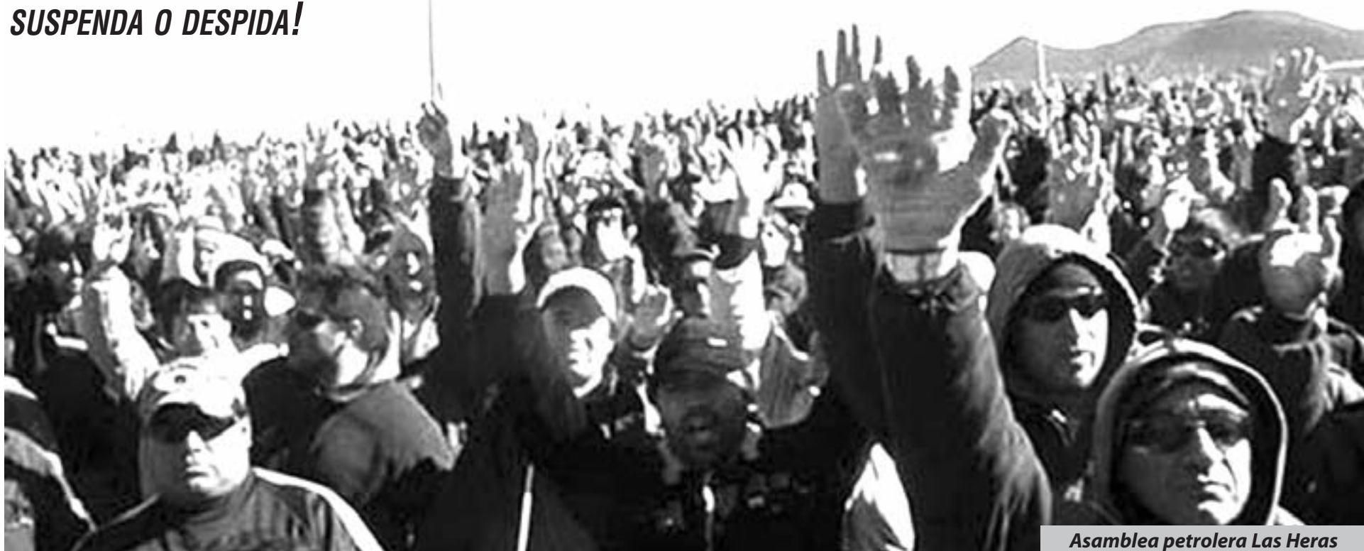
Asamblea petrolera Las Heras

¡POR LA LIBERTAD DE LOS OBREROS PETROLEROS DE LAS HERAS Y A LOS PRESOS POLÍTICOS, COMO LOS DE CORRAL DE BUSTOS Y BARILOCHE Y EL DESPROCESAMIENTO DE LOS 6.500 LUCHADORES OBREROS Y POPULARES!