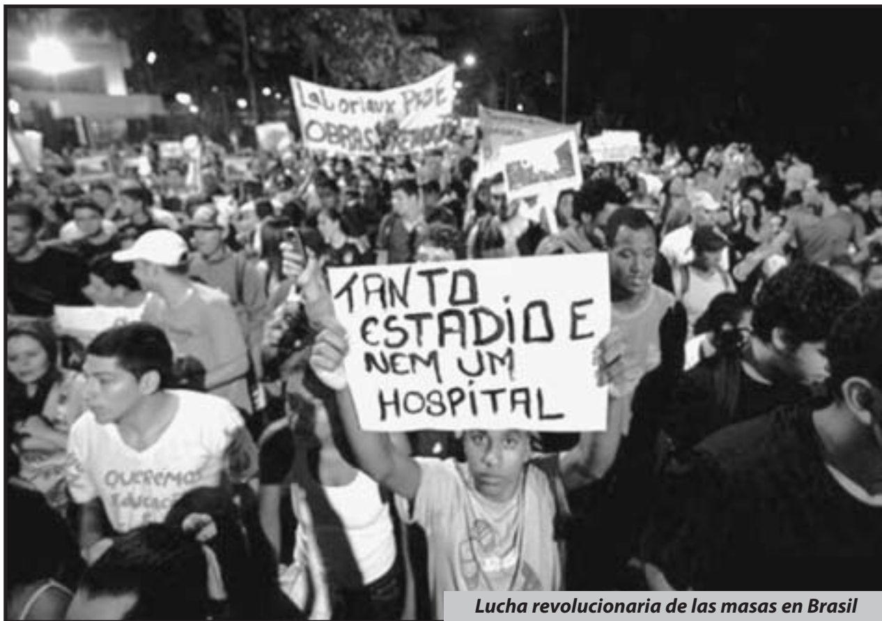
Lucha revolucionaria de las masas en Brasil

¡Hay que pelear como en Libia, Túnez, Egipto y Brasil! ¡Resistir como en Siria y luchar con los piquetes obreros como en las minas de Marikana en Sudáfrica y con el método de la huelga general como ayer en Grecia!