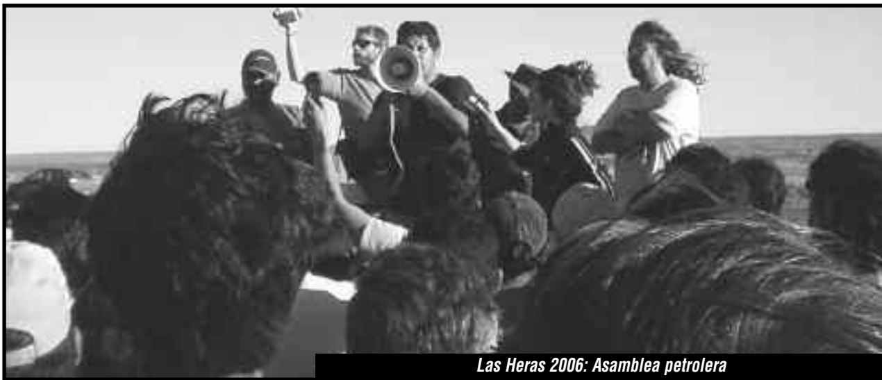
Las Heras 2006: Asamblea petrolera