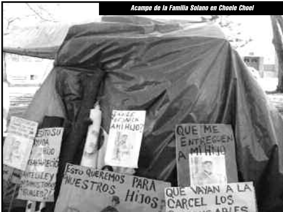
Acampe de la Familia Solano en Choele Choel