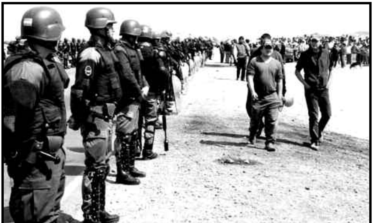
2006: La gendarmería K ocupa Las Heras, Santa Cruz

Quería pedirles algo, los trabajadores y el pueblo de Las Heras perdieron el miedo y se merecen muchos más aplausos que los que hablamos acá, porque ellos miraron a los fachos de este tribunal y en la cara les dijeron "no te tengo miedo, vos me torturaste y te lo digo en la cara", a mí me parece que el aplauso de "fuerza, estamos con ustedes", "no están solos", son para ellos. "Vamos a tomar los colectivos y vamos a ir a Las Heras para estar con ellos, con sus familias, dando vueltas a la plaza como hacían las Madres de Plaza de Mayo en los '70". •