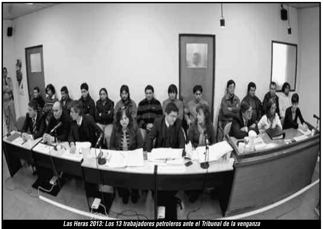
Las Heras 2013: Los 13 trabajadores petroleros ante el Tribunal de la venganza

Además Alberto Luciani, defensor de algunos de los compañeros petroleros imputados, reafirmó las