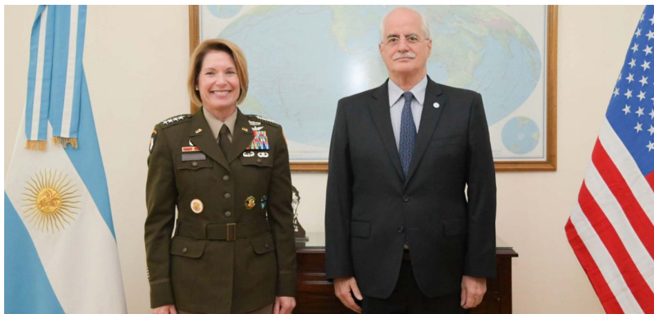
El Ministro de Defensa, Taiana junto a Laura Richardson, jefa del Comando Sur de EE.UU.

El imperialismo yanqui pisa entonces su "patio trasero". Viene por todo. Incluso está dispuesto a romper los mercados