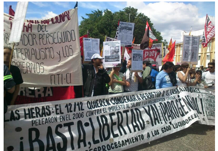
12/12/2013: Movilización a los tribunales de Caleta Olivia, Santa Cruz, que condenaron a cadena perpetua a los petroleros de Las Heras

Hoy más que nunca necesitamos luchar juntos por encima de las fronteras. Ese es el camino para fortalecer la lucha por