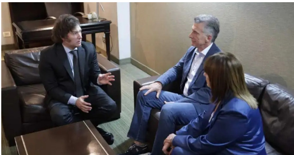
Milei reunido con Mauricio Macri y Patricia Bullrich, luego de su triunfo en el balotaje

nández a Milei profundizó la bonapartización del régimen semi-parlamentario argentino. El presidente fue escondido en Olivos y su ministro de Economía asumió todas sus funciones, mientras el verdadero Parlamento que funcionaba eran las reuniones de los grandes grupos económicos. ¿El Congreso? Estaba pintado. Y mientras esto acontecía, la izquierda en una campaña electoral vergonzosamente reformista como la que hizo el FIT-U, clamaba que quería "más y más diputados para incidir a favor de la clase obrera", cuando todo se resolvía en los coloquios de IDEA, en los directorios de las transnacionales y en la embajada yanqui.