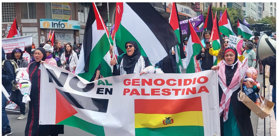
Comunidad palestina en la movilización del 25N en La Paz

Nosotras, las mujeres trabajadoras y socialistas de "Paso a la Mujer Trabajadora" denunciaremos la masacre sionista en Gaza comandada por los yanquis contra la resistencia palestina. Así también levantamos en alto el grito de: