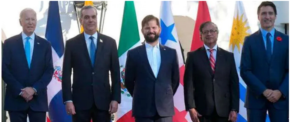
De izq. a der.: Biden (EE.UU), Abinader (Rep. Dominicana), Boric (Chile), Petro (Colombia) y Trudeau (Canadá)

Por ello Petro y Boric se ganaron un lugar destacado en la agenda de Biden y sostuvieron reuniones bilaterales con su jefe del estado mayor norteamericano, donde estos