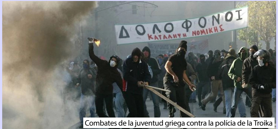
Combates de la juventud griega contra la policía de la Troika

Reproducimos el comunicado de los Presos Políticos de Grecia llamando a un día de huelga de hambre en solidaridad con la resistencia palestina.