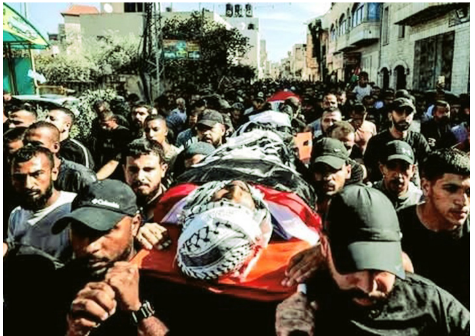
10/11/23. Funeral de palestinos asesinados en campo de refugiados de Jenin, Cisjordania

Pero no solo se trata de esto, sino que además la burguesía árabe tiene bien en