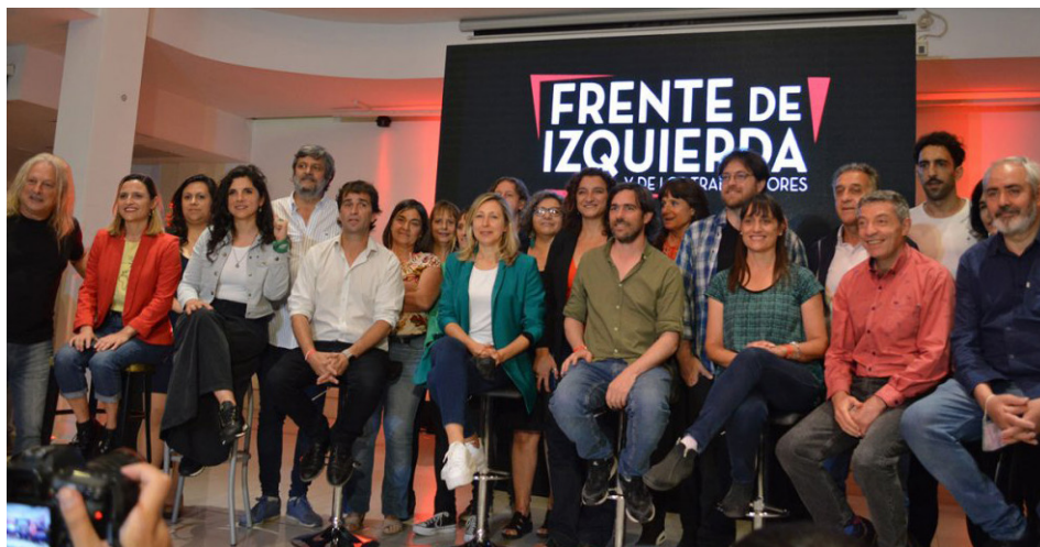
Los candidatos del FIT-U para las elecciones 2023

Esta autotitulada “Izquierda Comunista Cubana”, que de forma farsesca se