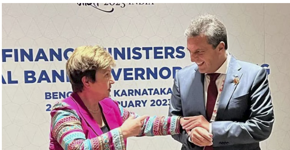
Massa con Georgieva titular del FMI en la Cumbre del G20. Febrero de 2023

Las pandillas de las burguesías nativas, asociadas en múltiples negocios como socias menores de banqueros y transnacionales, y que son tanto o más esclavistas que estos con sus obreros, pretendían quedarse aunque sea con una pequeña parte del saqueo de las riquezas de la nación como el gas, la renta agraria,