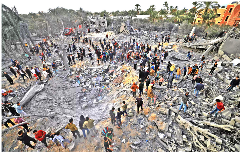
22/11/2023. Jan Yunis, en el sur de la Franja de Gaza

Desde Gaza, con la autoridad que tiene Hamas, multiplicaría por un millón el combate si saliera un llamamiento a todas las masas palestinas de Cisjordania, Jordania, Líbano y toda la diáspora palestina a que