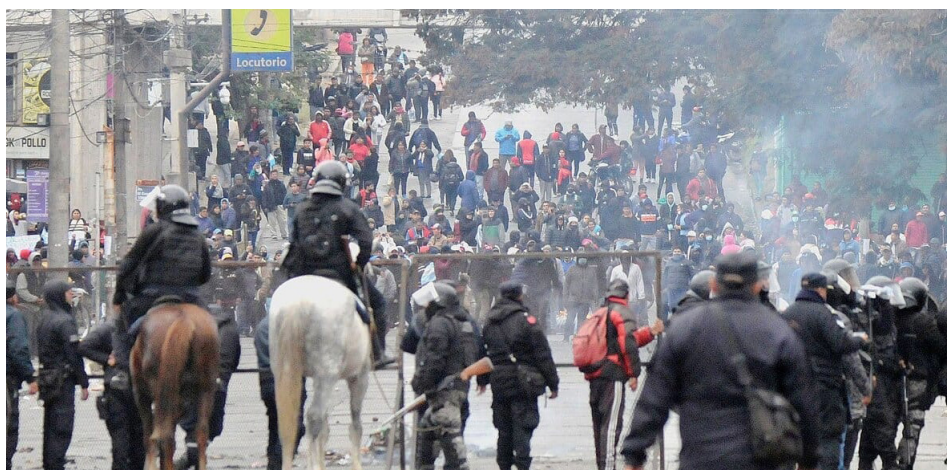
Junio 2023. Jujueño

¿De qué hablan estos señores antimarxistas que ven a la clase obrera como una sumatoria de individuos separados de sus organizaciones que ellos crearon y que a cada paso los traicionan?