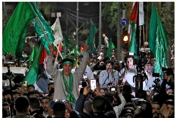
Presos palestinos liberados en Ramallah, Cisjordania