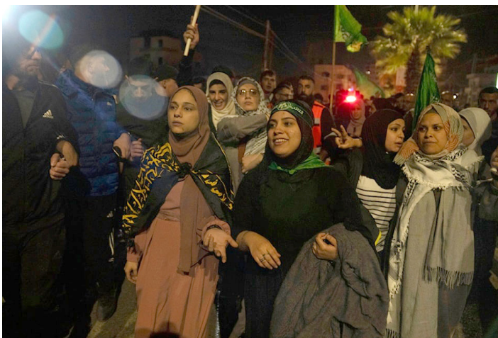
Mujeres palestinas liberadas regresan a su pueblo Beitunia, Cisjordania