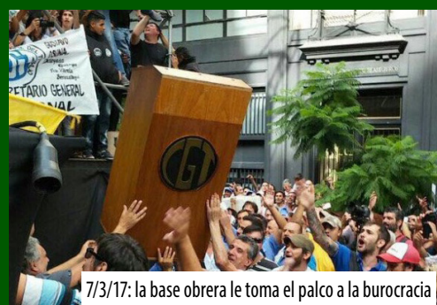
7/3/17: la base obrera le toma el palco a la burocracia

¡Basta de burocracia sindical entreguista!