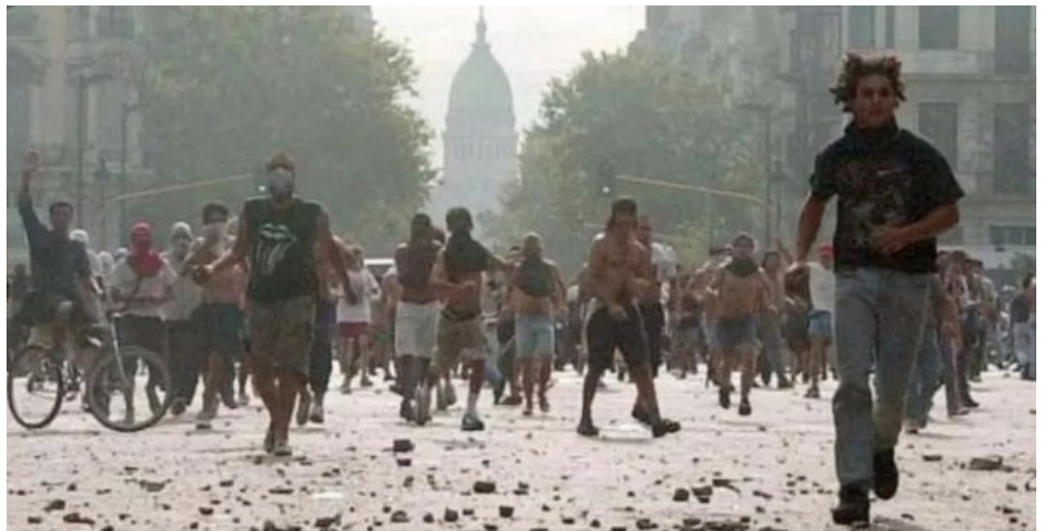
20 de diciembre de 2001. Argentinazo

obrero y trabajo digno, son las demandas mínimas para unir a los trabajadores.