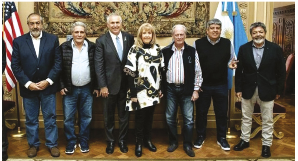
La burocracia sindical de la CGT en la embajada de EE.UU. junto a Stanley

La farsa electoral fue motorizada por una demagogia feroz. Insistimos, Massa repartía limosnas durante su campaña, a las que llamaba “derechos”, como la devolución del IVA y el aumento del mínimo no imponible del impuesto al salario, mientras