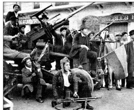
Milicias obreras y campesinas de la COB de 1952

¡Juicio y castigo a todos los generales del ejército banzerista, golpistas y asesinos de Senkata y Sacaba! ¡Fusil, metralla, Bolivia no se calla!