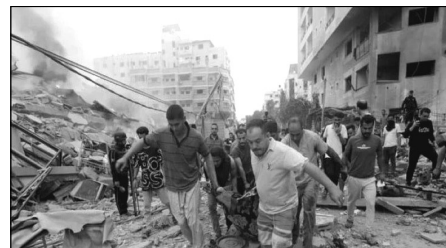
Bombardeos del sionismo en Gaza

¡Medio Oriente tiene que ser la tumba del sionismo y el imperialismo!