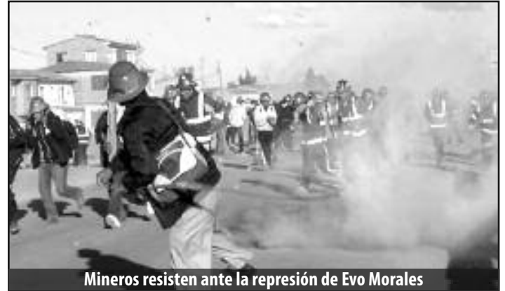
Mineros resisten ante la represión de Evo Morales

No podemos confiar en esta justicia de los patrones digitada y controlada por el MAS y el gobierno de Morales. Todas las organizaciones de la clase obrera deben lanzar ya una lucha por el desprocesamiento inmediato de los compañeros. Y es que no podemos pensar en conquistar ninguna de nuestras demandas si antes no liberamos a nuestros compañeros que están siendo amenazados de ser llevados presos.