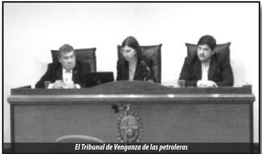
El Tribunal de Venganza de las petroleras

Hay que pasar de las palabras a los hechos en contra de