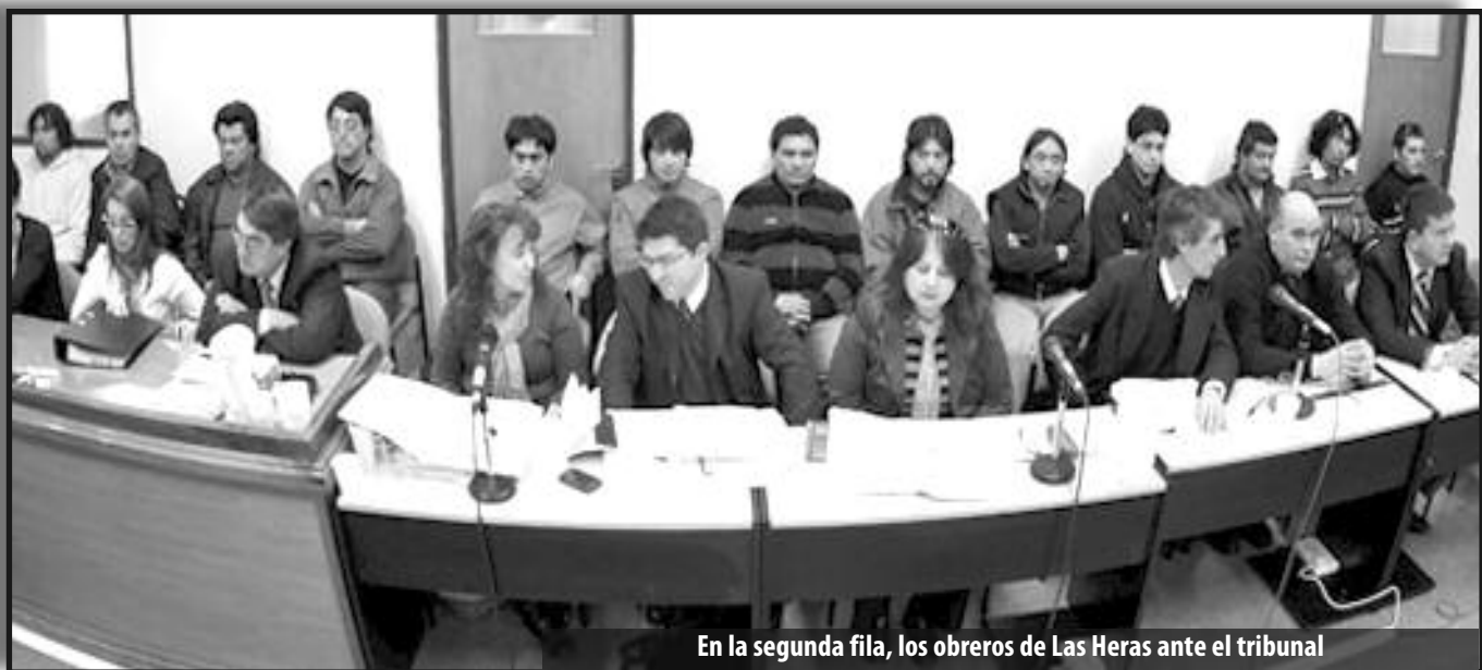
En la segunda fila, los obreros de Las Heras ante el tribunal

Preparan así un escarmiento contra el conjunto del movimiento obrero