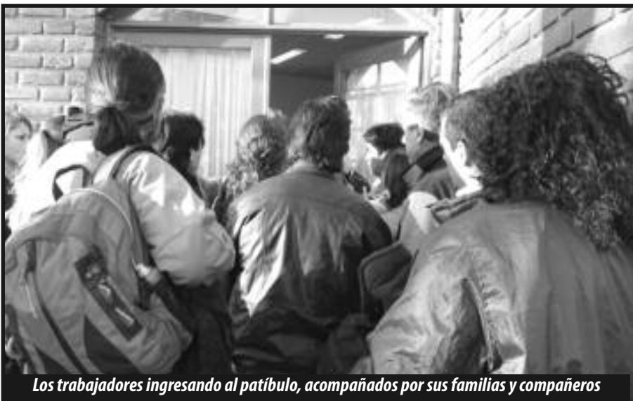
Los trabajadores ingresando al patíbulo, acompañados por sus familias y compañeros

Este juicio contra los luchadores obreros va a pasar a la historia, no como dice