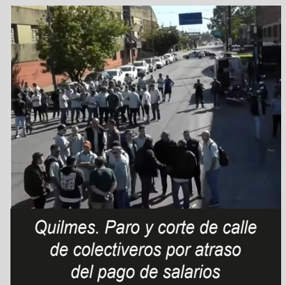
Quilmes. Paro y corte de calle de colectivos por atraso del pago de salarios