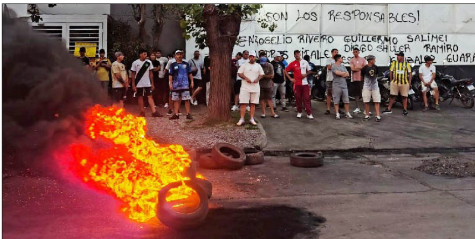
Rosario. Trabajadores del frigorífico Euro toman la planta ante los despidos

Estas demandas por el trabajo y el salario deben ser las demandas mínimas de la clase obrera, sobre las cuales se puede comenzar toda lucha y reclamo serio.