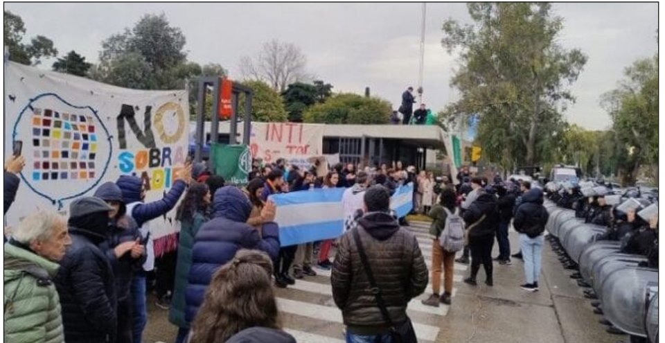
Represión y despidos en el INTI

De forma vergonzosa, los farsantes del PJ que se pintan de “anti mileístas” dicen que el pueblo está “resignado”. Algunos dirigentes de la izquierda escriben libros llamando a “derrotar la resignación”... ¿De qué “resignación”