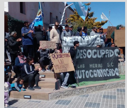
Desocupados autoconvocados, Las Heras, Santa Cruz