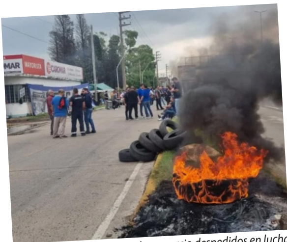
Empleados de comercio despedidos en lucha

¡Fuera Milei, el FMI y el imperialismo yanqui! ¡HUELGA GENERAL!