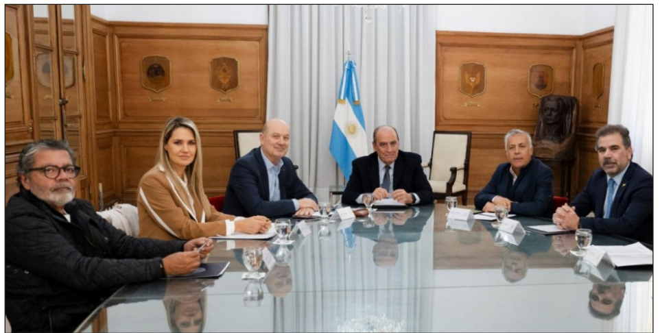
Consejo de Mayo. El gobierno de Milei junto a Martínez de la UOCRA-CGT y los gobernadores

Ahora, el Triunvirato junto al PJ y de más políticos patronales, se preparan