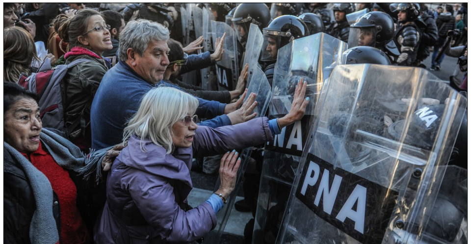
Jubilados reprimidos por la policía federal

Se trata de dos Argentinas: la de los de arriba, una minoría de parásitos que le viven chupando la sangre a la clase obrera y su trabajo, y la de la amplia mayoría del pueblo trabajador.