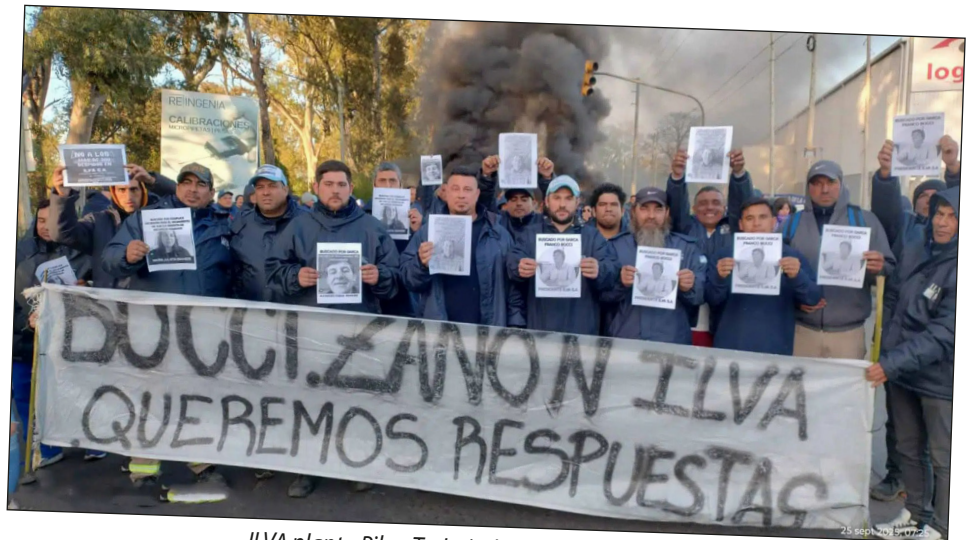
ILVA planta Pilar. Trabajadores ceramistas despedidos siguen de pie lucha

Esto es lo que necesitamos para triunfar.