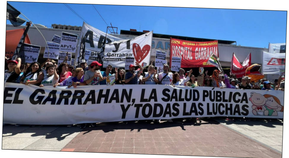
Trabajadores del Garrahan en lucha

Iniciativas como las de las organizaciones obreras del Plenario del Sindicalismo Combativo, la reciente reunión del Encuentro de Zona Norte o los trabajadores que se organizan para defender a los obreros condenados y procesados por luchar, como los maestros de Misiones y las docentes de Chubut, todos ellos ya tienen en sus manos la posibilidad de llamar ya a este Comité de Lucha Nacional.