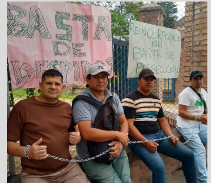
Trabajadores despedidos del Grupo Ledesma

¡Hay fuerzas! Las de los estudiantes y las universidades que luchan por subsistir, mientras este gobierno cipayo compra aviones de guerra truchos para sacarse una foto, que luego serán chatarra en algún aeropuerto militar. Es que la verdadera Fuerza Aérea de este gobierno de lacayos de la colonia que intentan instaurar, está en la base de la OTAN de Malvinas. Eso es lo que son: traidores a la patria.