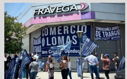
Cierre de sucursales de Frávega en Temperley y Pergamino en la provincia de Buenos Aires