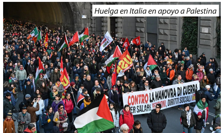
Huelga en Italia en apoyo a Palestina

¡Palestina libre del río al mar con capital en Jerusalén!