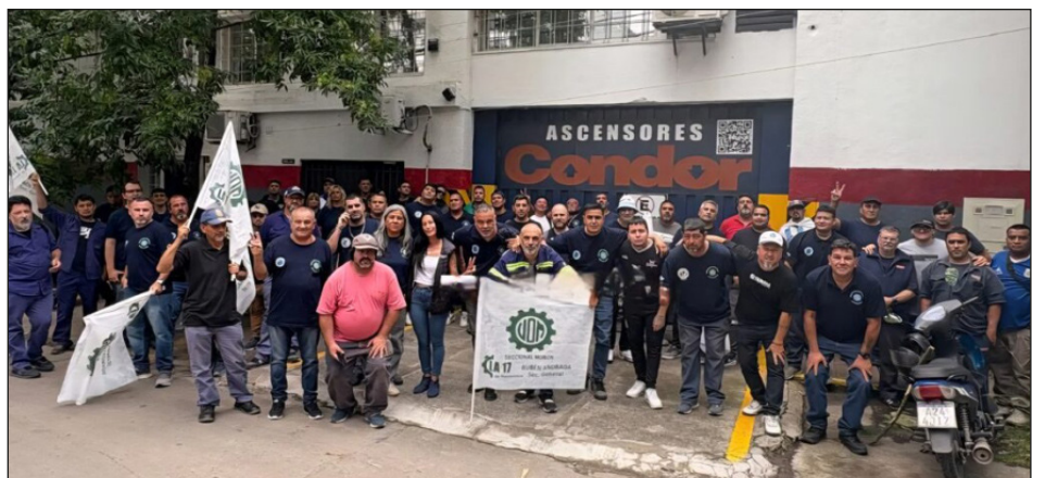
Despididos ascensores Condor

Los obreros tenemos que hablar el lenguaje de la guerra, como hacen los grandes capitalistas que quieren sangre de los trabajadores. Con sus ataques brutales al movimiento obrero, coor-