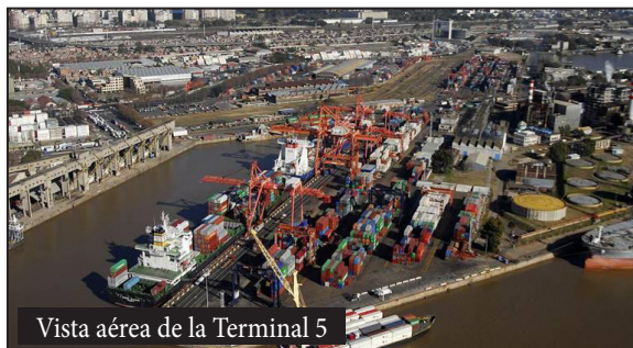
Vista aérea de la Terminal 5

Vimos que esto que nos pasaba a nosotros le iba a pasar al resto de los portuarios cuando se terminen las concesiones, que era un plan del gobierno y las empresas en acuerdo con los sindicatos. Aprovecharon la pandemia para pasar la precarización y ahora la pre-