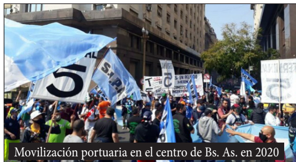
Mobilización portuaria en el centro de Bs. As. en 2020

Porque los gremios nos dejaron solos, nos entregaron. En abril, desde el Cuerpo de Delegados y la asamblea, llamamos a un bloqueo a las terminales 4 y T.R.P. Llamamos a los trabajadores de las demás terminales a parar el puerto juntos, pero los sindicatos lo impidieron. Los compañeros de las otras terminales se